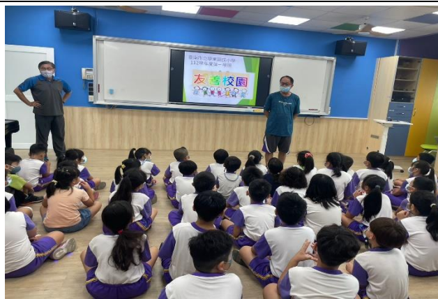
說明：校園霸凌預防