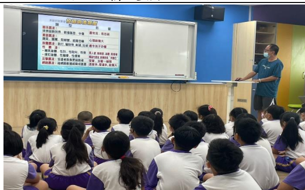
說明：校園霸凌預防