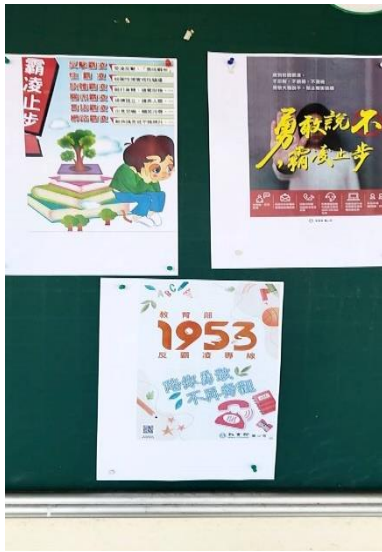
說明：校園霸凌預防