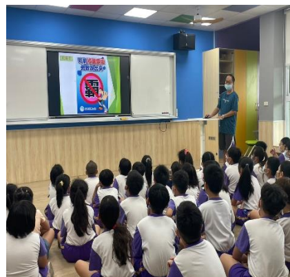
說明：校園霸凌預防