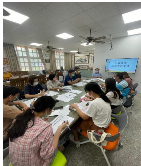
說明：週三下午辦理校園霸凌研習