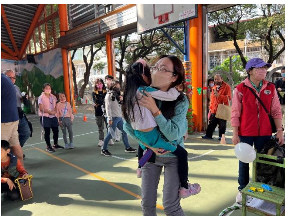
幼兒園學童參與親子趣味競賽。