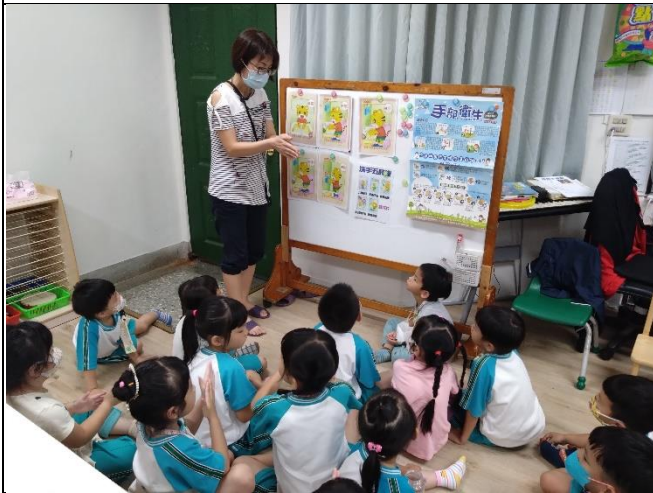
時間：112年9月1日 地點：彩虹班教室 活動名稱：洗手五步驟~濕、搓、沖、捧、擦。 人數：22人