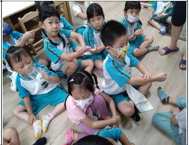
時間：112年9月1日 地點：彩虹班教室 活動名稱：預防病毒洗手7口訣~內外夾弓大立腕 人數：22人