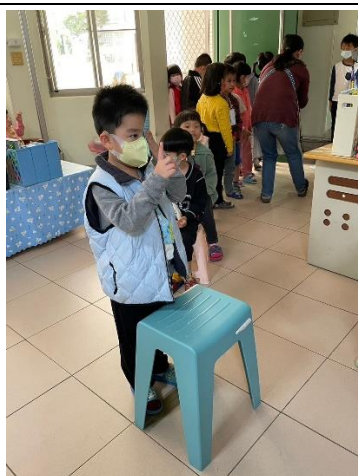
幼兒園學童進行視力檢測。