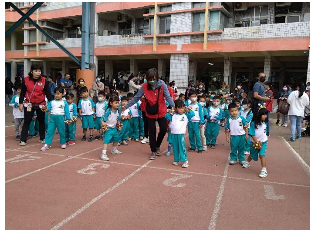
幼兒園學童進行運動會跑步競賽。