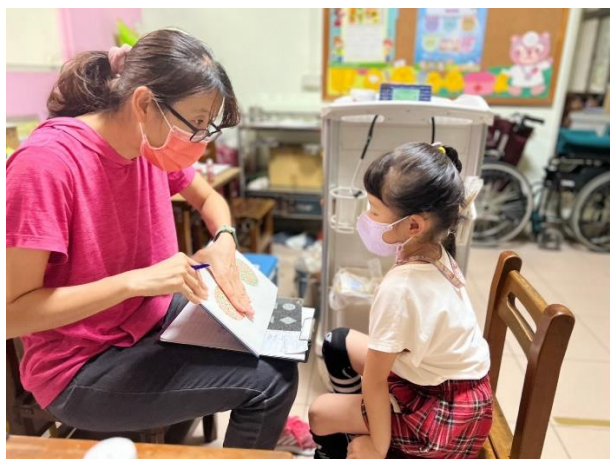
幼兒園學童進行辨色力檢測。