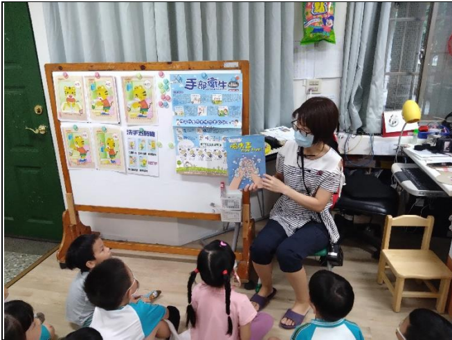
時間：112年9月1日 地點：彩虹班教室 活動名稱：勤洗手、遠離腸病毒 人數：22人