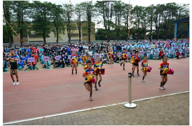
幼兒園學童參與運動會體操表演活動。