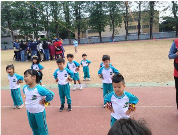
幼兒園學童參與大會操表演活動。