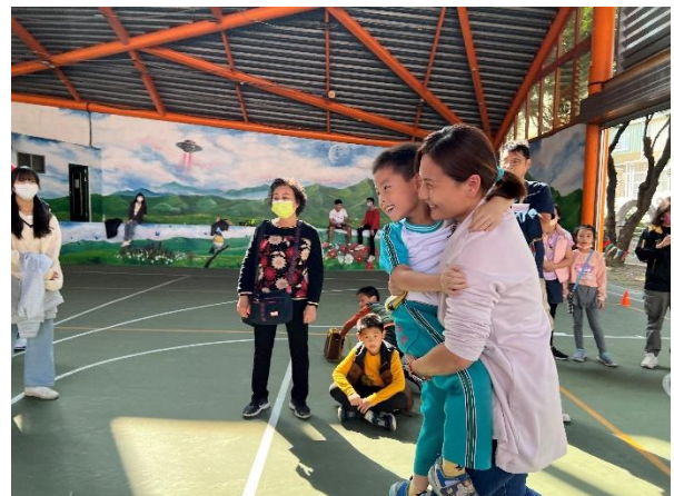
幼兒園學童參與親子趣味競賽。