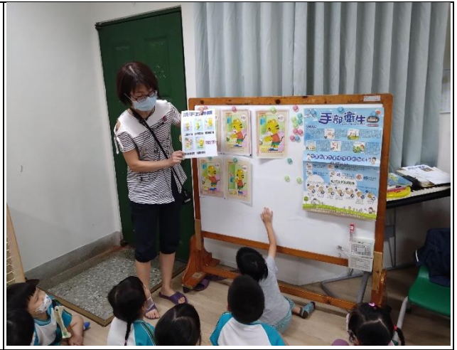
時間：112年9月1日 地點：彩虹班教室 活動名稱：洗手五時機 人數：22人