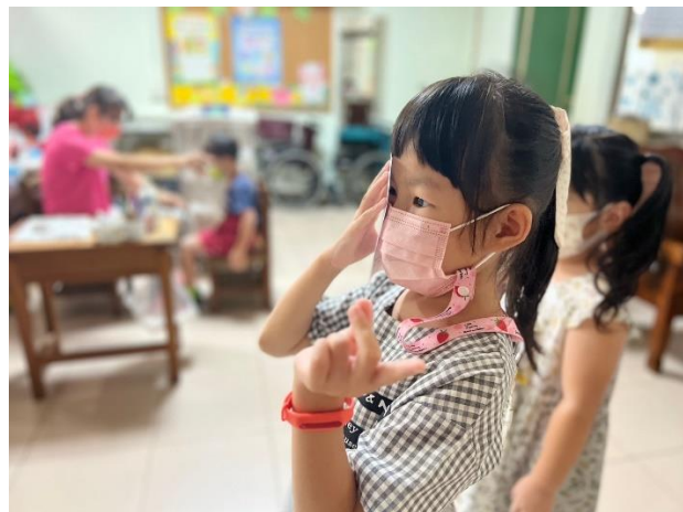
幼兒園學童進行視力檢測。