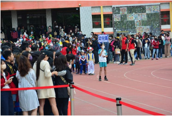
幼兒園參與學校運動會。