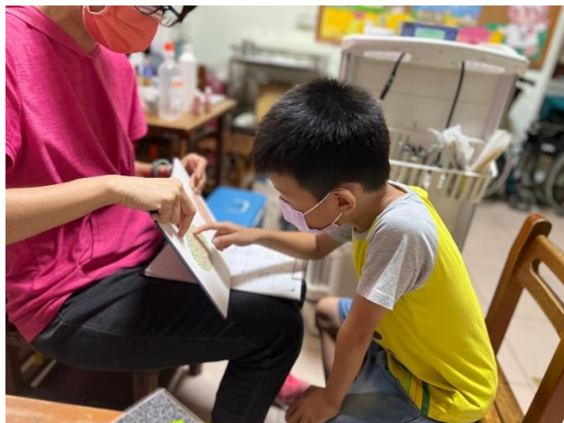
幼兒園學童進行辨色力檢測。