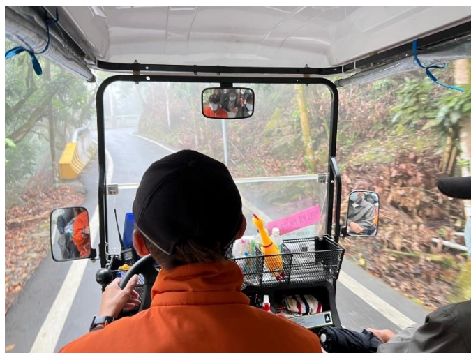
學生接種疫苗時之狀況。