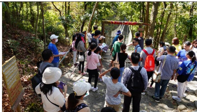
民眾排隊等候新冠疫苗之施打。