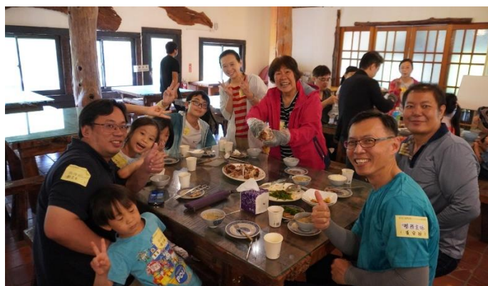
新冠疫苗施打後民眾休息區。