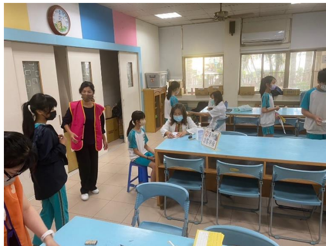
學生到醫師看診區評估是否適合施打疫苗。