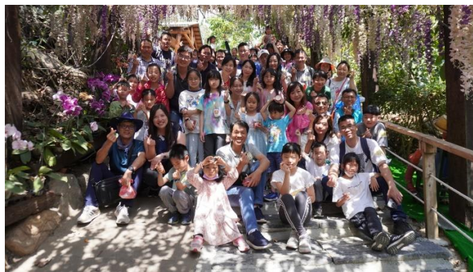
配合東區衛生所假日到校設立新冠疫苗大型接種站，此為醫師看診區。