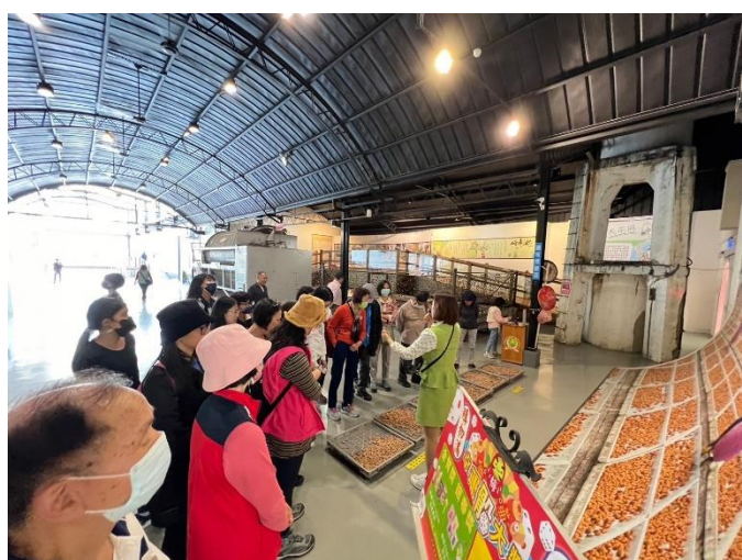
學生接種疫苗後，在規劃之休息區進行觀察。