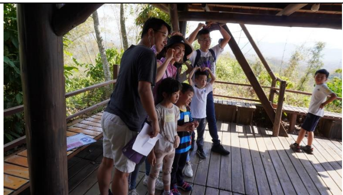
民眾填寫新冠疫苗施打之個人資料區域。