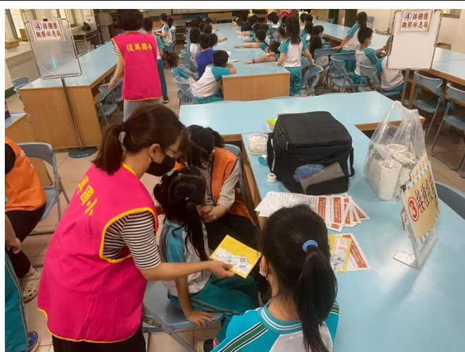
校內志工協助學生施打莫德納疫苗。