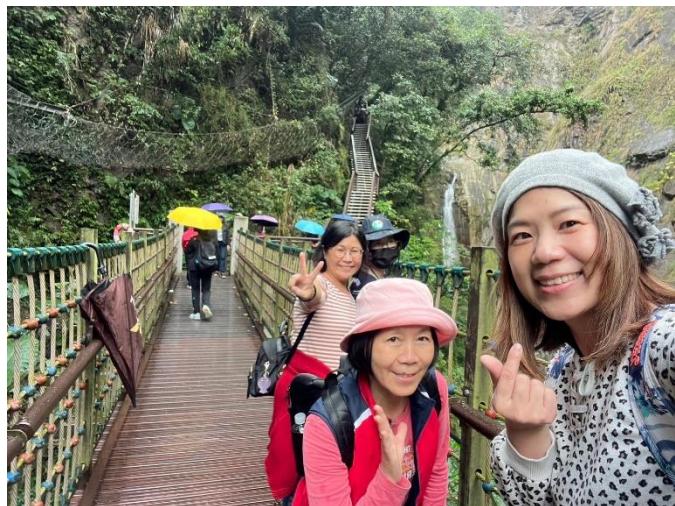
學生先到醫師看診區評估是否適合施打疫苗。