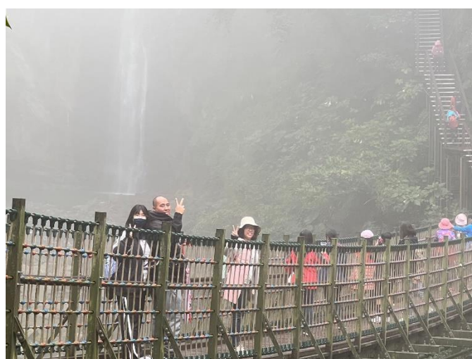
疫苗接種場所播放靜音影片，提供學生放鬆心情。