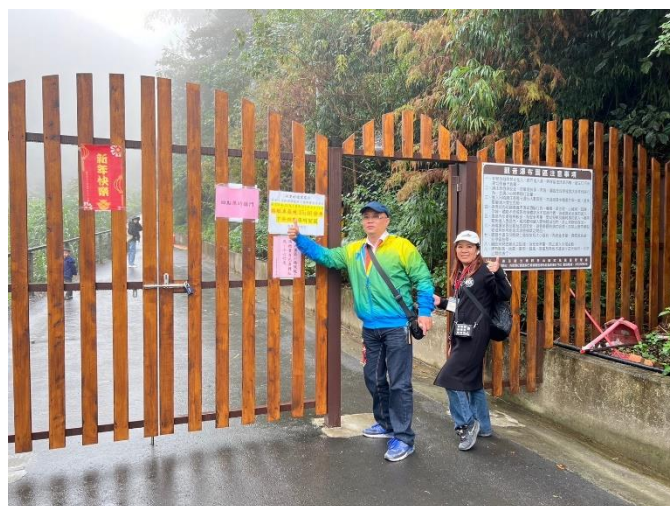
亦設立教師接種區提供校內教師一併接種。