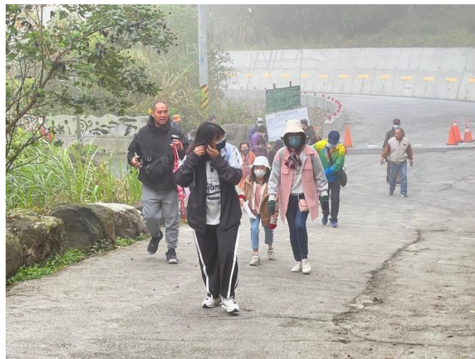
規劃三排的接種區域進行學生流感疫苗接種。