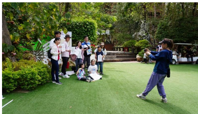
另一區為新冠疫苗評估後施打區。