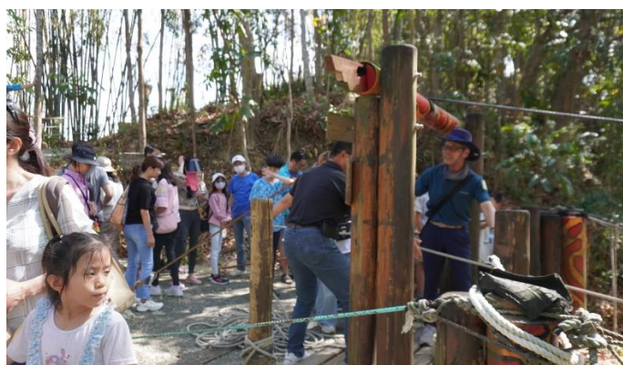
民眾繳交個人資料與健保卡線上核對區域。