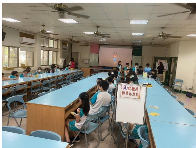
學生接種疫苗後，在規劃休息區進行觀察。