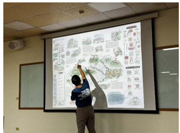
講師介紹台南附近的親山步道，鼓勵民眾登山健行。