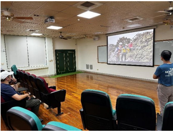
邀請社區家長到校進行親職教育講座，講師分享個人登山影片。