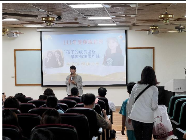
講師分享家長面對問題時心理層面的各項因素，一同陪伴孩子成長。