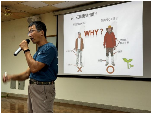
講師為民眾講解登山時個人適合的穿著，以達到保暖透氣的效果。