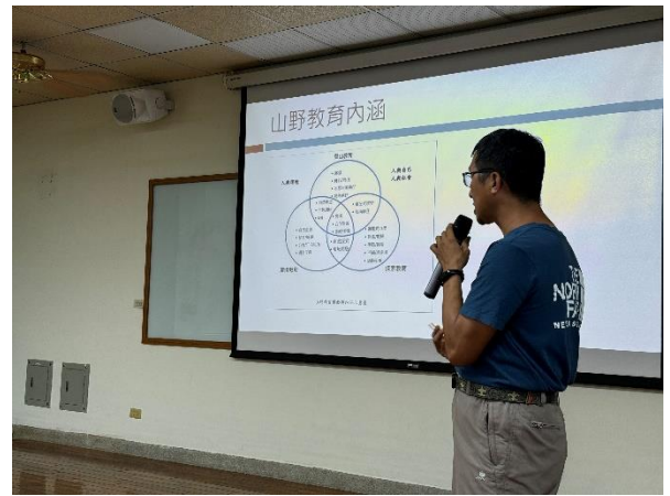
講師介紹山林教育的內涵，鼓勵民眾多運動。