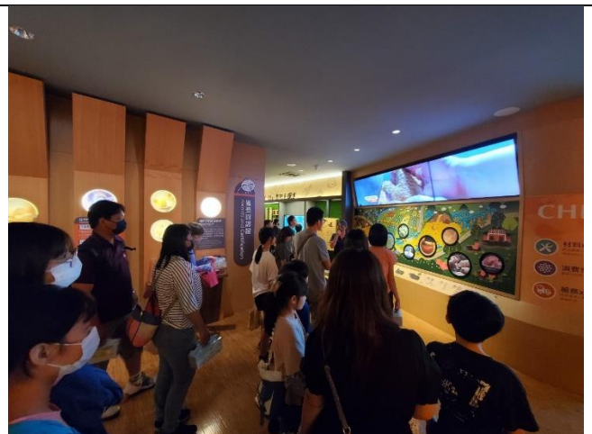
講師介紹目前食品安全對健康的重要影響。