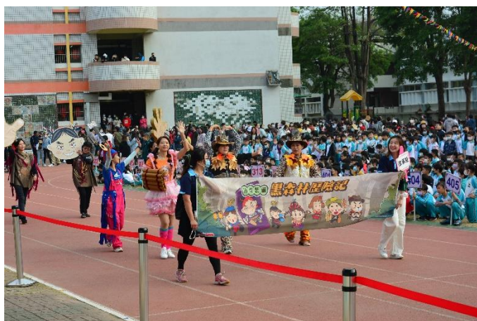
學校社區志工參與學校運動會。