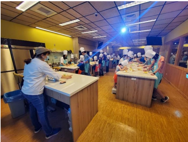
講師為親子講解蛋糕的簡易製作方式。