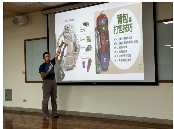
講師宣達登山時背包的選擇與打包技巧。