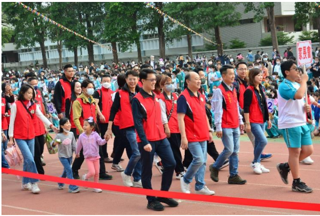
社區人士參與學校運動會。