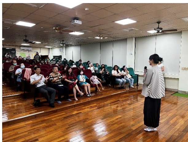
講師鼓勵民眾與孩子共同面對生活中的各項挑戰。