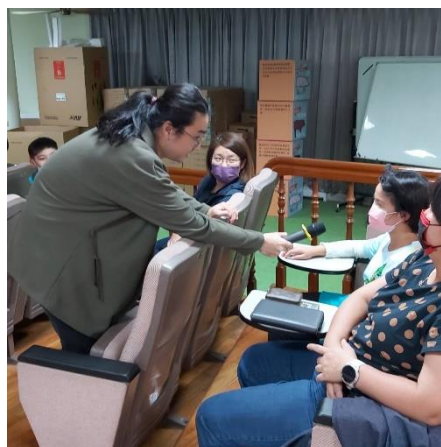
講師訪問台下家長曾經發生過的挫折與復原之過程。