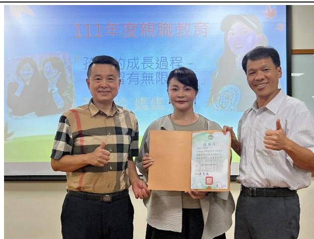
學校頒發感謝狀感謝講師對社區民眾的宣講。