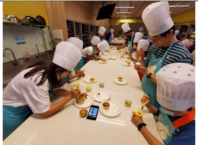
親子共同製作蛋糕。