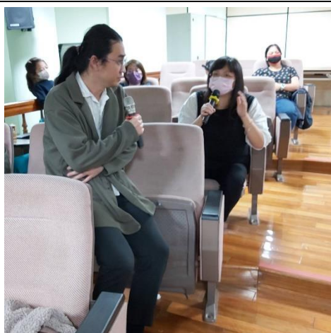
講師傾聽民眾對於生活中所發生的實際事例。