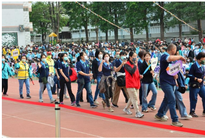
學校社區志工參與學校運動會。