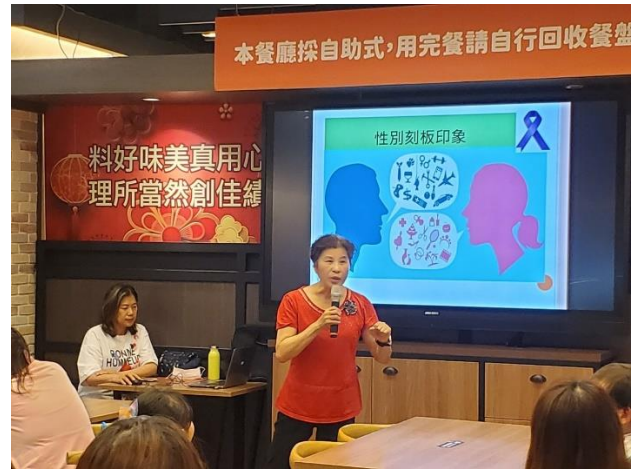
講師宣導性別刻板印象的成因。