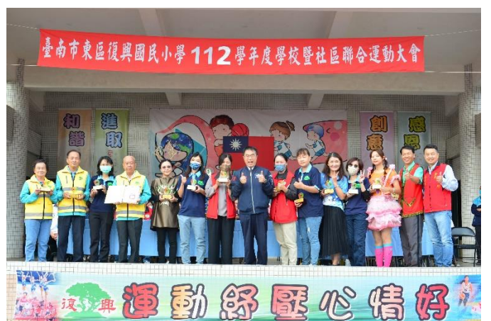
學校社區志工上台接受市長頒獎。