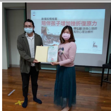
學校頒發感謝狀感謝講師對社區民眾的宣講。