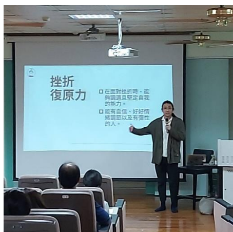
講師為民眾講解有關個人心理挫折復原力之知識。