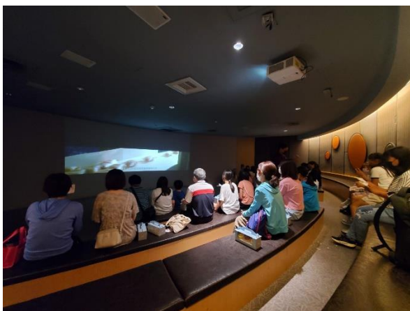
講師以影片的方式介紹目前食品健康的概念。