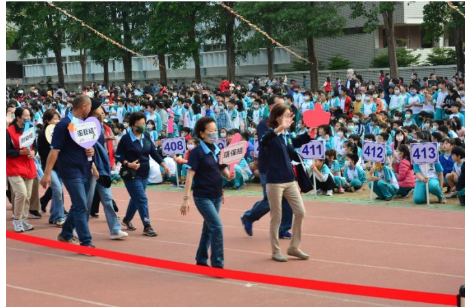
學校社區志工參與學校運動會。