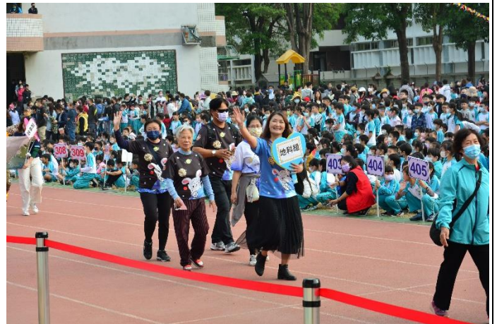
學校社區志工參與學校運動會。