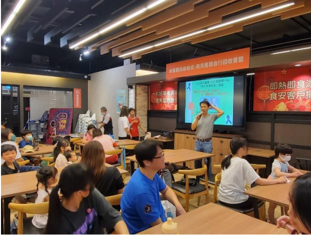
校長致詞感謝講師與家長共同陪同孩子，參與此次的活動。