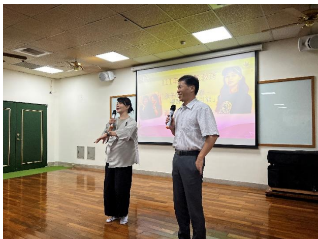
校長邀請社區家長到校進行名人親職教育講座，介紹周子瑜母親擔任本次講師。