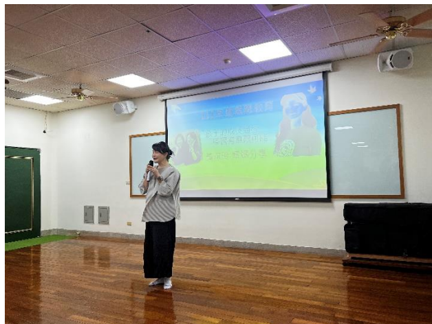
講師為民眾分享孩子的成長過程，學習有無限可能。