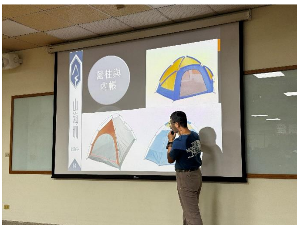
講師告訴民眾對於登山時休息用的帳篷搭建方式。