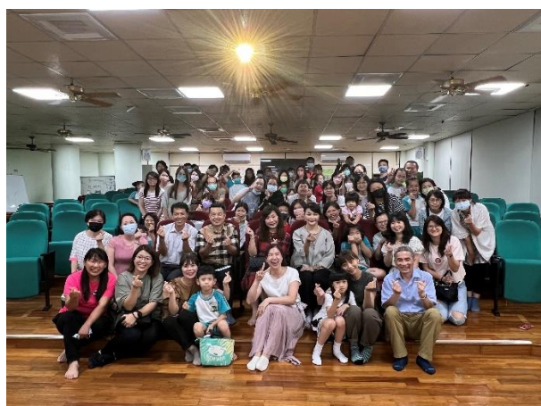
講師與社區民眾共同拍照留念。