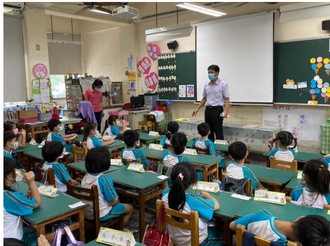
邀請成大醫院到校宣導校園糖尿病關懷，校長介紹來賓。