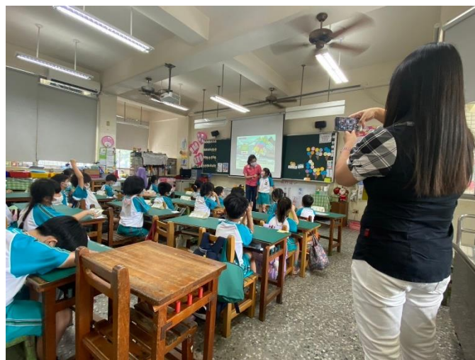
宣導學生對低血糖同學發生情況時的徵狀。