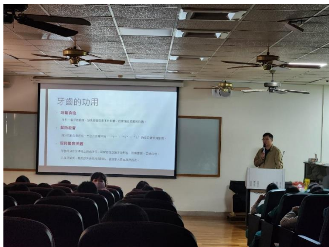
對學生宣導牙齒對身體健康的重要性。