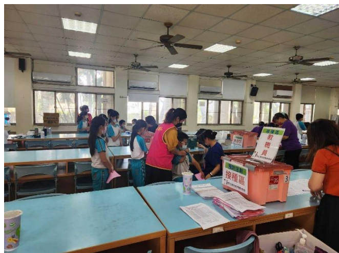
學生接種疫苗時之狀況。