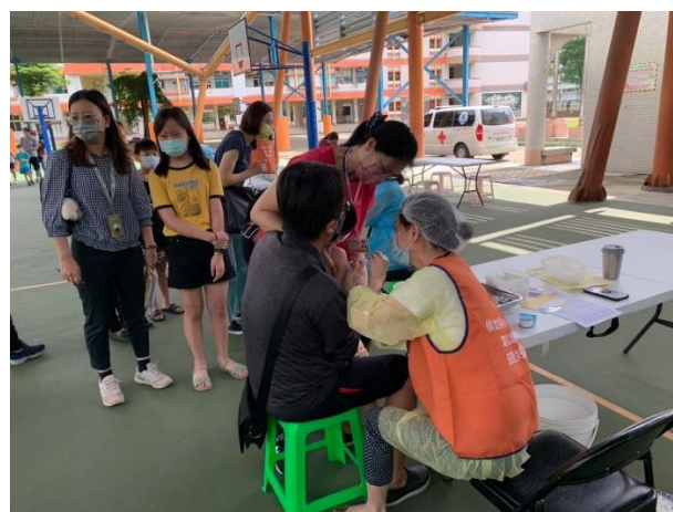
民眾排隊等候新冠疫苗之施打。