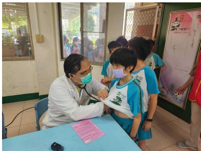
學生先到醫師看診區評估是否適合施打疫苗。