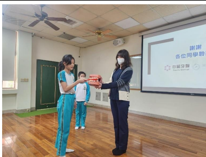
學生回答有獎徵答問題後索取獎勵。