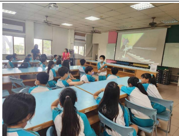
疫苗接種場所播放靜音影片，提供學生放鬆心情。