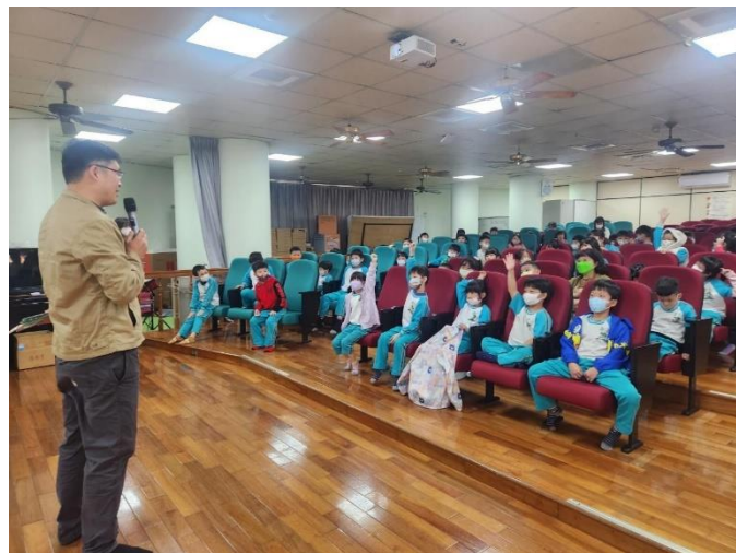
日麗牙醫醫生為學生宣導口腔維護知識。