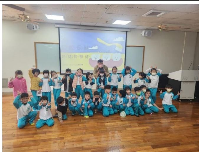
宣導後與學生共同拍照。