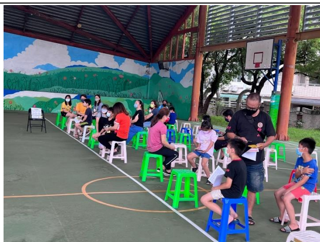
新冠疫苗施打後民眾休息區。