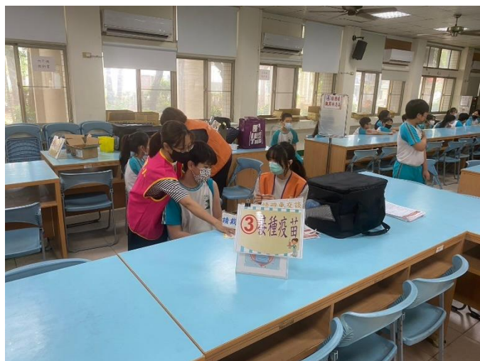
規劃兩排的接種區域進行學生新冠莫德納疫苗接種。