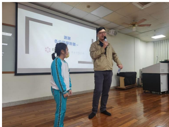
宣導後對學生進行有獎問答，檢視學生學習狀況。