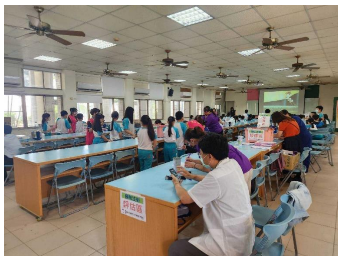
規劃三排的接種區域進行學生流感疫苗接種。