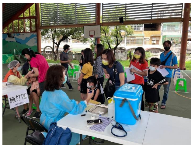
另一區為新冠疫苗評估後施打區。