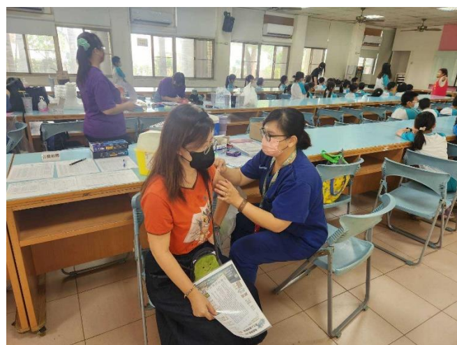
亦設立教師接種區提供校內教師一併接種。