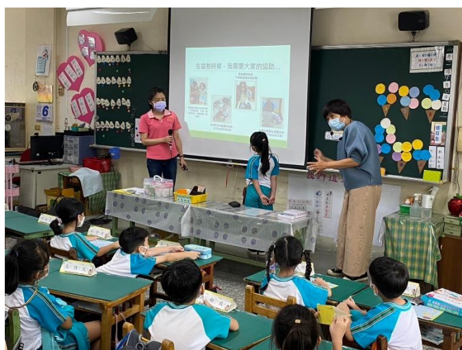
糖尿病童需要班上同學如何協助的方法。