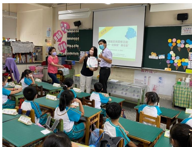
校長頒發感謝狀，感謝成大醫院的協助。