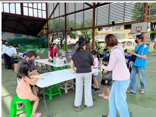
民眾填寫新冠疫苗施打之個人資料區域。