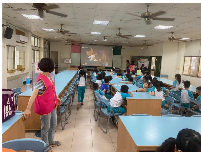
疫苗接種場所播放靜音影片，提供學生放鬆心情。