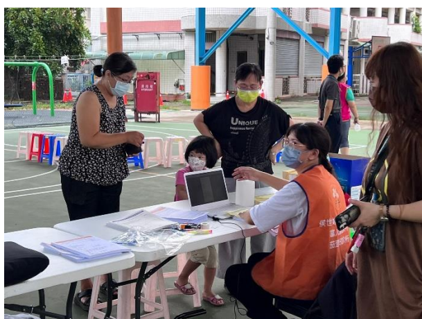
民眾繳交個人資料與健保卡線上核對區域。