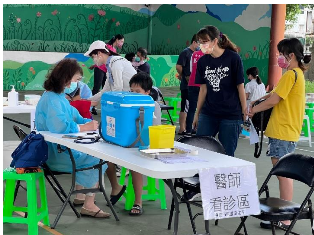
配合東區衛生所假日到校設立新冠疫苗大型接種站，此為醫師看診區。