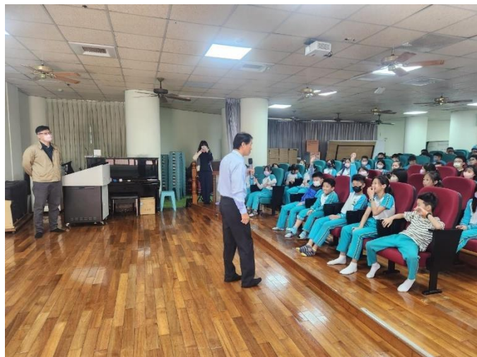
邀請日麗牙醫診所到校宣導口腔保健，校長介紹來賓。