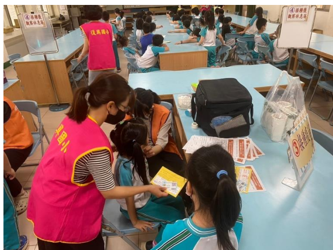
校內志工協助學生施打莫德納疫苗。