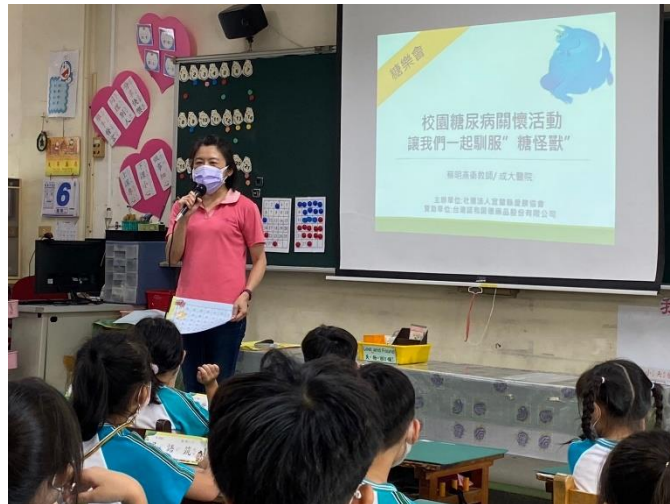
成大醫院衛教師為學生宣導糖尿病童相處之道。