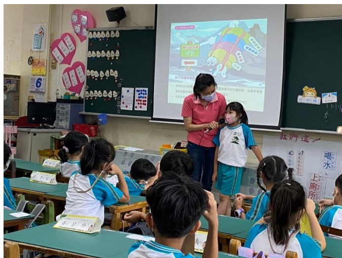
讓學生發表如何跟班上糖尿病童一起生活。