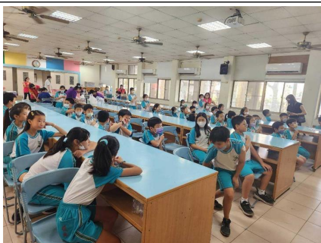
學生接種疫苗後，在規劃之休息區進行觀察。