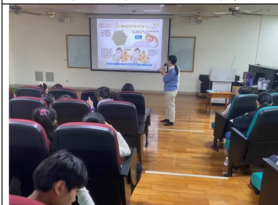
圖 9：認識 HIV 與 AIDS