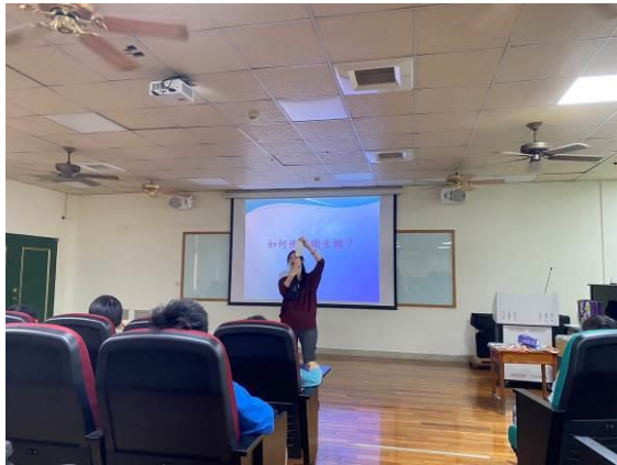
圖 7：示範衛生棉的使用及注意事項