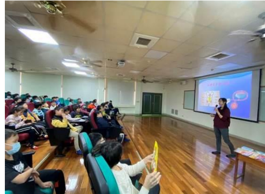
圖 4：認識男女生的第二性徵