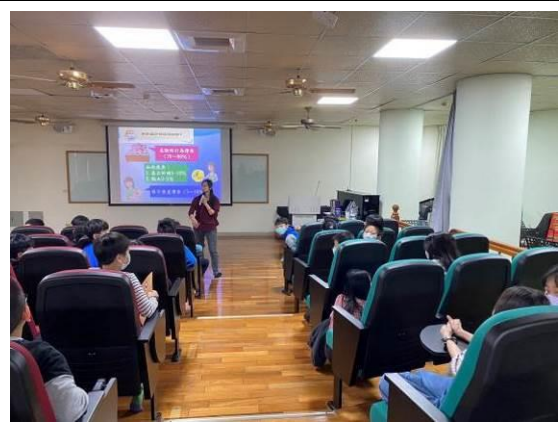
圖 10：介紹愛滋病的傳染途徑及預防