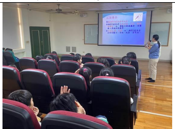
圖 10：介紹愛滋病的傳染途徑及預防