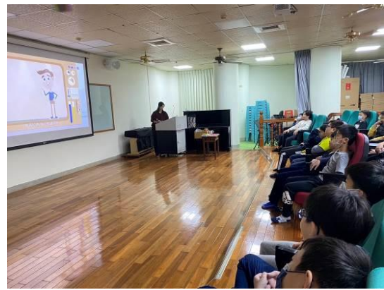
圖 2：學生認真觀看認識青春期影片