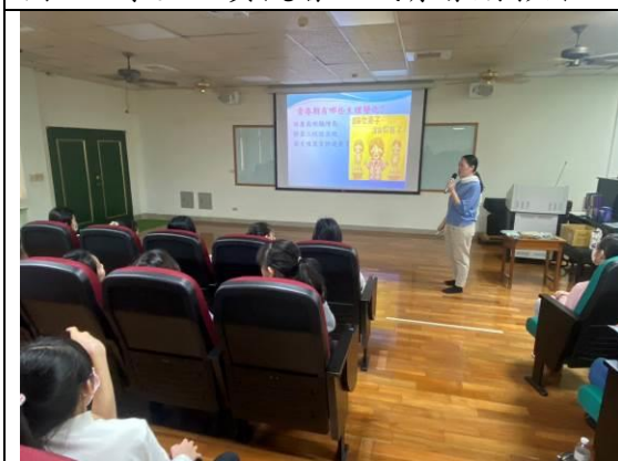
圖 3：認識青春期的變化