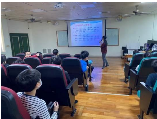
圖 3：認識青春期的變化