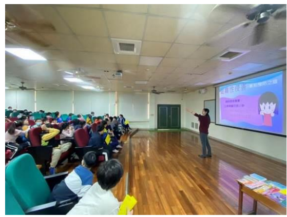
圖 8：講解何謂性騷擾及保護自己