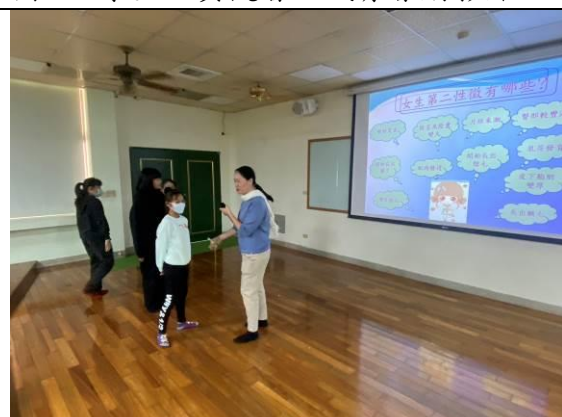
圖 4：認識男女生的第二性徵