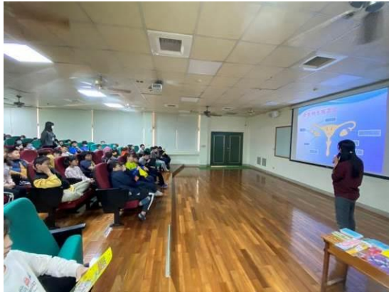
圖 5：認識男女生的第二性徵