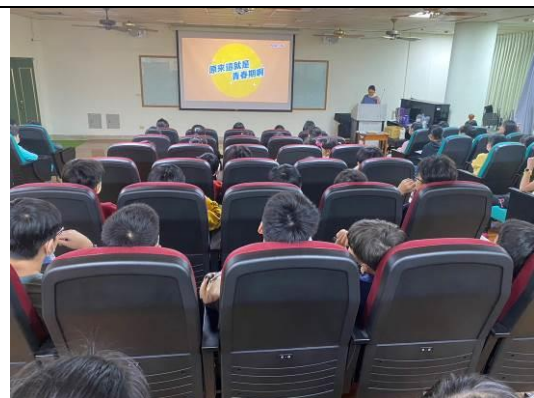
圖 2：學生認真觀看認識青春期影片