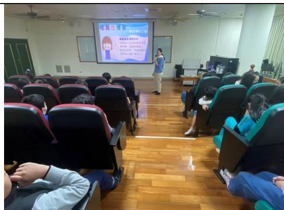
圖 8：講解何謂性騷擾及保護自己