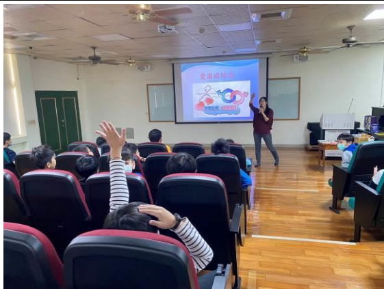
圖 9：認識 HIV 與 AIDS