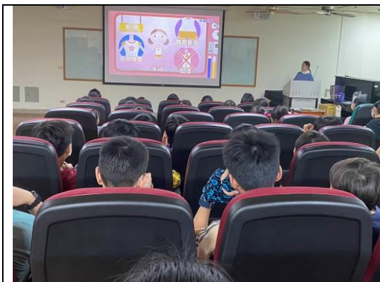
圖 1：學生認真觀看認識青春期影片