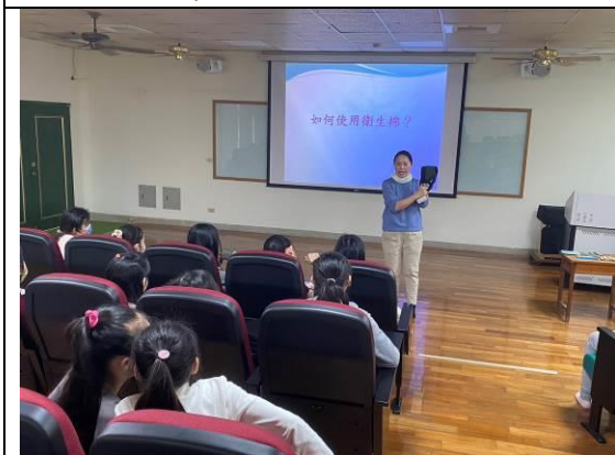
圖 7：示範衛生棉的使用及注意事項