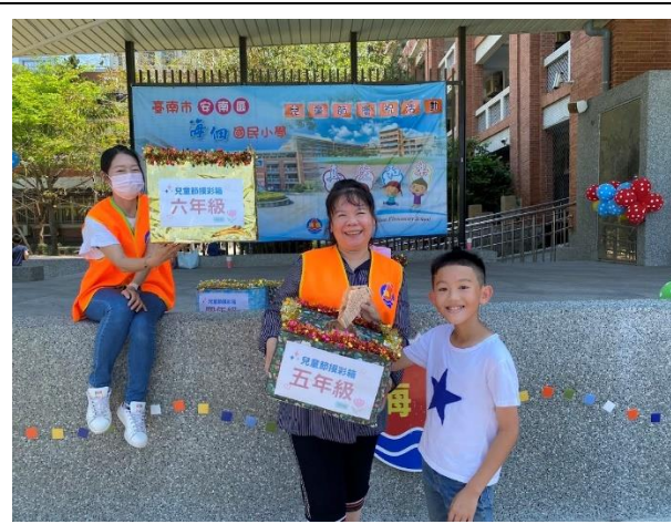
兒童節活動邀請社區人士共同參與 2