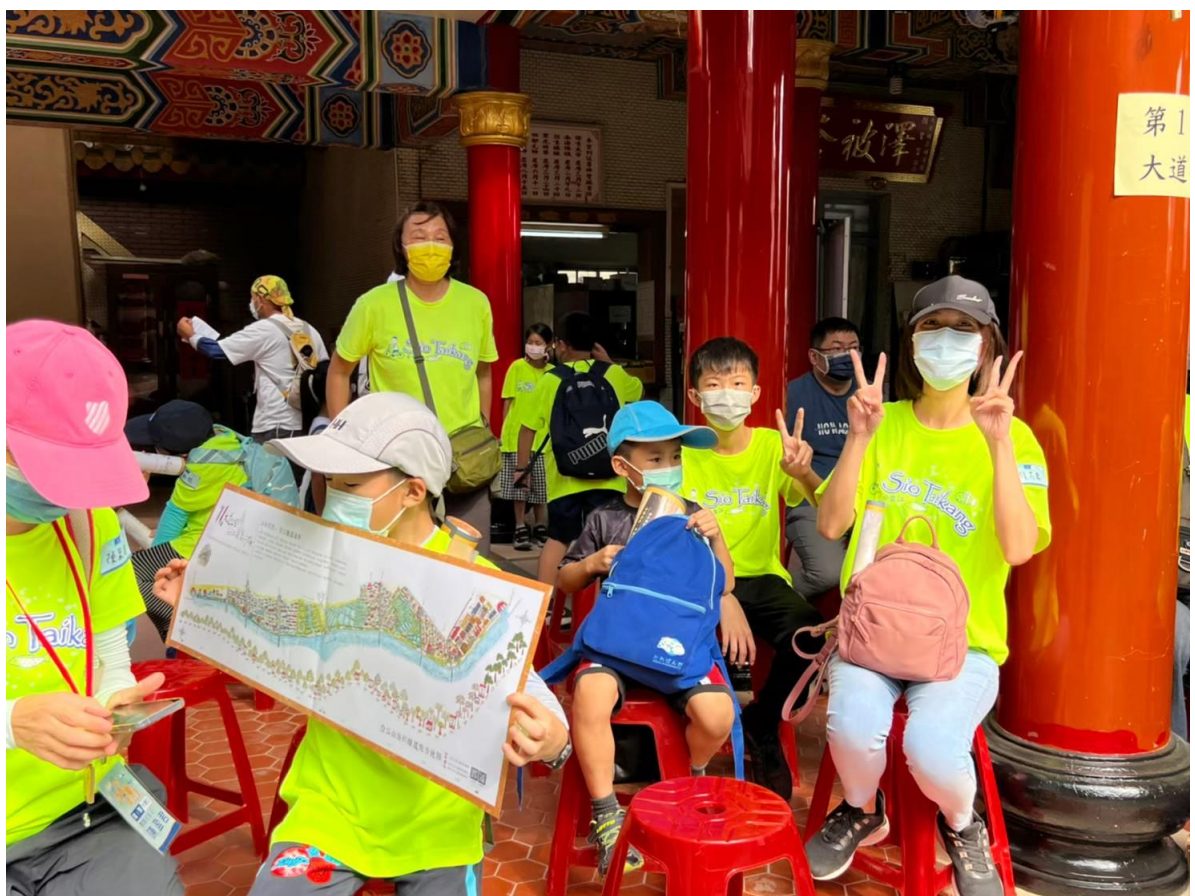
青春夜行體驗課程邀請社區人士共同參與 2