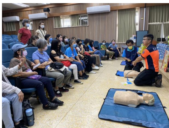
CPR 研習邀請社區志工共同參與