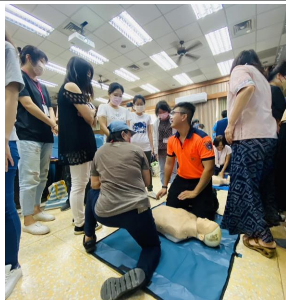
CPR 研習邀請社區志工共同參與