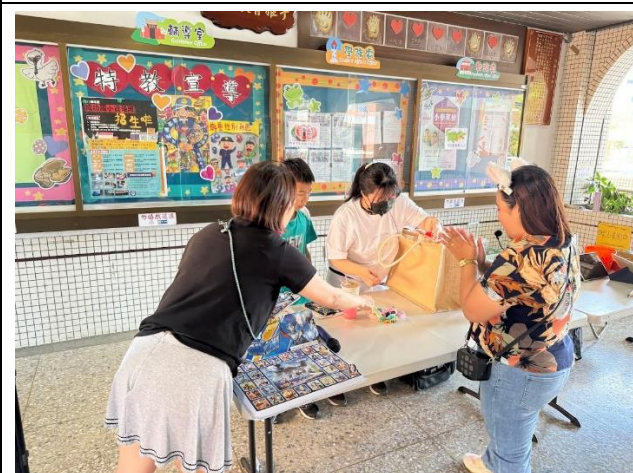
兒童節活動邀請社區人士共同參與 1