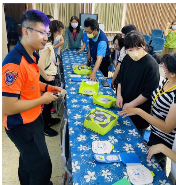
CPR 研習邀請社區志工共同參與