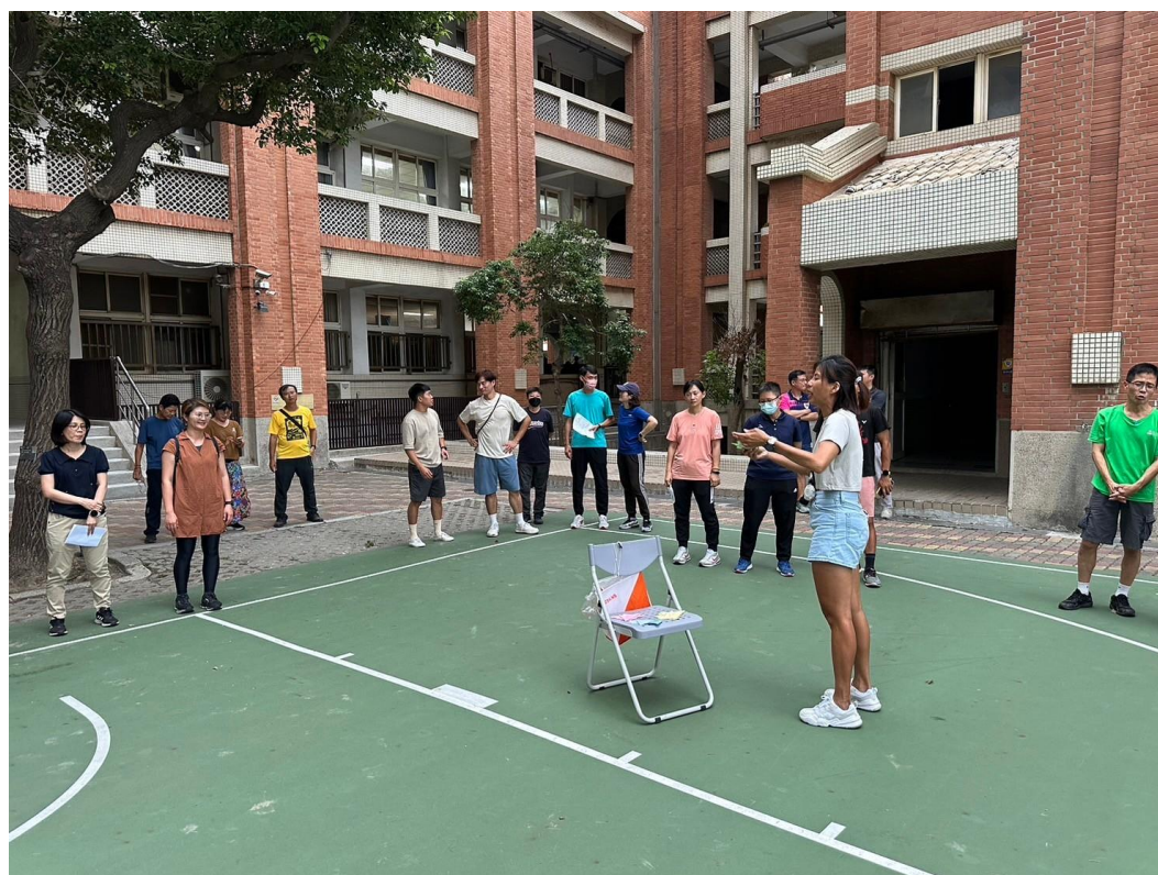
週三研習邀請社區人士共同參與～定向越野