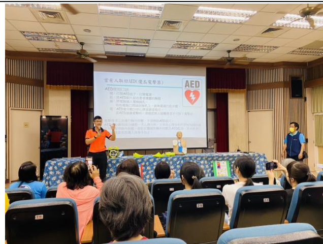
CPR 研習邀請社區志工共同參與