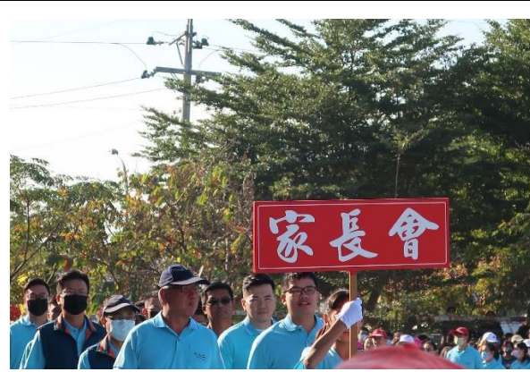
校慶運動會邀請社區人士共同參與 2