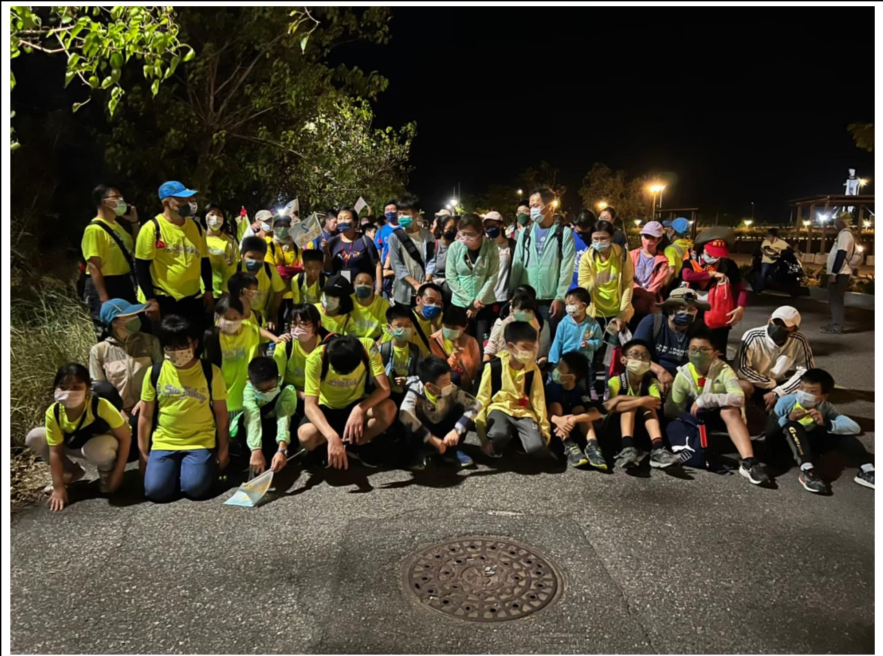
青春夜行課程邀請社區人士共同參與 1