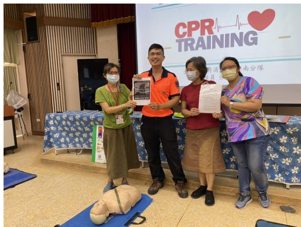
CPR 研習邀請社區志工共同參與