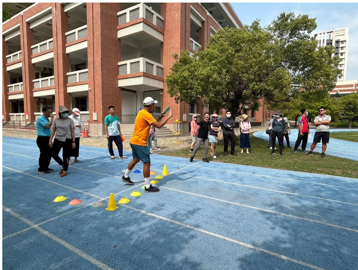
週三研習邀請社區人士共同參與～飛盤高爾夫