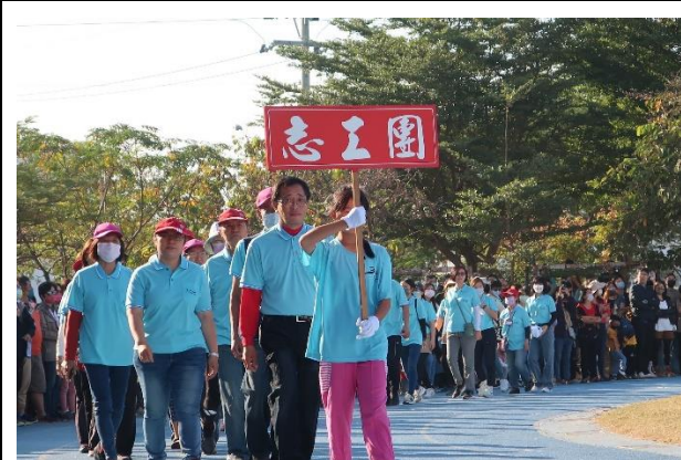
校慶運動會邀請社區人士共同參與 1