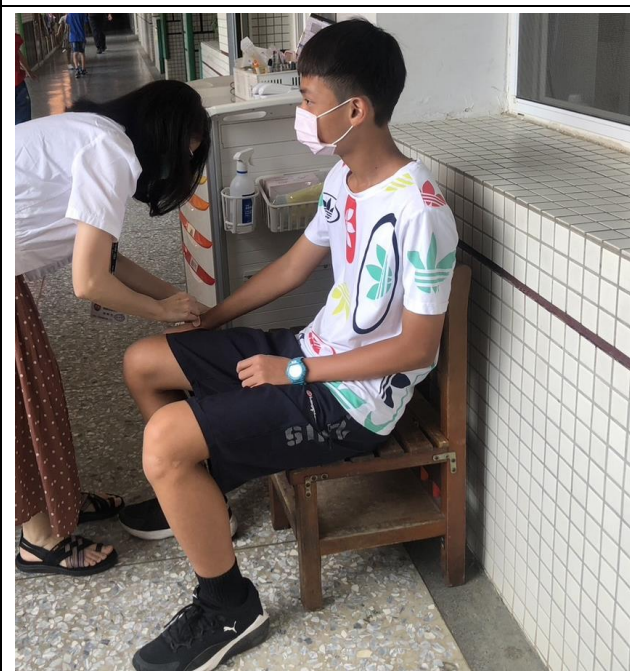
校外學生於校內運動受傷簡易處理 1