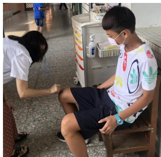
校外學生於校內運動受傷簡易處理 2