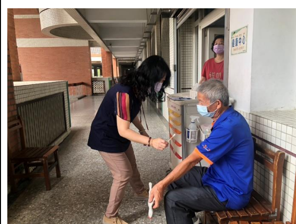
民眾於校內受傷簡易處理 1