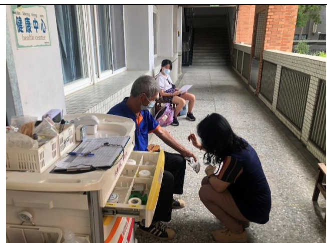
民眾於校內受傷簡易處理 2