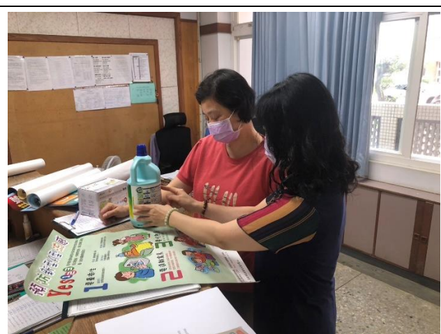
家長諮詢流感疫苗問題