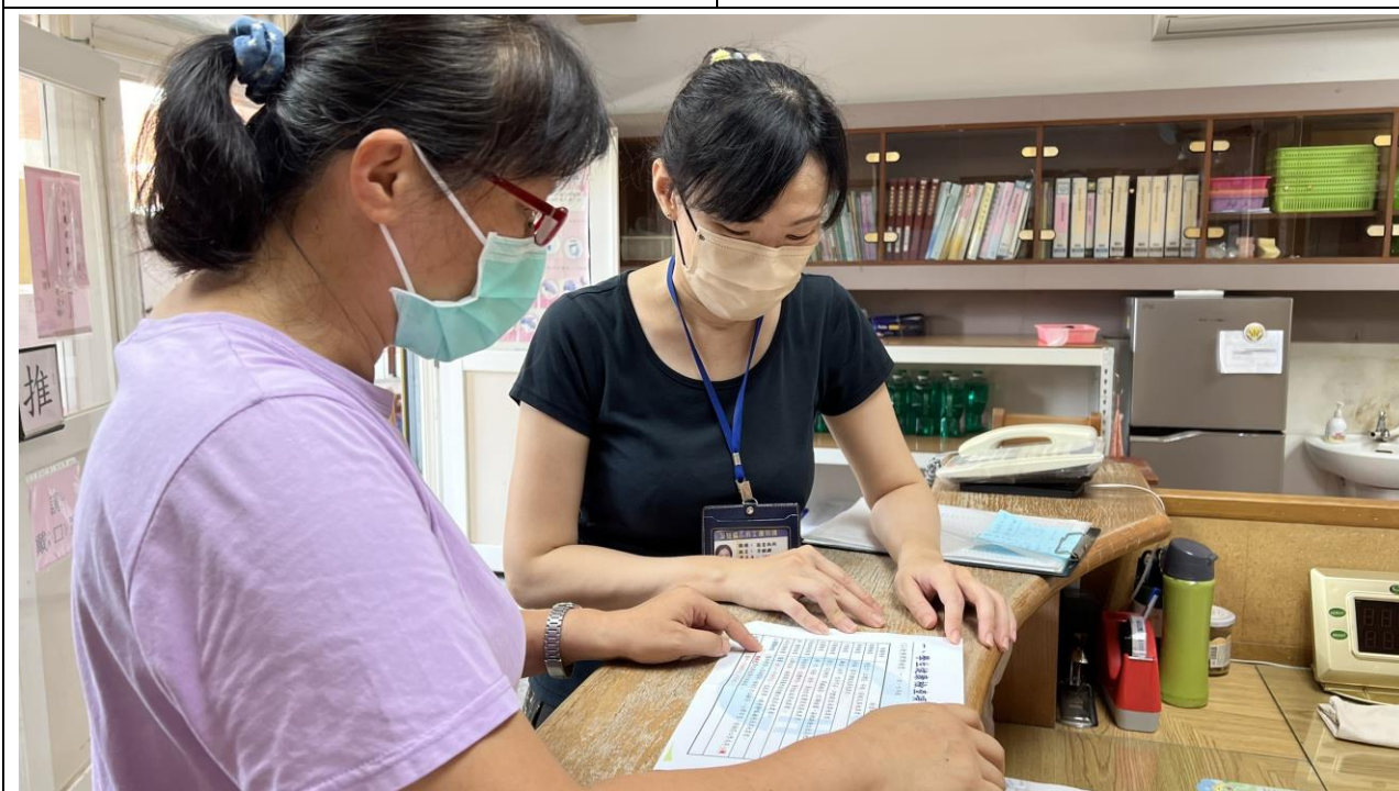
家長諮詢學生健康檢查問題