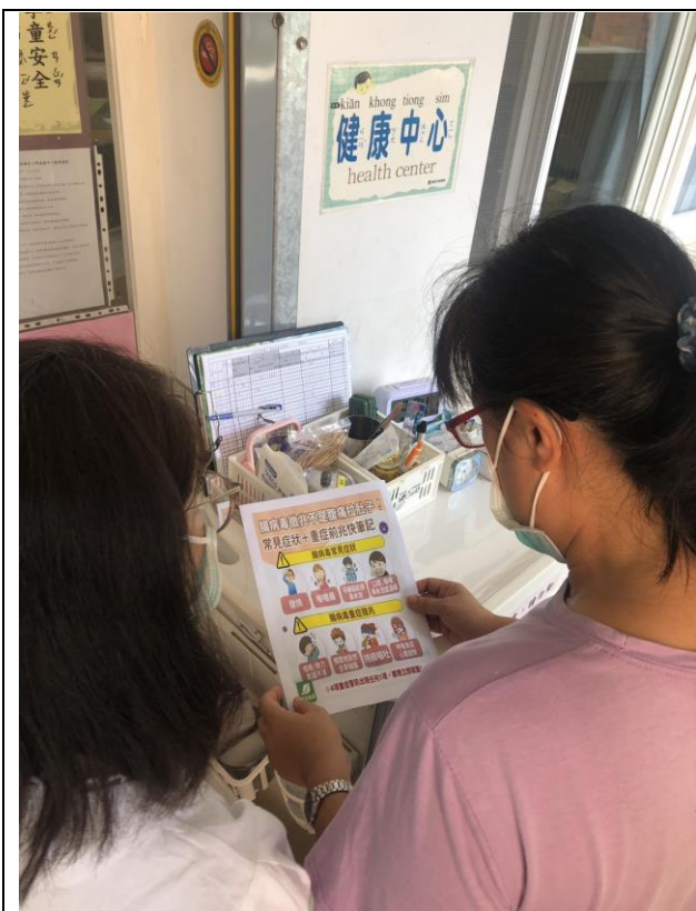
家長諮詢學生腸病毒照護問題