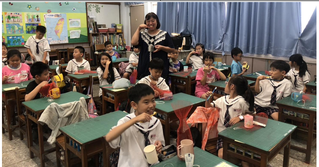
班上實施督導式潔牙(導師親身示範)