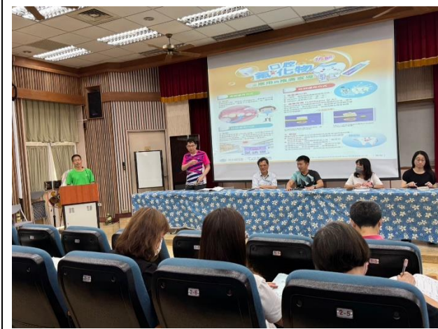
晨會宣導刷牙注意事項 1