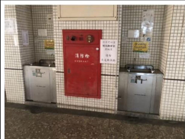
學校廣設飲水機(72 台=見附件)