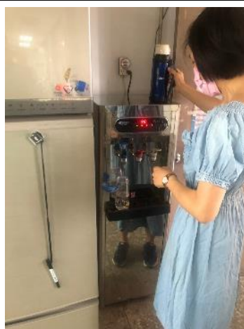
教職員善用飲水機 1