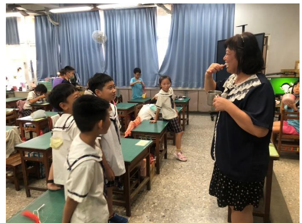
教師刷牙並教導學生