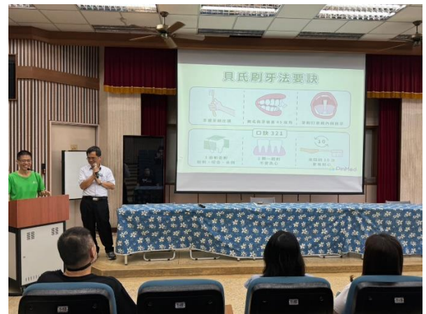
晨會宣導刷牙注意事項 2