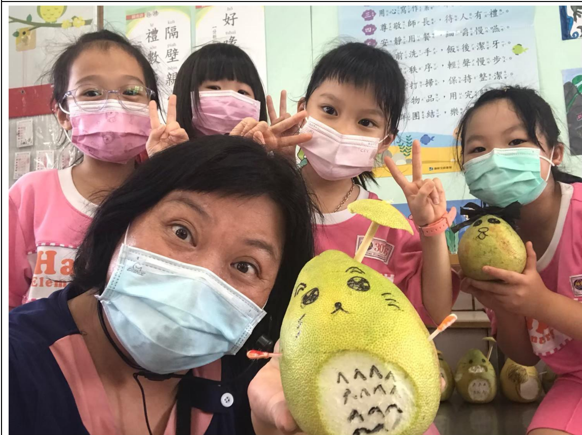
教職員和學生一起享用水果