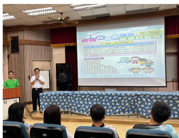
晨會宣導喝白開水照片