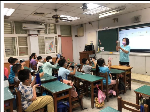
導師引導學生多喝白開水並教導該喝多少