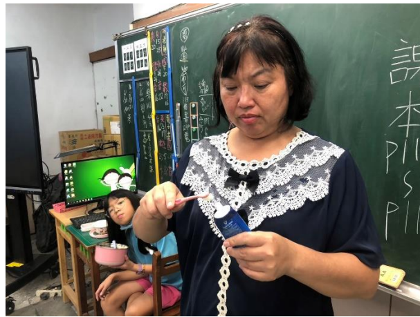
教師使用含氟牙膏刷牙