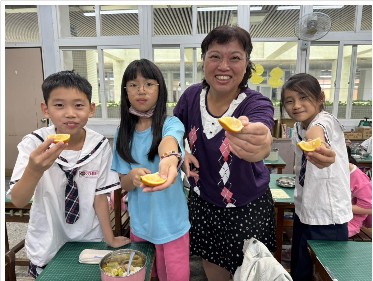
教職員和學生一起享用水果