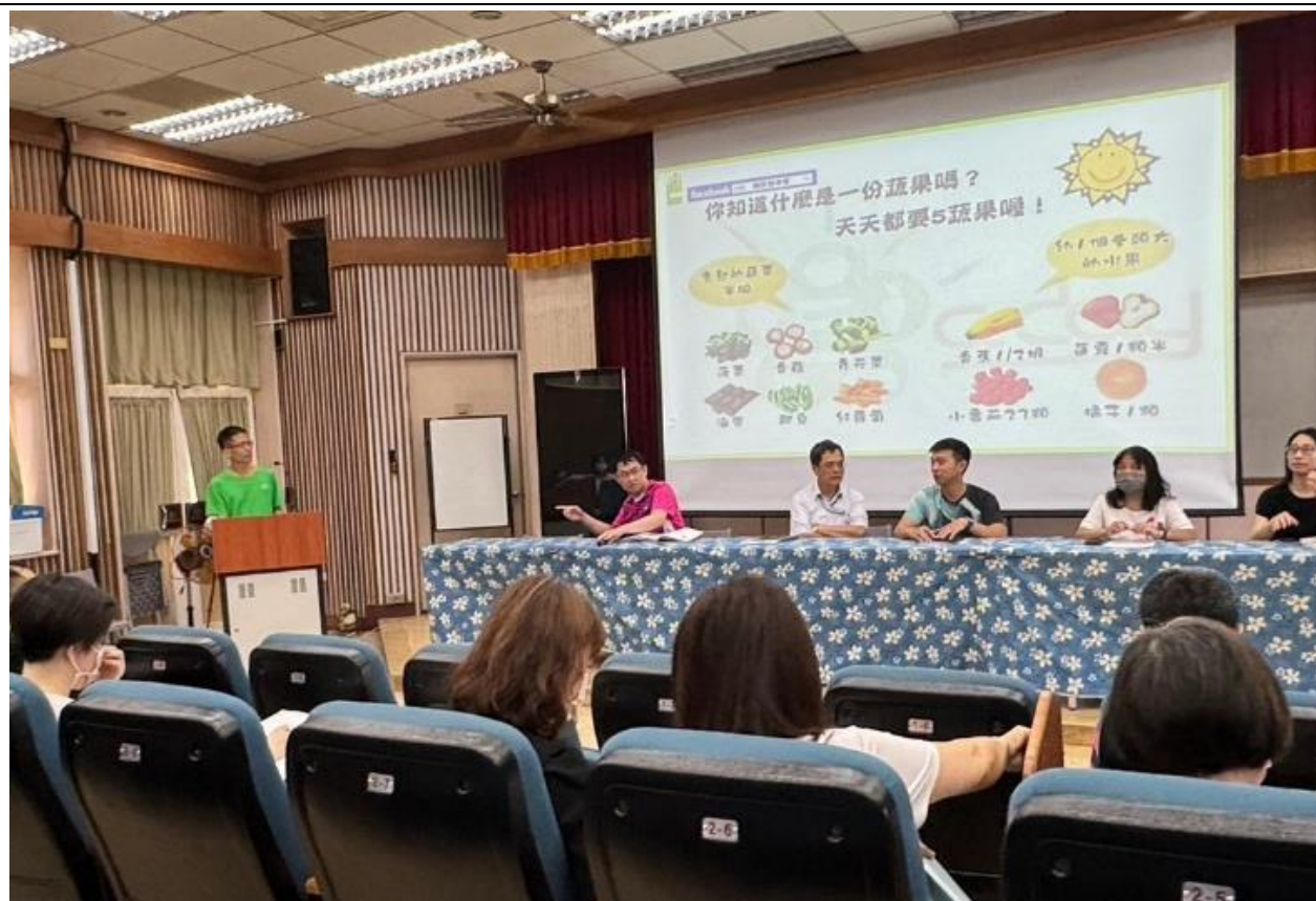
晨會宣導多吃蔬果照片