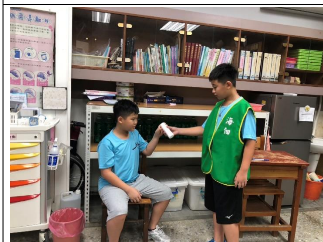
健康中心協助照片～協助冰敷