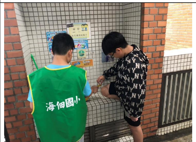
健康中心協助照片～協助清洗傷口