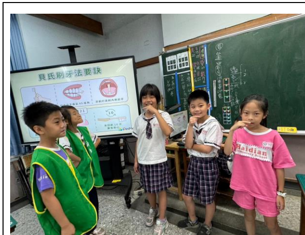
各班宣導照片～貝式刷牙法