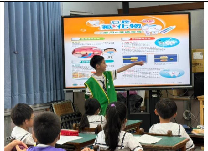
各班宣導照片～口腔氟化物