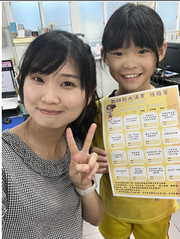
照片說明：校內舉行教師節活動，學生主動找老師自拍，體現師生良好互動。