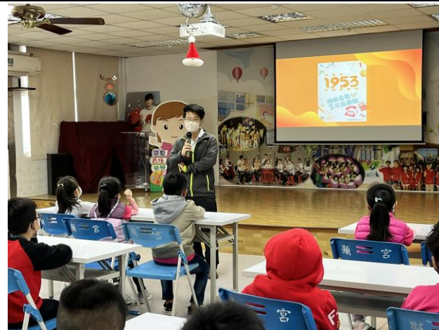
照片說明：校長於友善校園週進行校園霸凌預防宣導，提醒全校學生重視友善人際關係的互動。