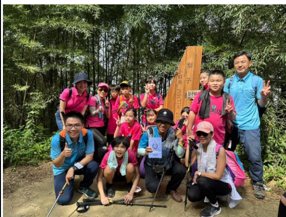
照片說明：師生一同至雲嘉五連峰健行，建立良好師生關係及學生互動。