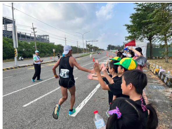
照片說明：全校師生一同在校外幫全國運動會馬拉松選手加油打氣，展現本校師生團結形象。