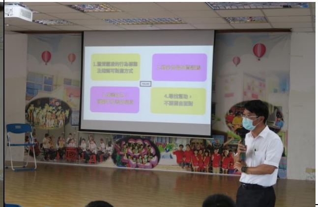
照片說明：校長於友善校園週進行校園霸凌預防宣導，提醒全校學生重視友善人際關係的互動。