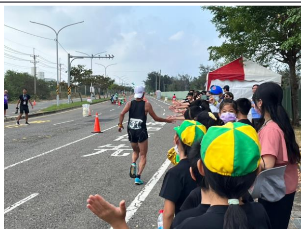
照片說明：全校師生一同在校外幫全國運動會馬拉松選手加油打氣，展現本校師生團結形象。