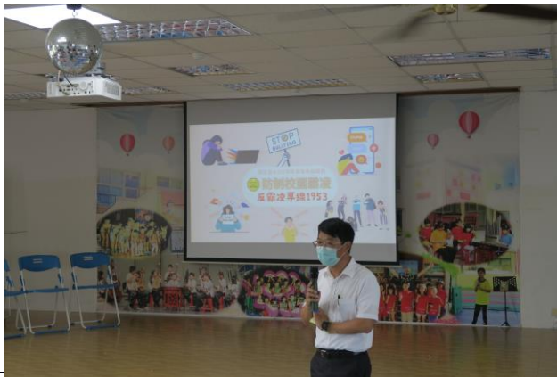
照片說明：校長於友善校園週進行校園霸凌預防宣導，提醒全校學生重視友善人際關係的互動。