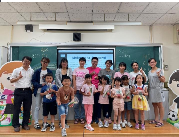
照片說明：定期舉辦小一新生迎新，創造友善氛圍，讓學生開心上學。