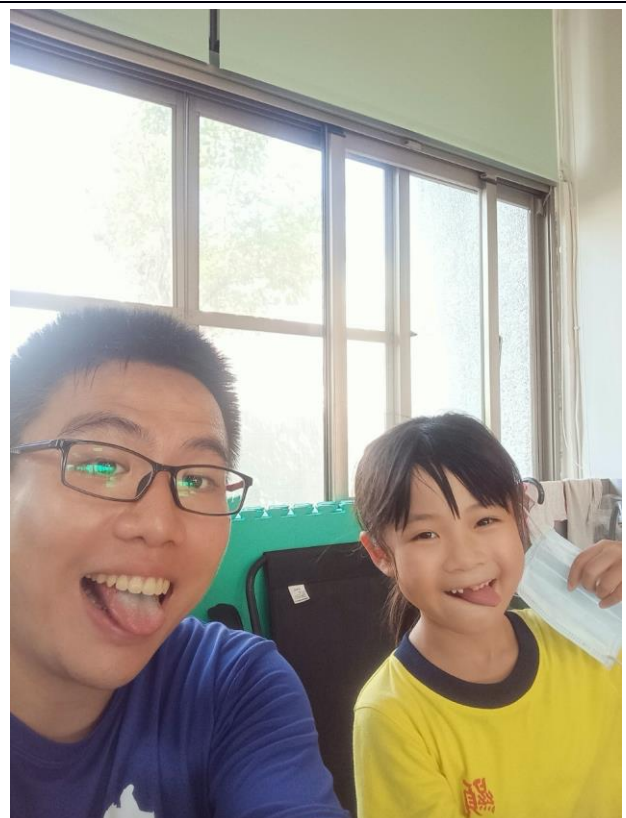
照片說明：校內舉行教師節活動，學生主動找老師自拍，體現師生良好互動。