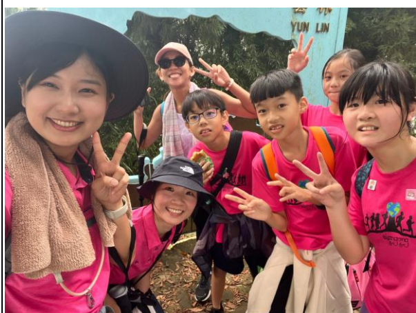
照片說明：師生一同至雲嘉五連峰健行，建立良好師生關係及學生互動。

5-1-1 學校運用社會情緒學習，加強人際互動的能力、幫助師生建立的良好人際關係並建立自尊和自信。