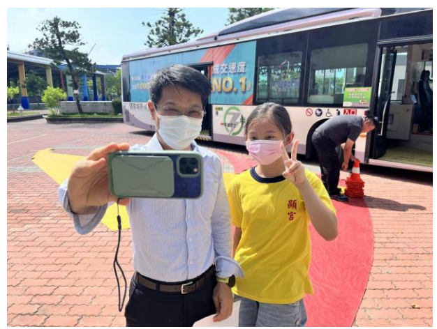
照片說明：校內舉行教師節活動，學生主動找校長自拍，體現師生良好互動。