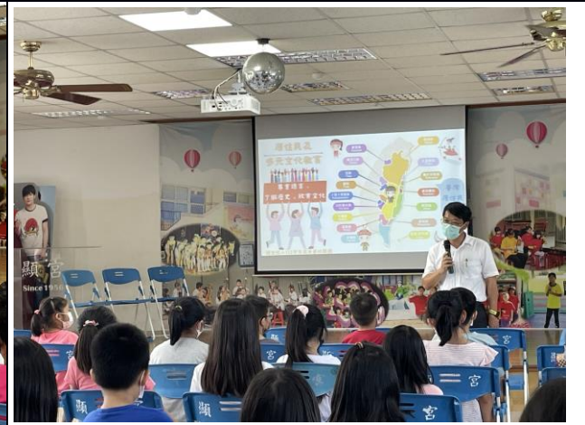
照片說明：校長於友善校園週進行多元文化及弱勢族群的介紹，並提醒學生應了解、認同並同理。