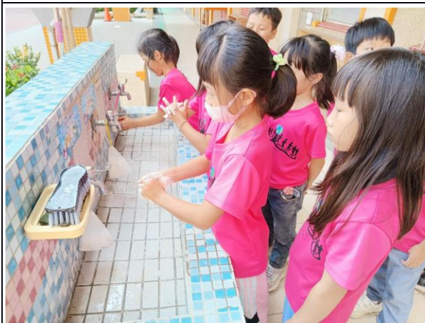
說明：老師提醒學生洗手五時機。