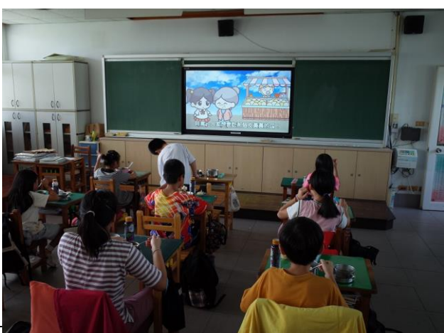
說明：高年級進行餐前五分鐘教育。