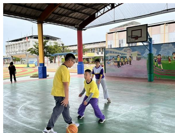
說明：落實下課教室靜空，課間活動到操場運動。