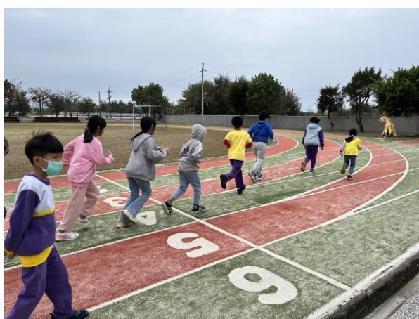
說明：落實下課教室靜空，課間活動到操場運動，讓眼睛休息。