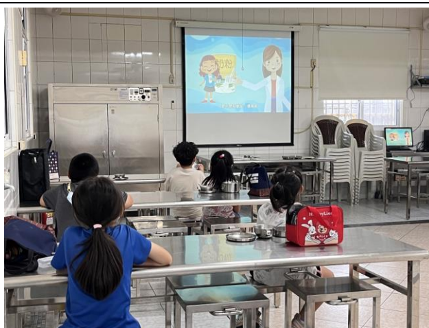
說明：低年級進行餐前五分鐘教育。