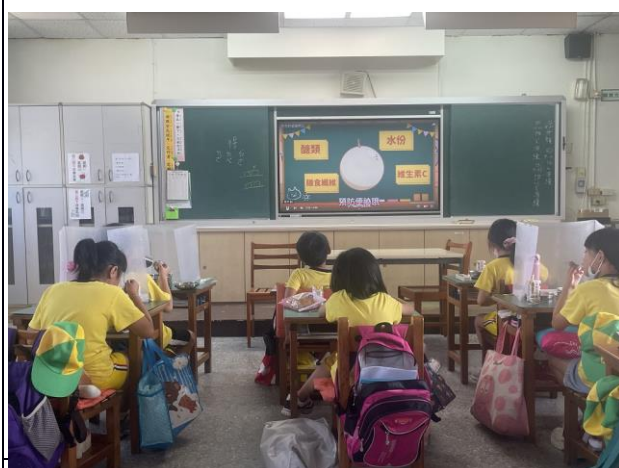
說明：中年級進行餐前五分鐘教育。