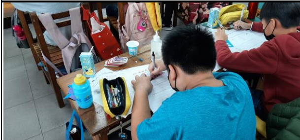
說明：學生填寫男女大不同學習單，加深印象。