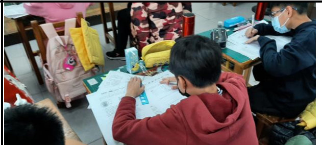
說明：學生填寫男女大不同學習單，加深印象。