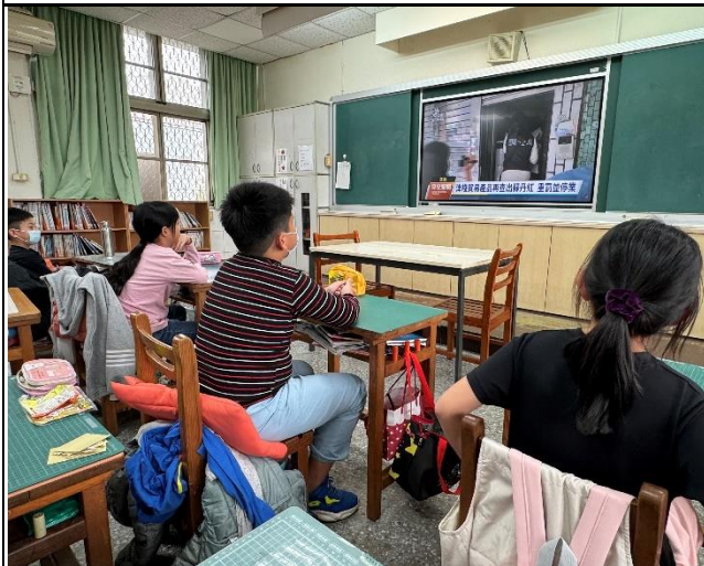
說明：學生觀看蘇丹紅事件新聞播報影像