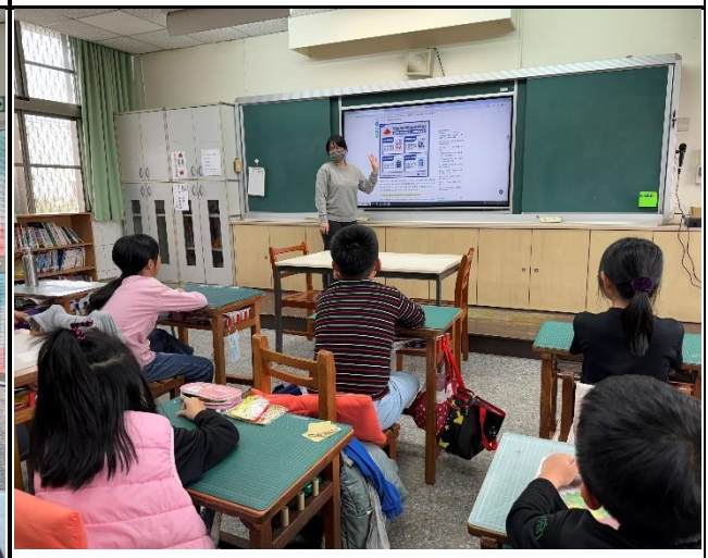
說明：師生討論食安問題對自身的影響