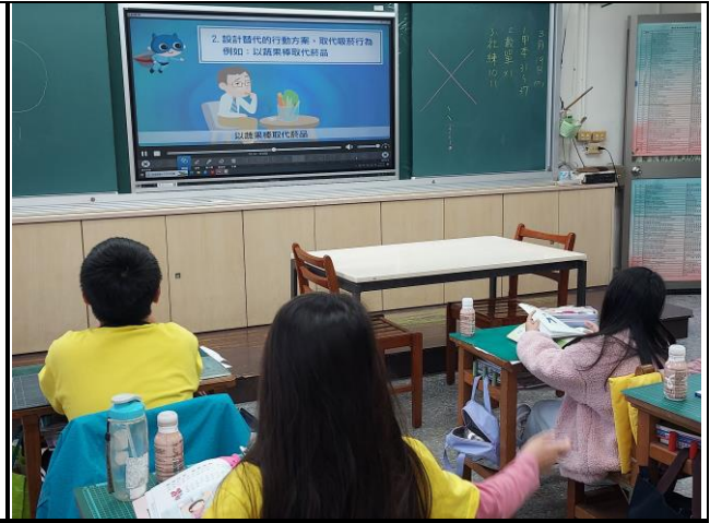
說明：醫師會依照家人的狀況給予戒菸行動方案。