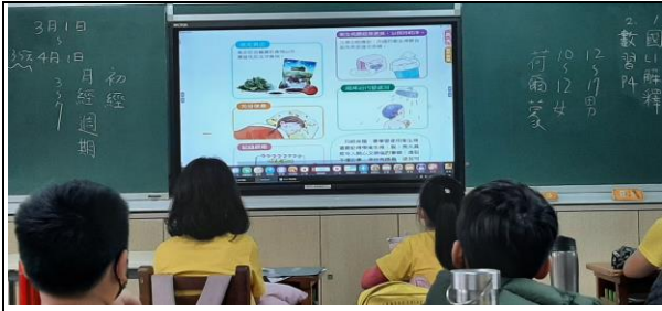
說明：老師說明男女都有賀爾蒙的產生。