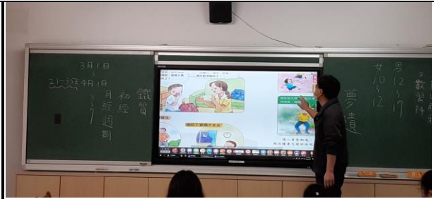
說明：老師說明男性的夢遺狀況。