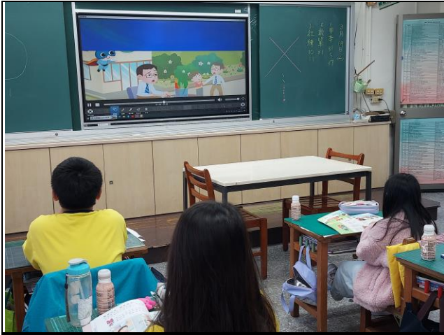
說明：首先可以帶家人至醫院的戒菸門診。