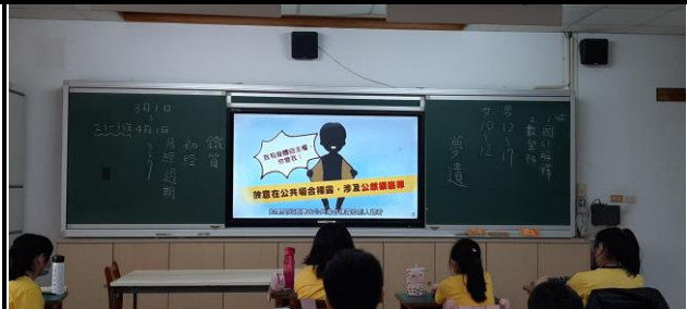
說明：老師解釋應尊重他人身體自主權，不應露出自己的隱私部位，也不應嘲笑他人。