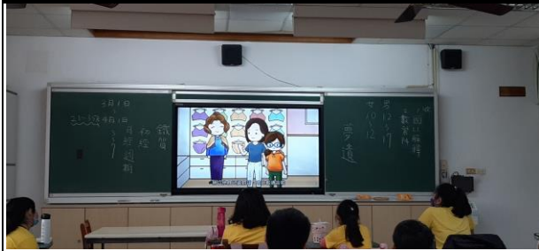
說明：老師播放女性出現第二性徵後，會面臨到穿內衣應如何挑選的情境。