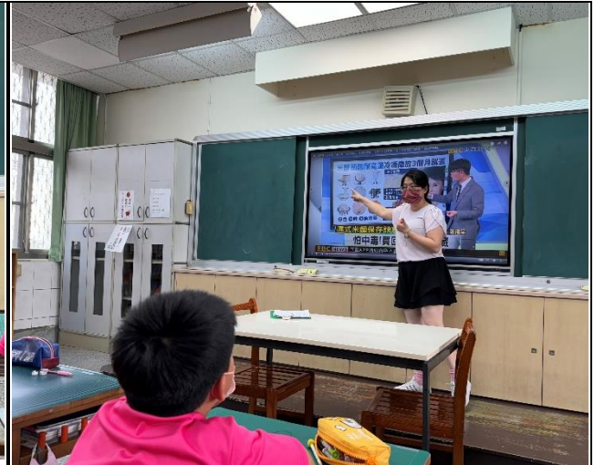
說明：教師說明米酸酵菌