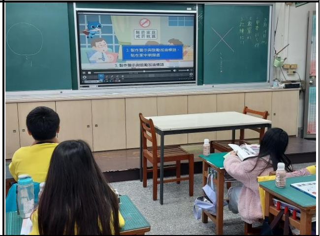
說明：老師請學生回家向家人說明吸菸的危害，並請學生與家人一起商討戒菸方案。