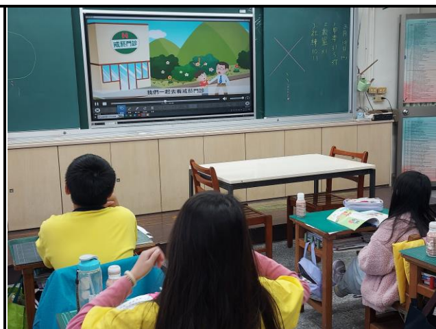
說明：以動畫展示戒菸如何進行。