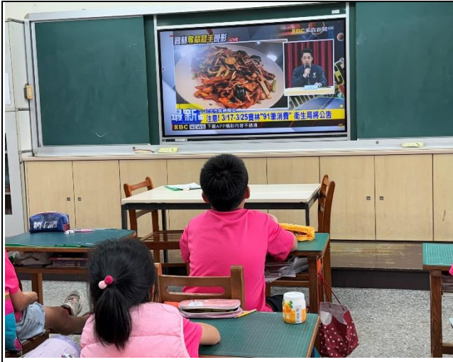
說明：學生觀看寶林事件新聞播報影像