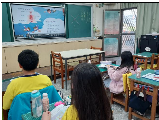
說明：老師向學生介紹抽菸引發的各種癌症及身體危害。