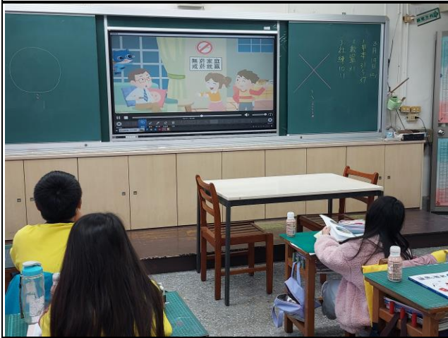
說明：戒菸行動需要全家人一起協助合作。