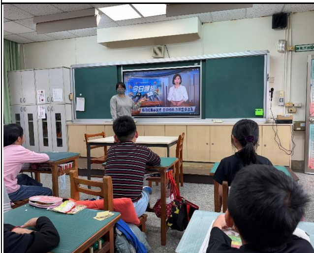
說明：教師說明蘇丹紅事件由來及嚴重性