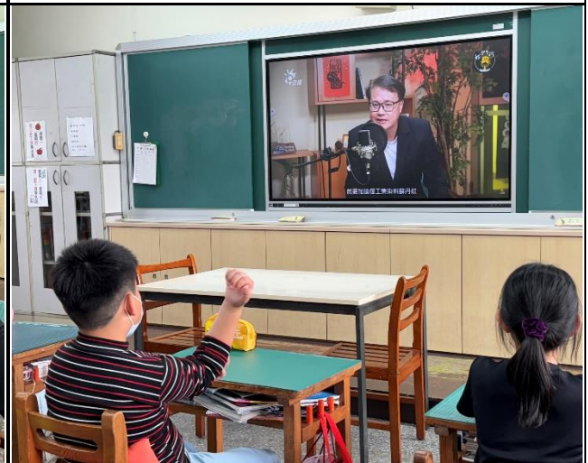
說明：學生觀看專家學者解釋蘇丹紅危險性