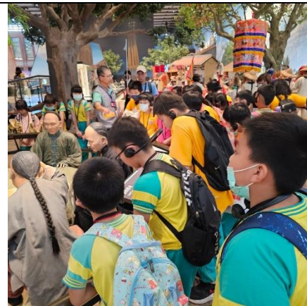
國立臺灣歷史博物館