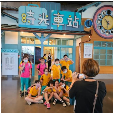
國立臺灣歷史博物館