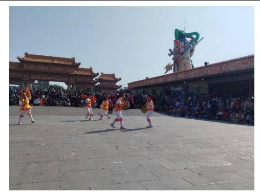
2024 聖母廟迓春牛活動遊行，青草國小跳鼓陣表演