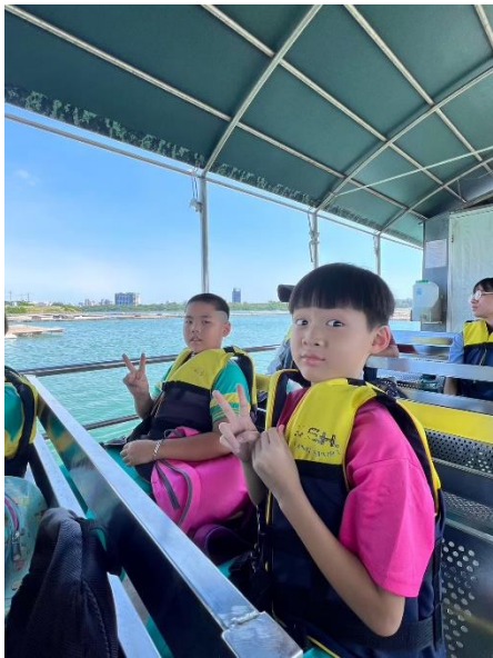
四草隧道生態體驗