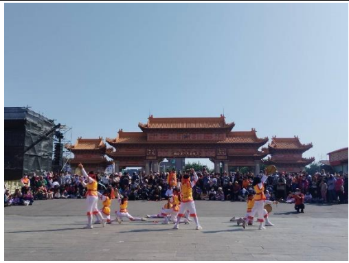
2024 聖母廟迓春牛活動遊行，青草國小跳鼓陣表演