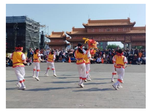
2024 聖母廟迓春牛活動遊行，青草國小跳鼓陣表演