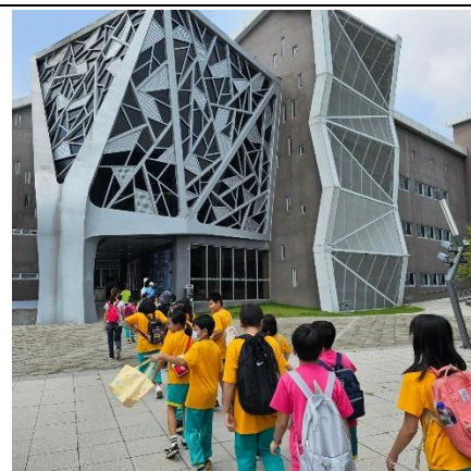
國立臺灣歷史博物館