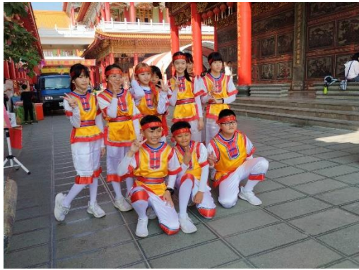
2024 聖母廟迓春牛活動遊行，青草國小跳鼓陣表演