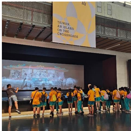
國立臺灣歷史博物館