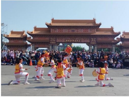
2024 聖母廟迓春牛活動遊行，青草國小跳鼓陣表演