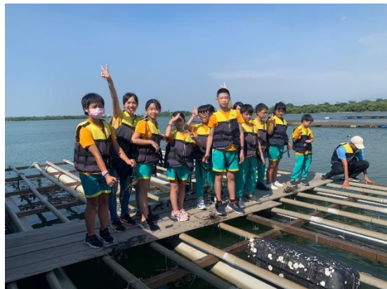
四草隧道生態體驗