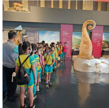
國立臺灣歷史博物館