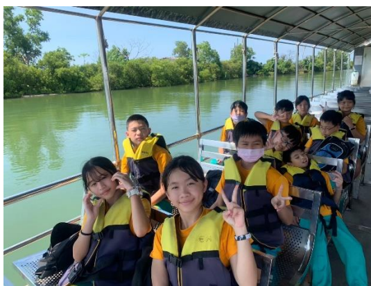
四草隧道生態體驗