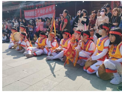
2024 聖母廟迓春牛活動遊行，青草國小跳鼓陣表演