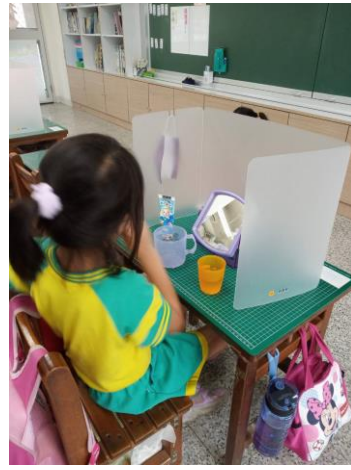
說明：學生養成中午潔牙習慣