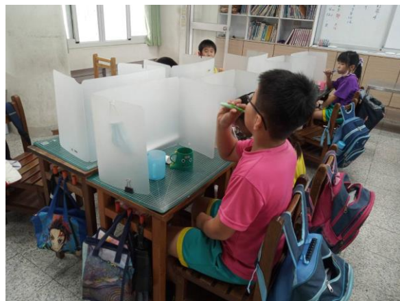
說明：學生養成中午潔牙習慣 倡議全家睡前 潔牙