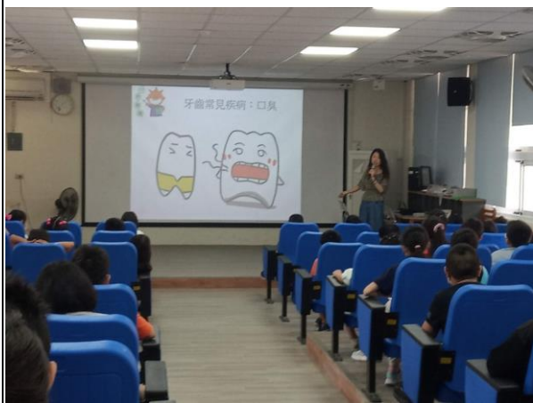
說明：牙齒常見疾病