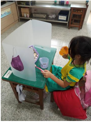
說明：學生養成中午潔牙習慣