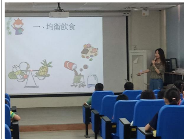
說明：擁有健康好牙的方法