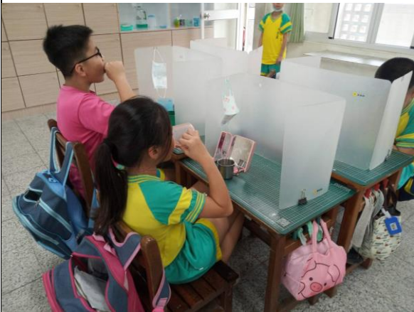
說明：學生養成中午潔牙習慣 倡議全家睡前 潔牙