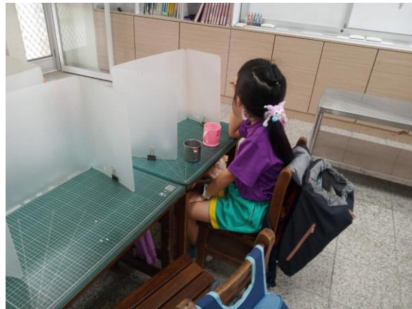
說明：學生養成中午潔牙習慣