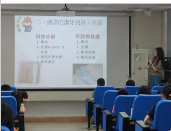
說明：牙齒常見疾病