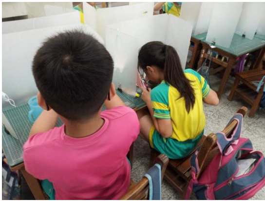
說明：學生養成中午潔牙習慣