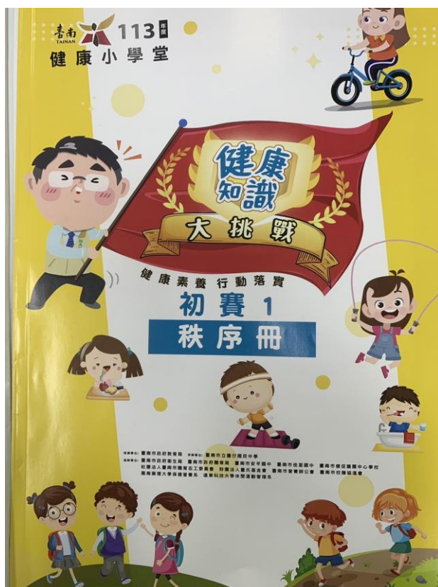
◆113 年健康知識大挑戰秩序冊