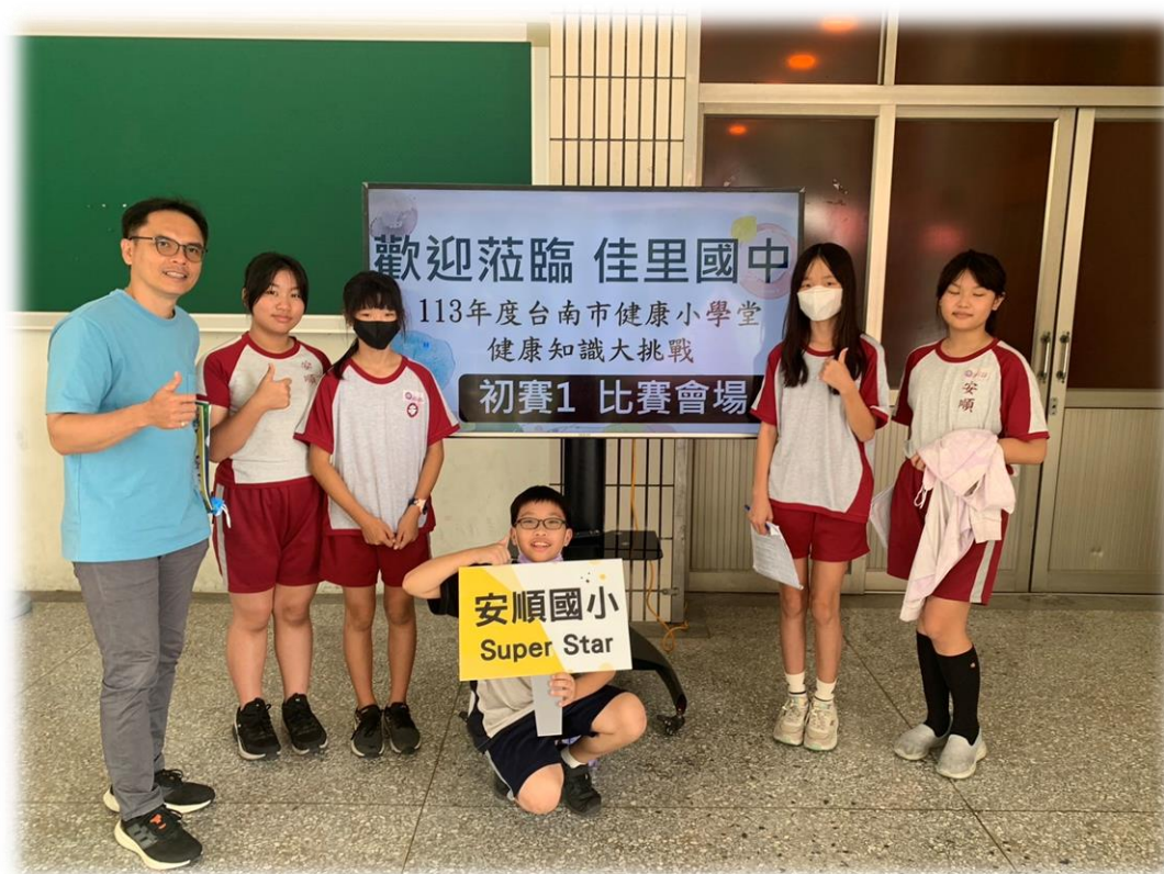
◆學生參與健康小學堂-健康知識大挑戰