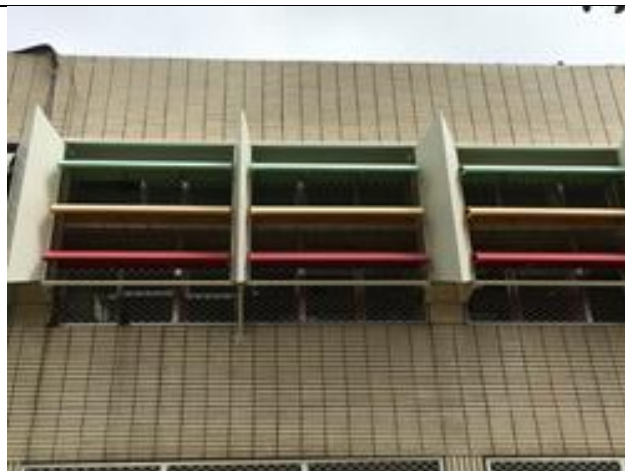
可調整式遮陽板改善南棟日照問題