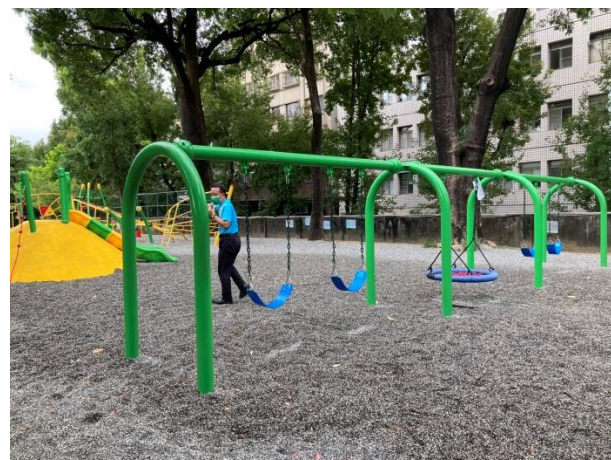
遊戲器材區定期檢驗並實施安全教育