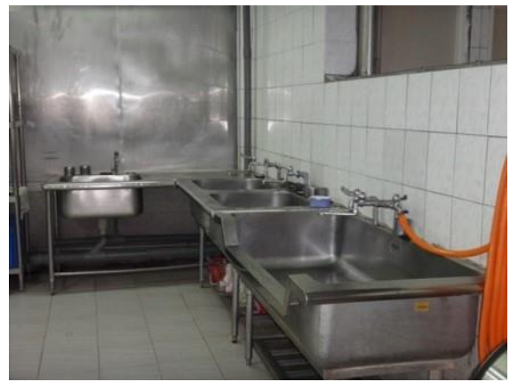
第一區海鮮雞鴨豬處理區