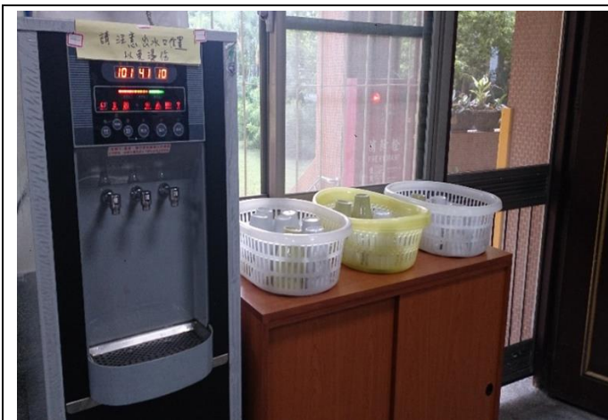
辦公室、各班教室皆提供飲水機