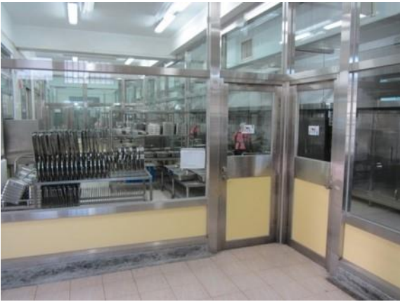
各區安全玻璃隔間