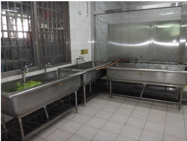
第二區蔬菜處理區