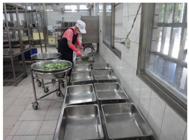
配膳區進行分班配膳