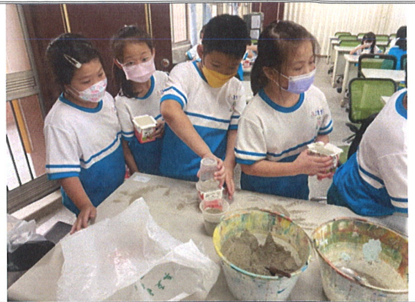
主題說明：回收紙盒製作水泥花器