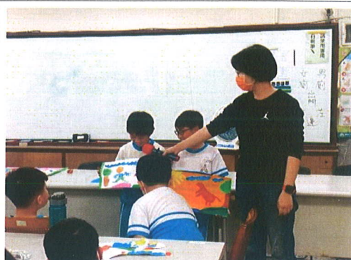
主題說明：跟大家介紹我的作品