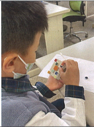
主題說明：馬賽克瓷磚彩繪裝飾花器