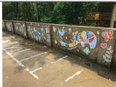
主題說明：蝴蝶生態融入彩繪主題