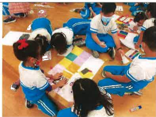
主題說明：以馬蒂斯風格為創作技法