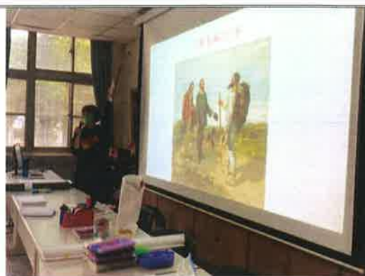
主題說明：藝術融入表演創作課程