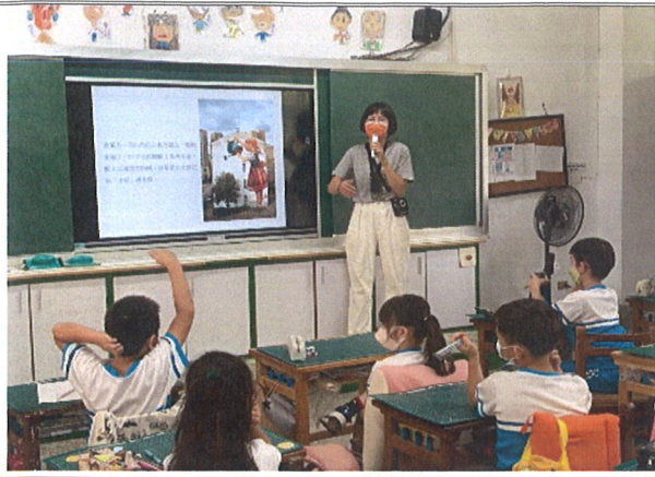
主題說明：公共藝術課程介紹