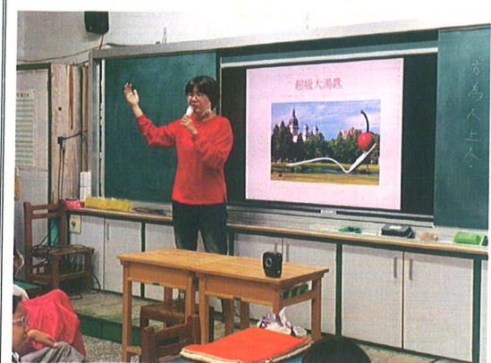
主題說明：藝術家介紹公共藝術的概念