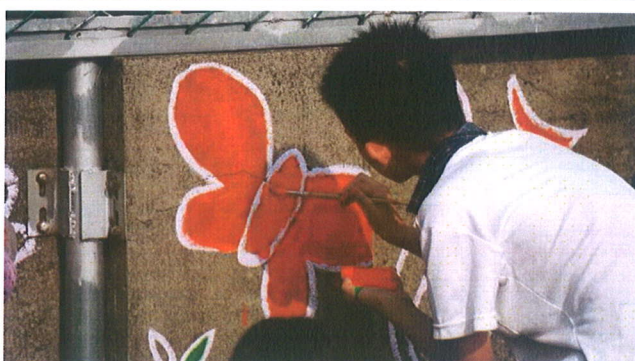
主題說明：以鮮明的顏色開始塗色了