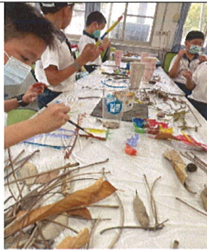
主題說明：將校園內乾枝枯葉上色拼黏