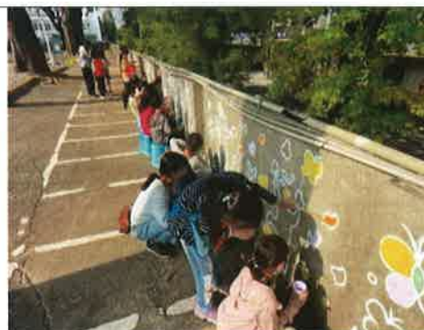
主題說明：老舊牆面實地彩繪