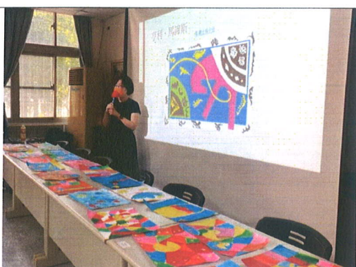
主題說明：作品展，讓學生看看優秀作品