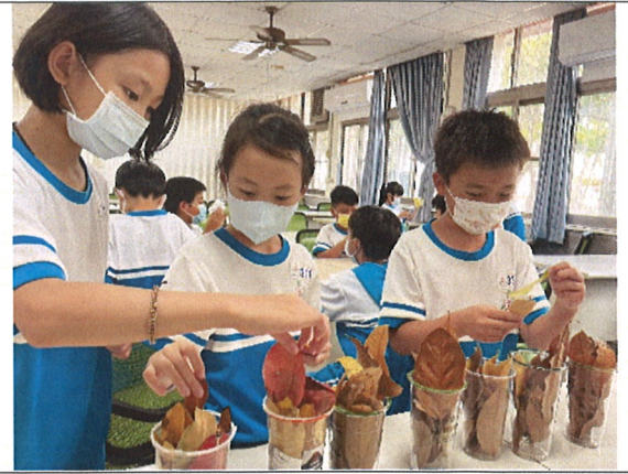
主題說明：撿拾校園內乾枝枯葉