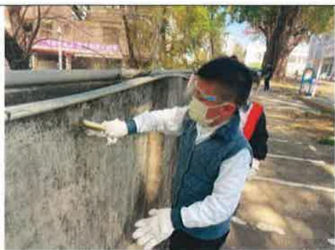
主題說明：老舊牆面髒汙清潔及刷除