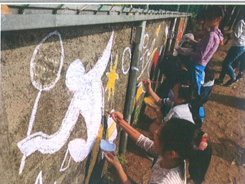
主題說明：看我的塗得美嗎？