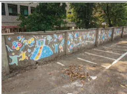
主題說明：以校內遊具為創作主題