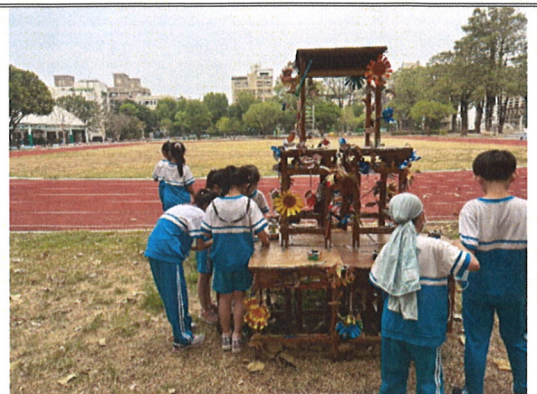
主題說明：組裝「老樹重生、裝置藝樹」