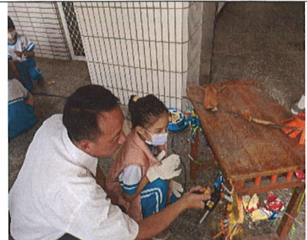
主題說明：校長協助裝置拼黏