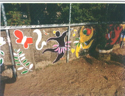
主題說明：舞蹈班意象的作品