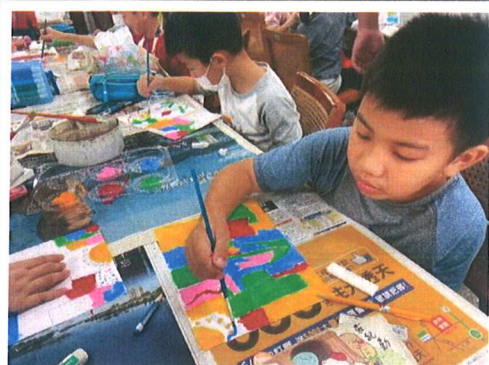
主題說明：開始創作囉！