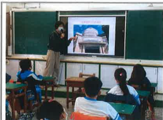
主題說明：公共藝術理論課程