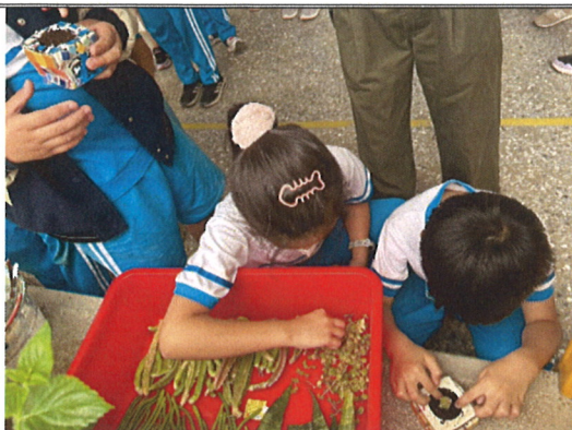
主題說明：將校內多肉植物移植花器