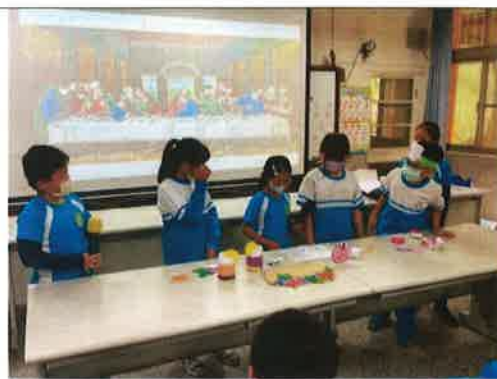
主題說明：小組成果發表-名畫仿作仿演