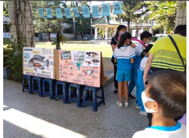
運動會進行營養教育宣導活動