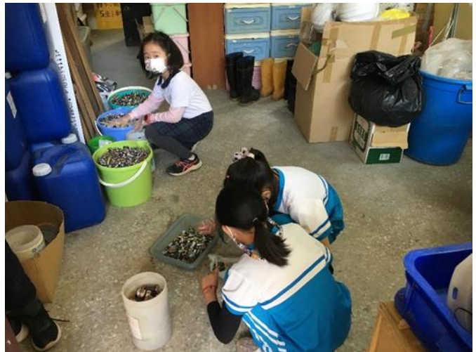
環保教育~資源回收、廢電磁回收