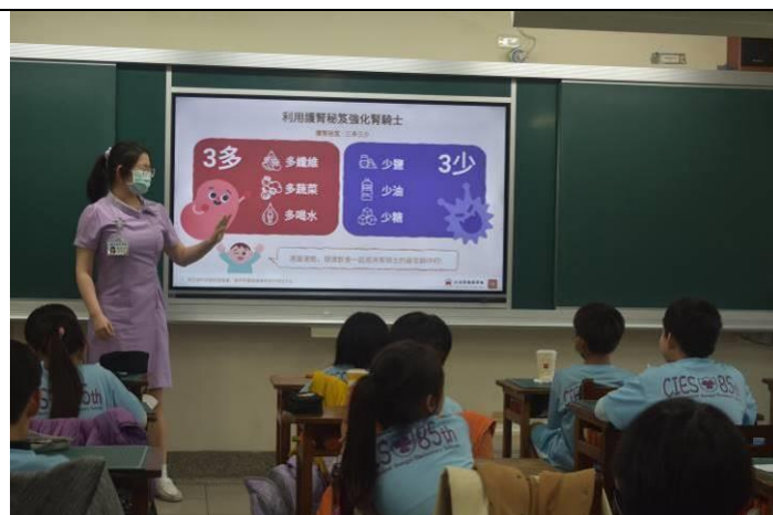
說明：多纖維、多蔬菜、多喝水，少油、少鹽、少糖是護腎不二法門。