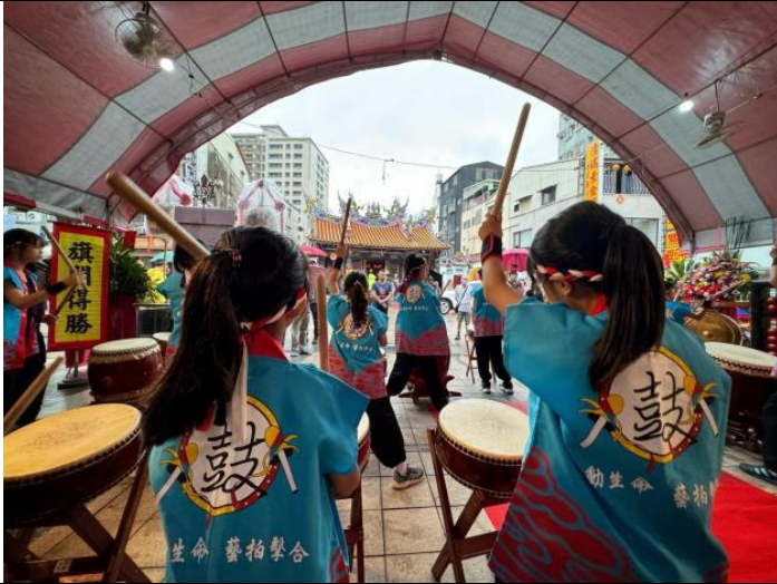
說明：為考生擊鼓，祝福他們金榜題名