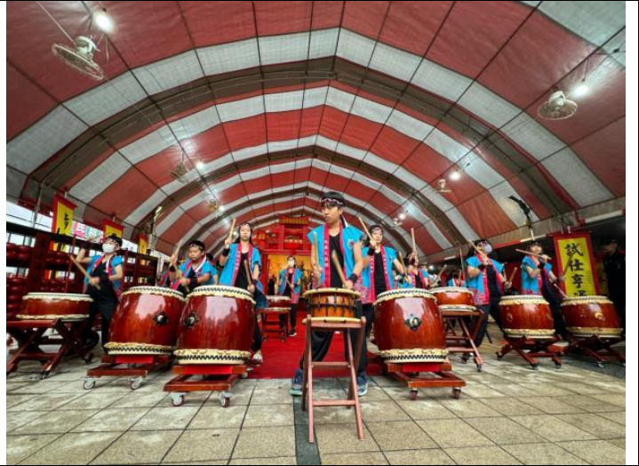
說明：配合廟方響鑼活動，祈願考生考試順利，一鳴驚人。