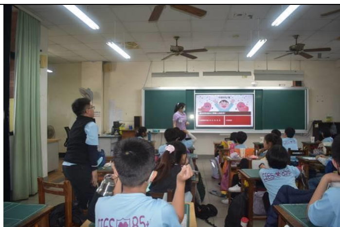
說明：有獎徵答時間