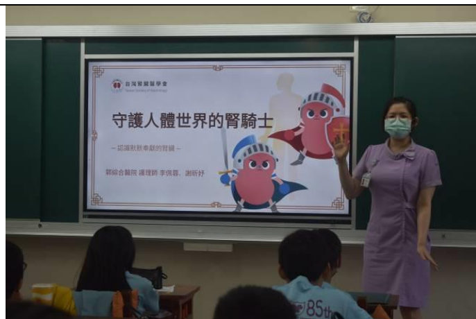
說明：由護理師宣講認識腎臟