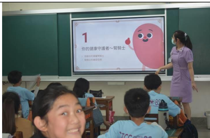
說明：健康守護者~腎