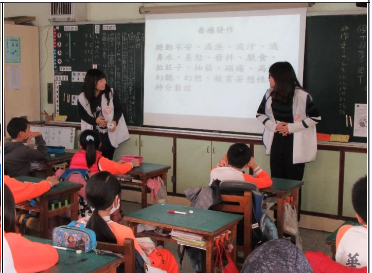
說明：藥學系學生向五年級小朋友介紹常見藥物