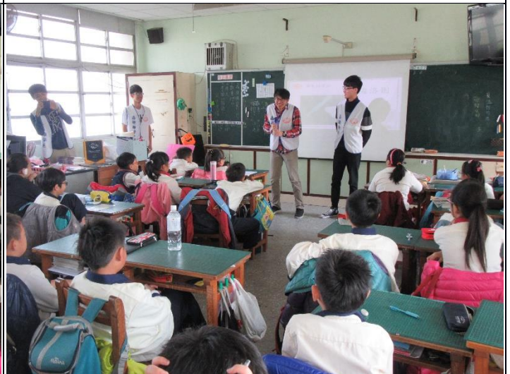
說明：與五年級學生討論該怎麼拒絕誘惑