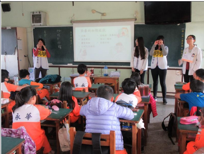
說明：藥學系學生向五年級小朋友介紹常見藥物