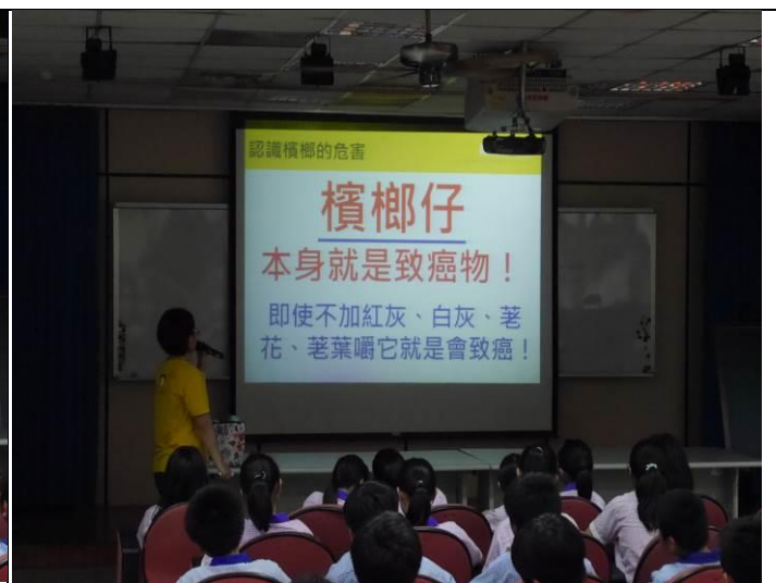
說明：說明檳榔仔本身致癌物釐清觀念