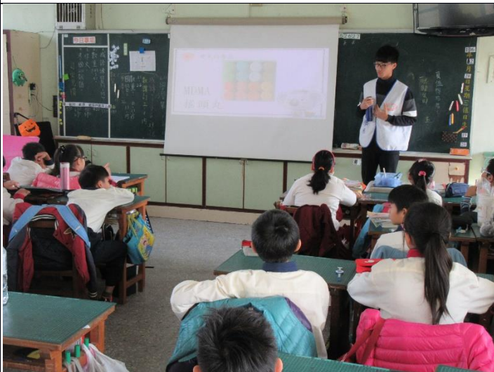
說明：向五年級學生展示違反藥物常被包裝成糖果軟糖等型態