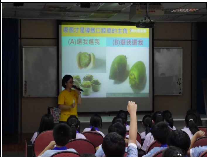
說明：專員介紹市售檳榔的種類