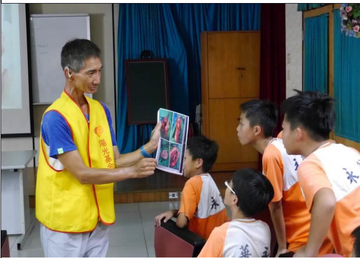
說明：陽光基金會志工（口腔癌患者）現身說法，讓學生認識長期實用檳榔有很高機率得到口腔癌。