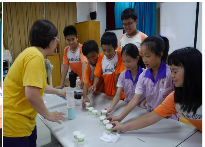
說明：讓學生親自引用口腔癌患者所食用的流質食物。