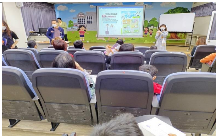
班親會視力保健宣導講座