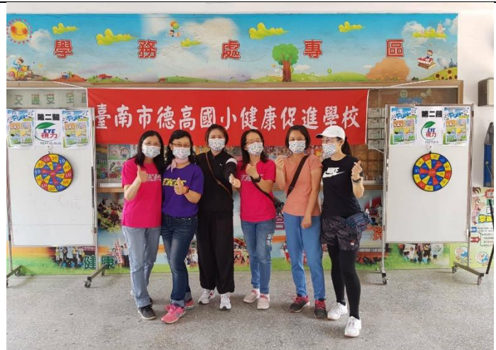
聯絡簿提供社區家長或民眾相關健康資訊或服務