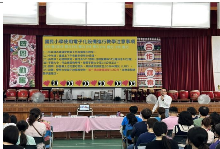
新生始業式的視力保健宣導