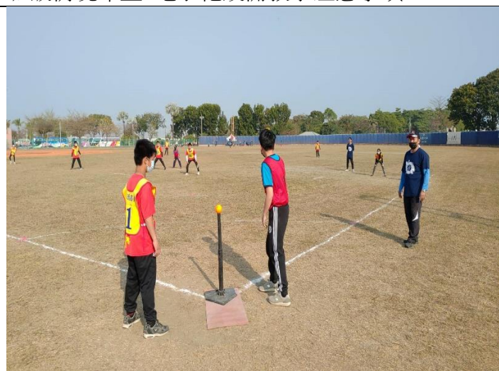
提供多種體育器材鼓勵戶外活動-樂樂棒球