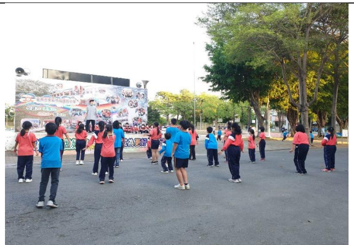
安排戶外課後社團~街舞社