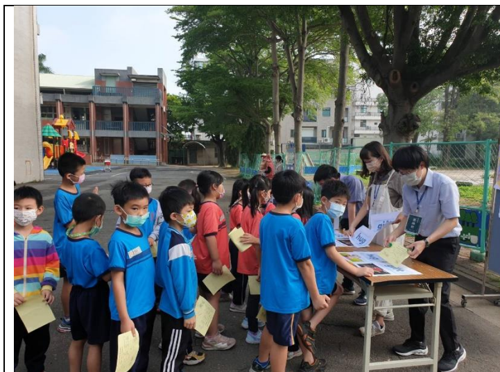
戶外 120~全校一起闖關歡