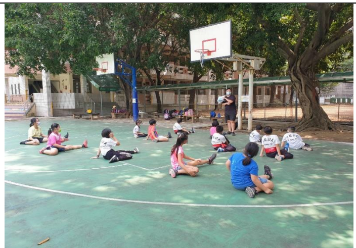
安排戶外課後社團~中國功夫社