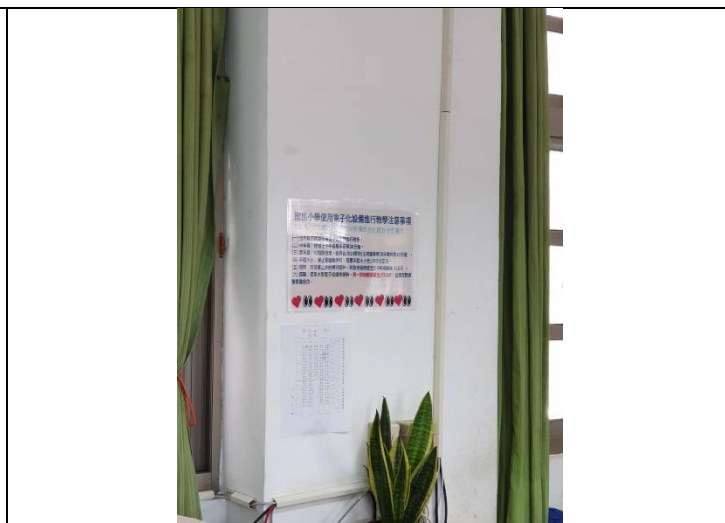
班級情境布置~電子化設備教學注意事項