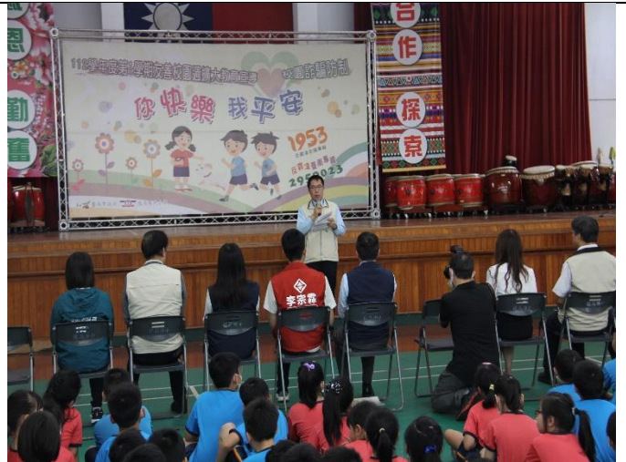
市長叮嚀反霸凌，建立友善校園