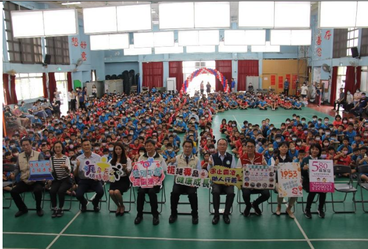
局長提醒反毒、反霸凌、反菸害，建立友善校園