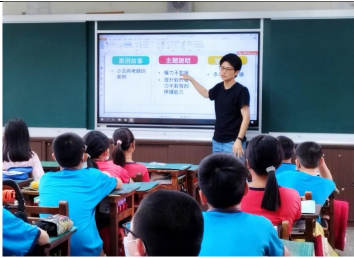
班級宣導反性霸凌，建立和諧兩性關係