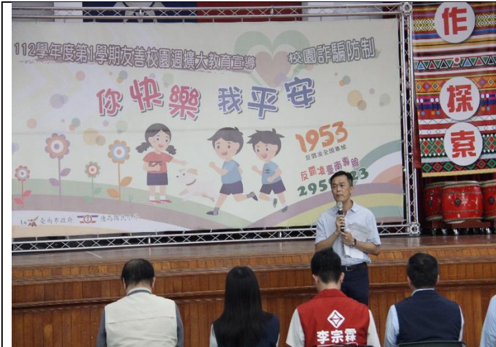
校長叮嚀反霸凌，建立友善校園