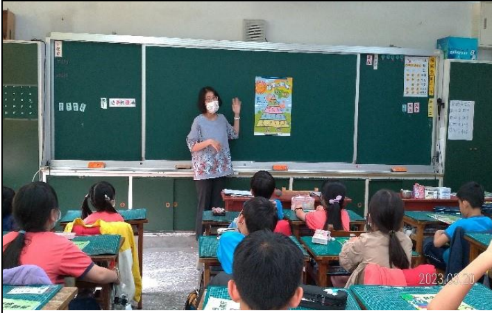
教師進行均衡飲食金字塔教學，建立健康飲食知識