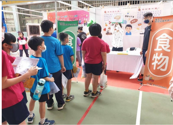
學校透過最新消息，提供健康知識訊息