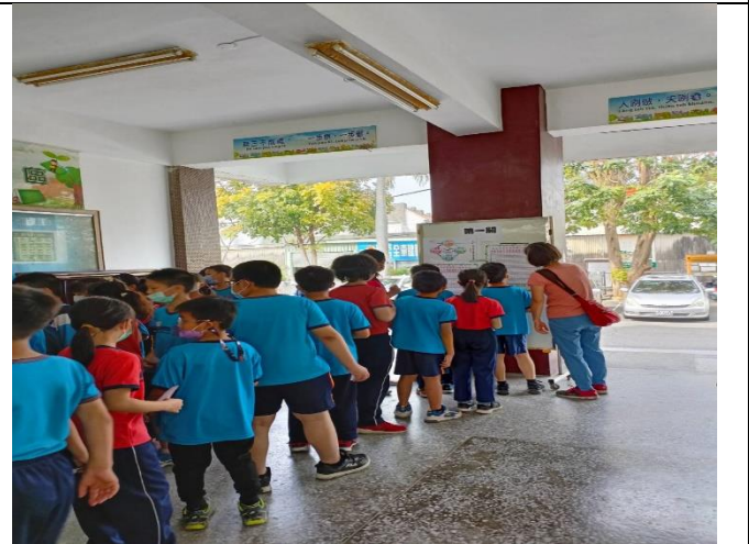
視力保健闖關，建立生活正確用眼決定