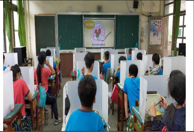
餐前 5 分鐘，一邊午餐同時建立增加纖維攝取觀念