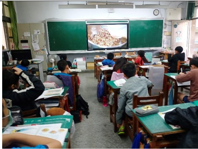
學生觀賞影片認識糙米家族