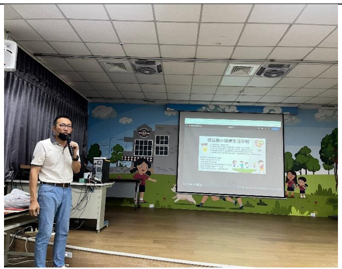
推動學童生活公約