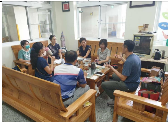
健促小組規劃健康促進教學與宣導活動