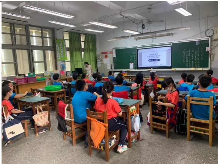
性教育入班宣導-兩性關係影片學習