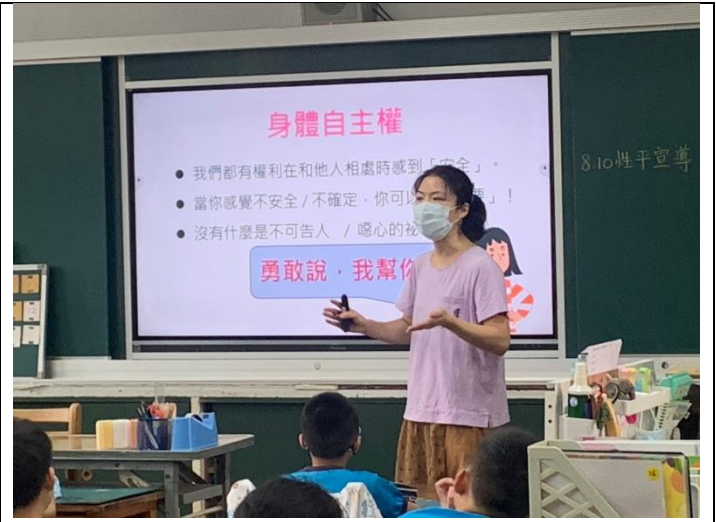
性教育入班宣導—主題身體自主權