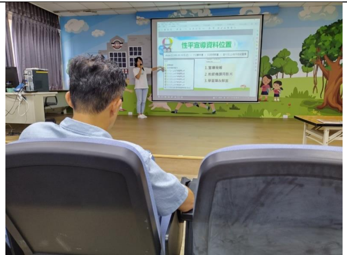
教師會議性教育計畫說明