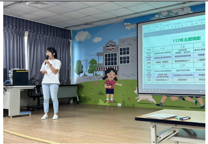
規劃性教育入班宣導主題課程表