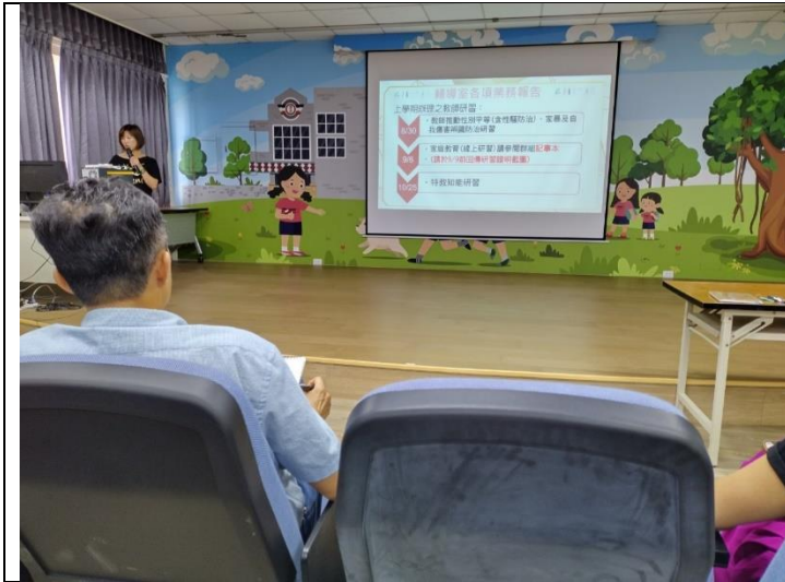
性教育計畫說明-通知上傳成果方式與規定