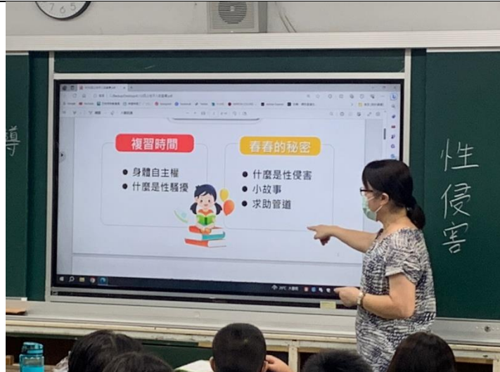
性教育入班宣導—主題性侵害