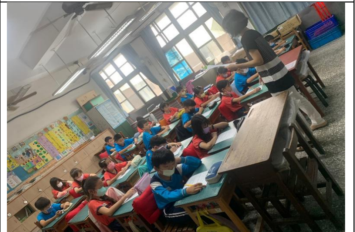
性教育入班宣導—完成學習單