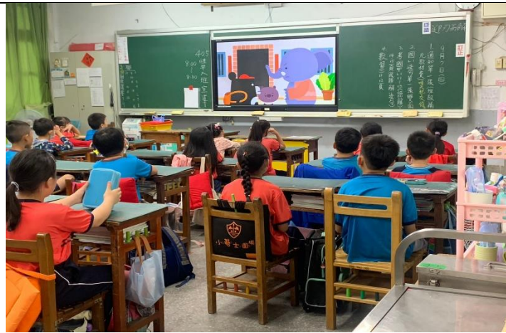
性教育入班宣導—建立和諧兩性關係