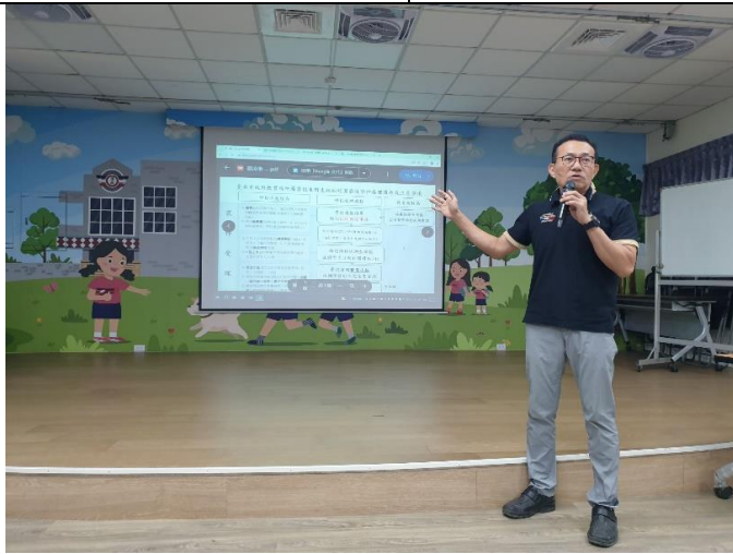
教師會議反性霸凌宣導，建立友善校園