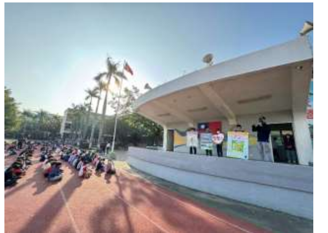
升旗活動宣導友善校園