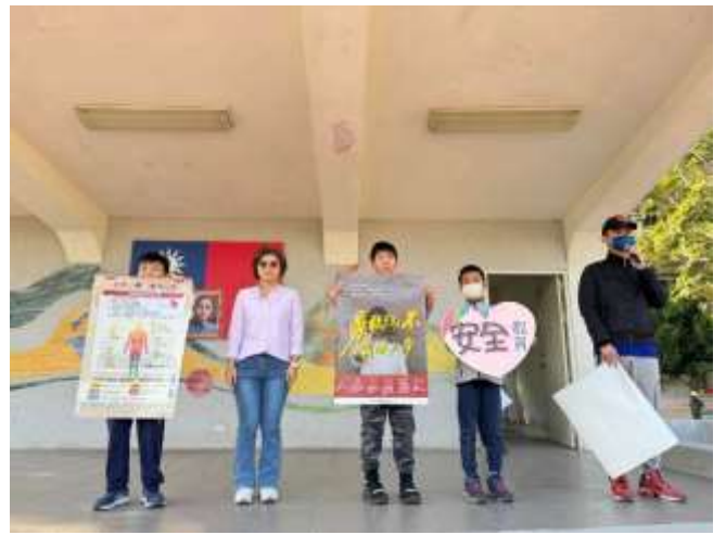
升旗活動宣導友善校園