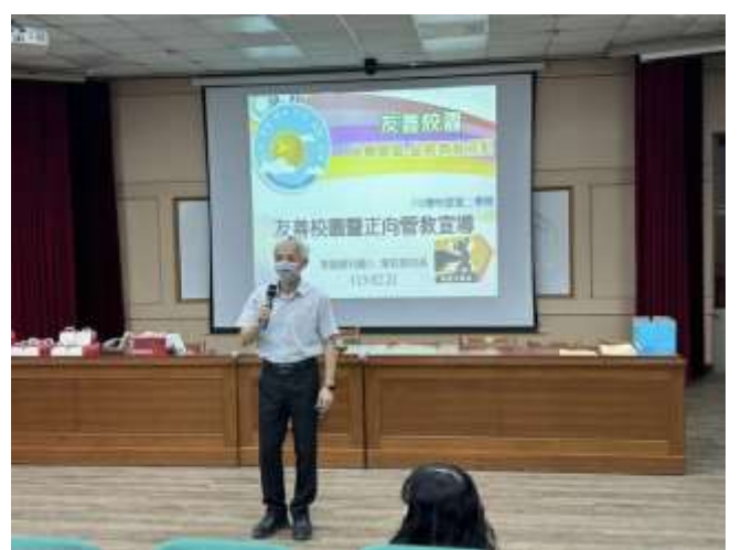
校長午會宣導友善校園