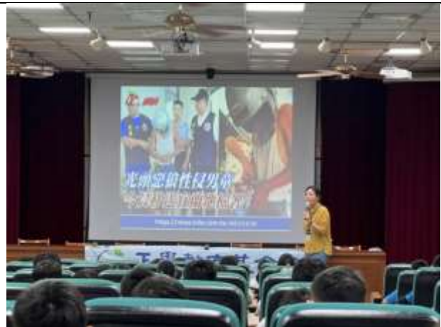
說明：用社會真實事件告知學生如何保護自己