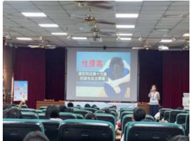
說明：說明性侵害的違法性。