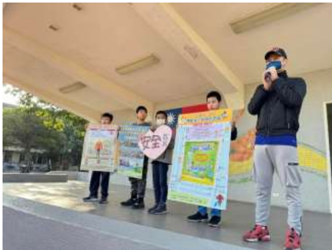
升旗活動宣導友善校園