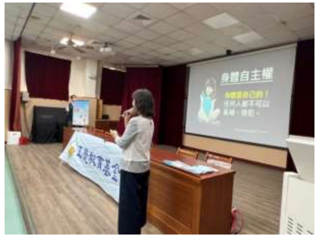
說明：正覺教育基金會蒞校宣導性平教育。