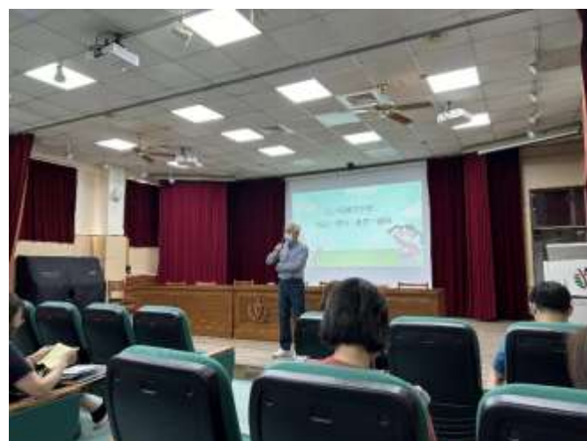
校長午會宣導友善校園