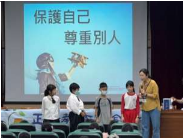
說明：宣導課程後，有獎徵答時間。