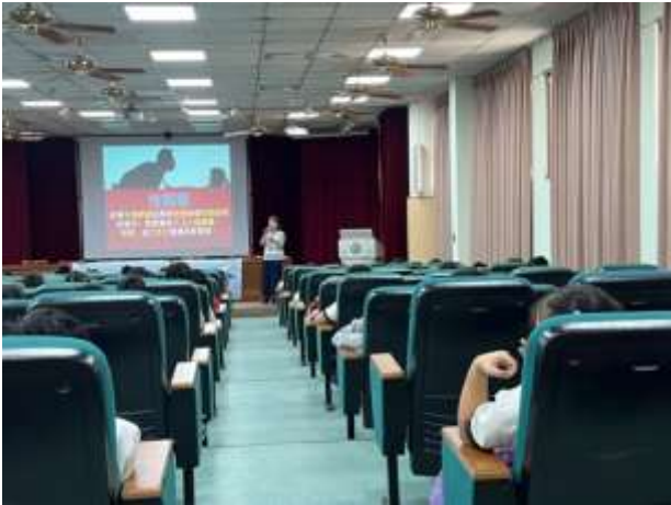
說明：宣導如何保護自己拒絕性騷擾。