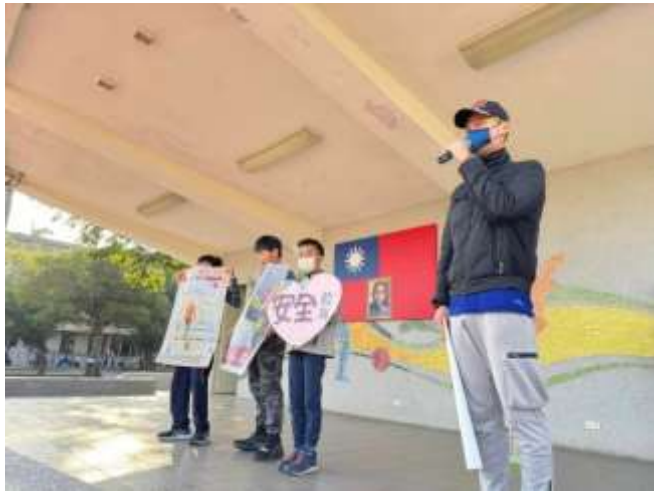
升旗活動宣導友善校園