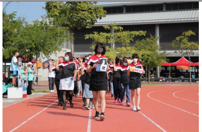
邀請本校地區志工團成員參與