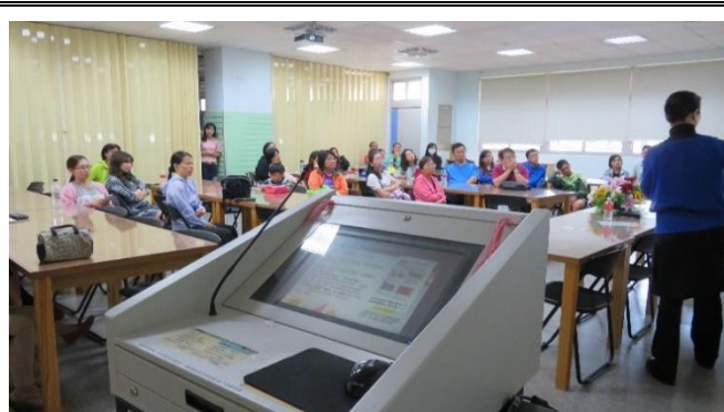
說明：家長成長團體菸檳教育宣導。