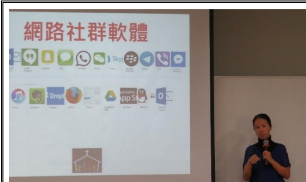
說明：家長成長團體菸檳教育宣導。