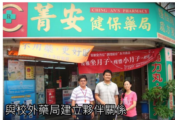
說明：與校外藥局建立夥伴關係。