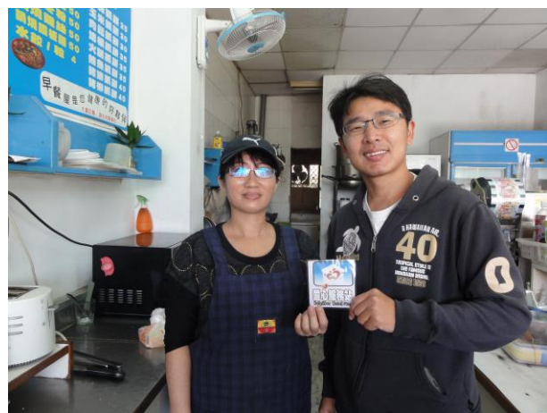
說明：招募校外商店，成為愛心商店。