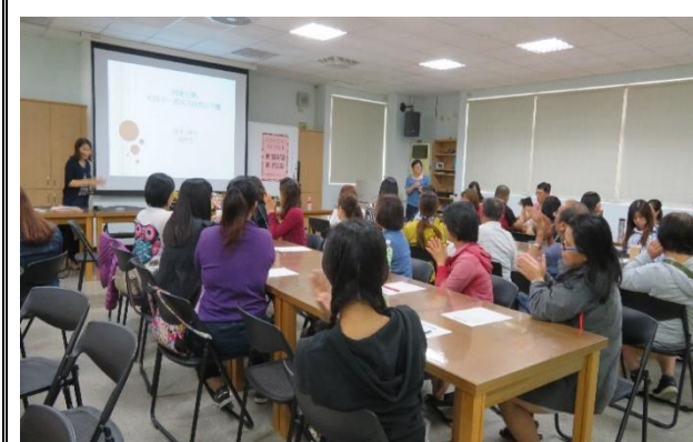
說明：家長成長團體菸檳教育宣導。