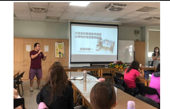
說明：家長成長團體菸檳教育宣導。