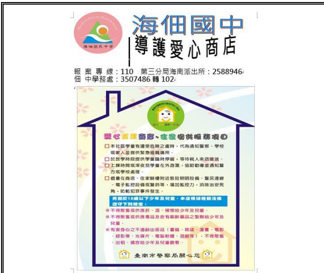
說明：本校愛心商店樣張。