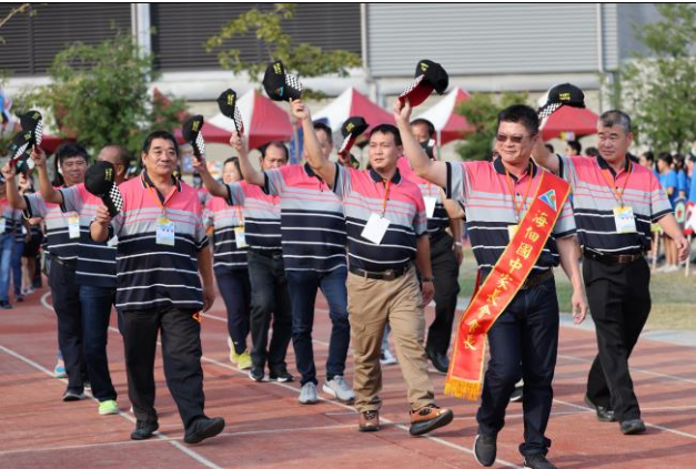
邀請本校家長會成員參與