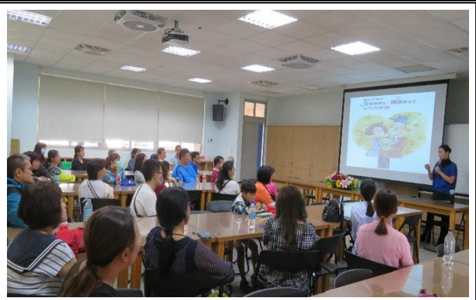
說明：家長成長團體菸檳教育宣導。