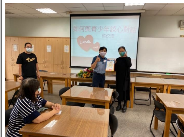
說明：家長成長團體菸檳教育宣導。