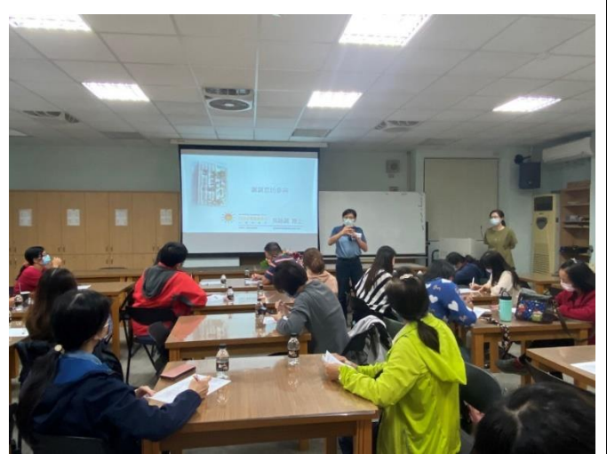
說明：家長成長團體菸檳教育宣導。