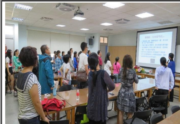
說明：家長成長團體菸檳教育宣導。