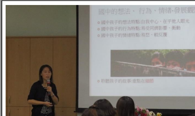
說明：家長成長團體菸檳教育宣導。