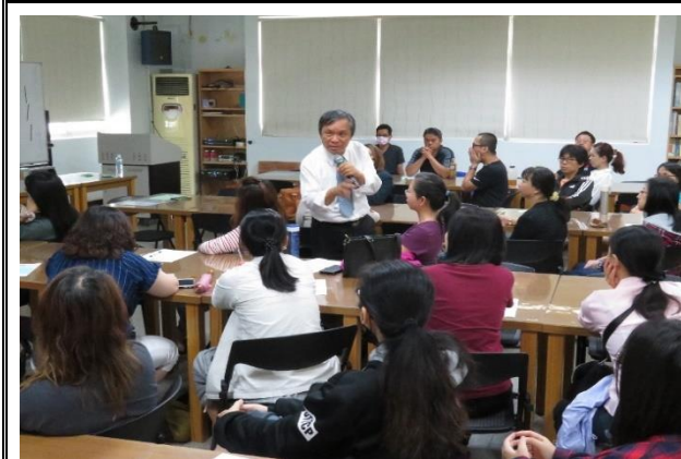
說明：家長成長團體菸檳教育宣導。