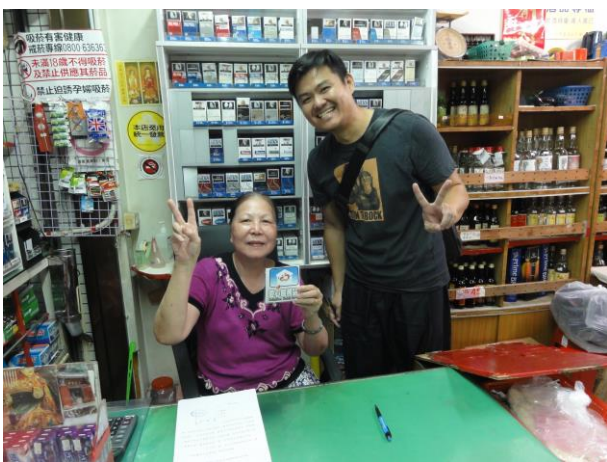
說明：招募校外商店，成為愛心商店。