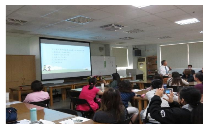
說明：家長成長團體菸檳教育宣導。