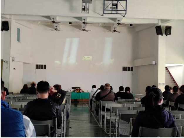
利用學校班親會傳達健康訊息