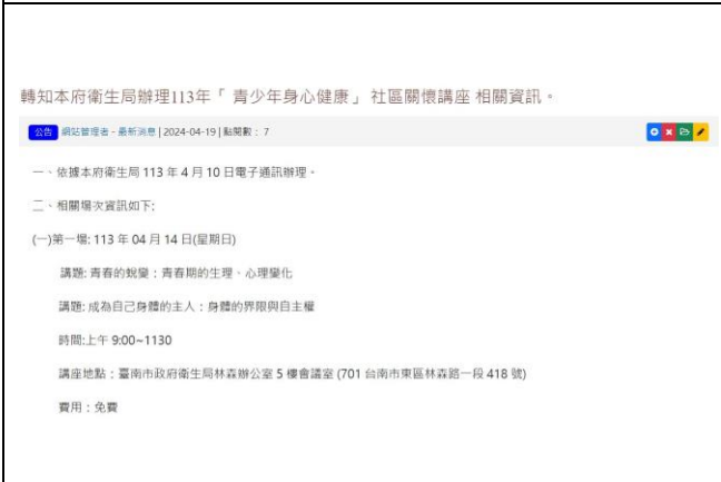
健康促進宣導網站宣傳健康資訊