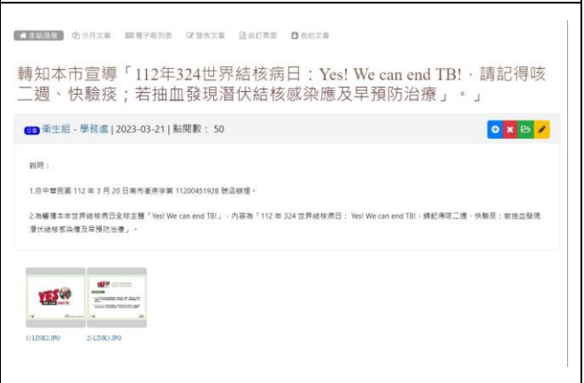
學校首頁宣傳健康資訊