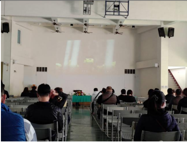
利用學校班親會傳達健康訊息