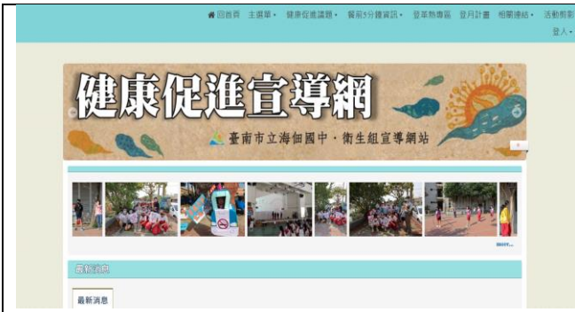
本校健康促進宣導網站