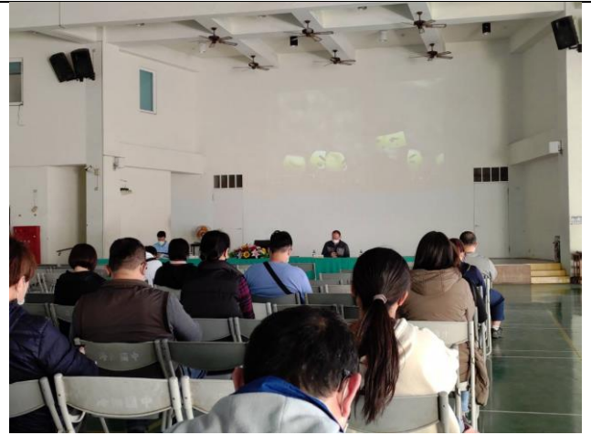
利用學校班親會傳達健康訊息