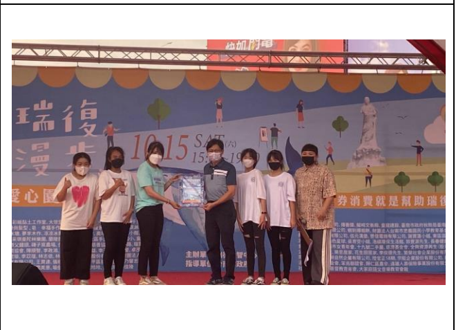
參與瑞復益智中心園遊會- 進行義賣及健康諮詢服務