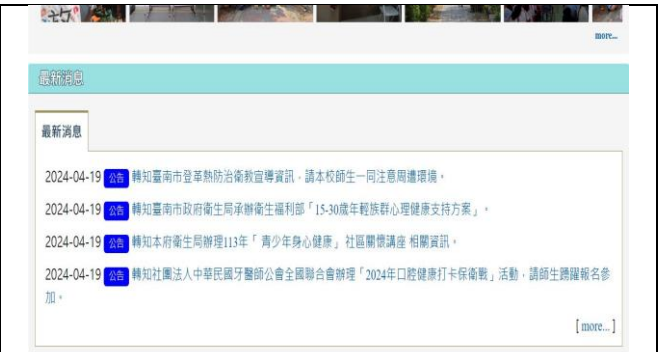
即時更新最新消息