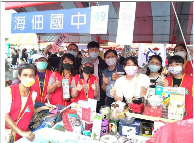
參與瑞復益智中心園遊會- 進行義賣及健康諮詢服務