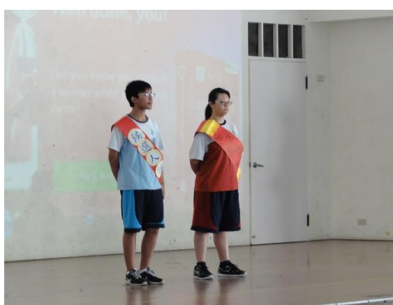
學生主席團參與學校活動