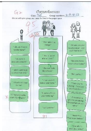
反霸凌融入英文繪本