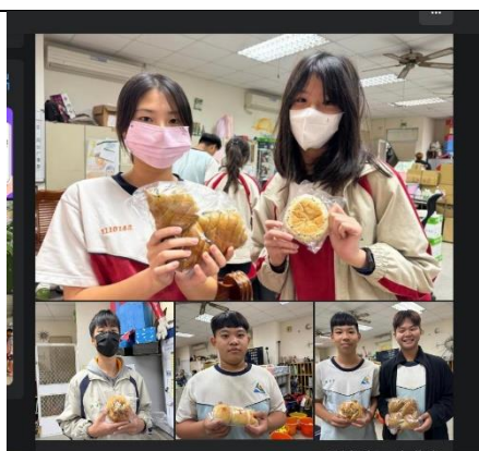
媒合愛心商店提供弱勢學生愛心麵包