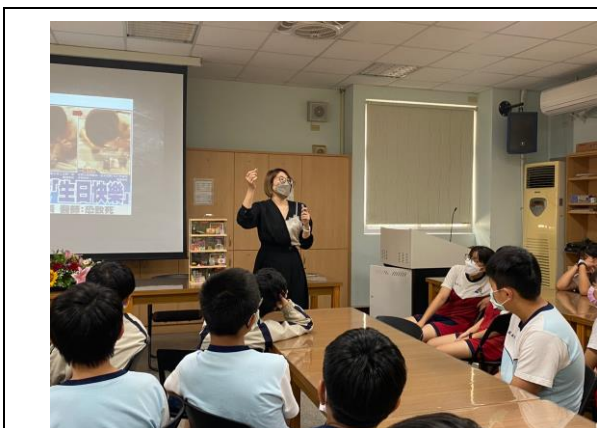
反霸凌師資入班宣導