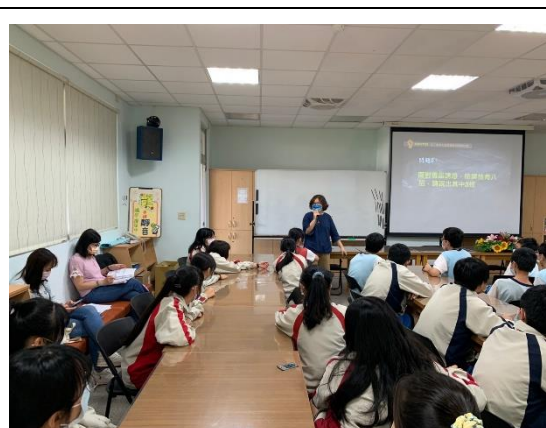
反霸凌師資入班宣導