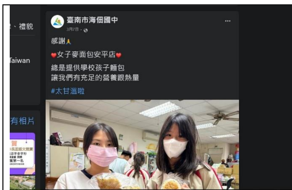
媒合愛心商店提供弱勢學生愛心麵包