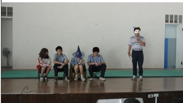
反霸凌融入戲劇表演