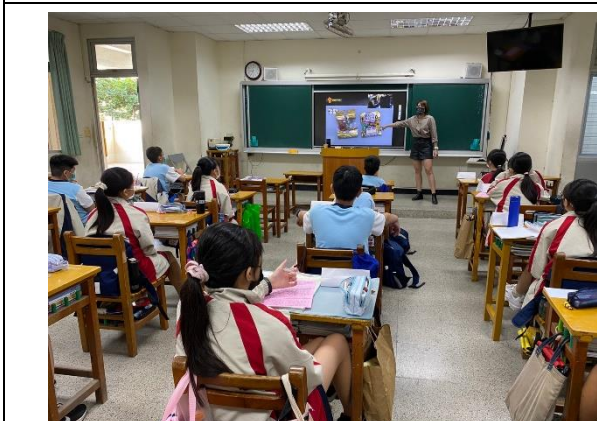
反霸凌師資入班宣導