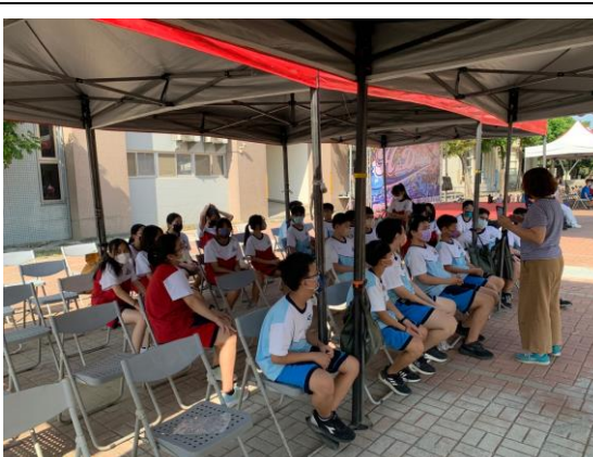
反霸凌師資入班宣導