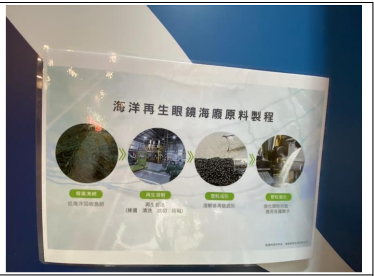
海洋教育-參觀校外工廠