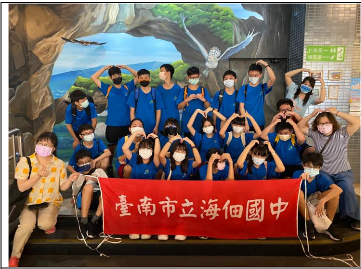
海洋教育-參觀校外工廠