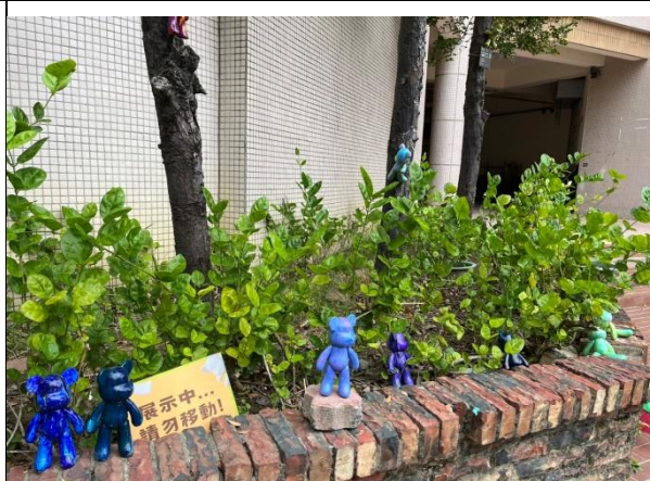
說明：視覺藝術作品，佈置校園