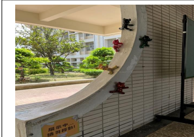
說明：視覺藝術作品，佈置大玄關