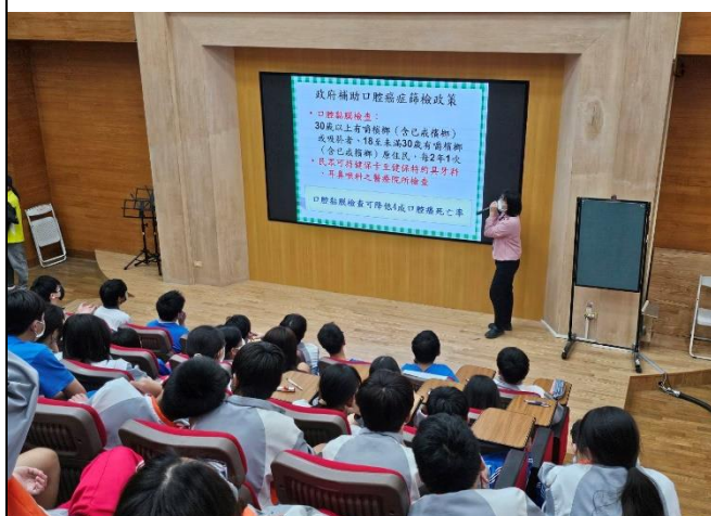
說明：政府補助口腔癌症篩檢政策