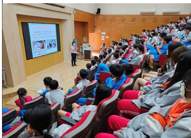
說明：電子菸除了危害健康問題，還有自燃和爆炸的風險