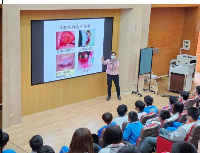
說明：口腔癌的癌前病變