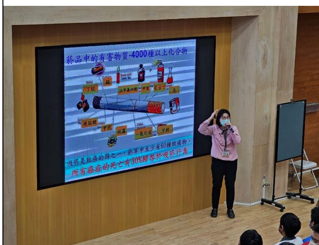
說明：菸品中的有害物質達 4000 種以上