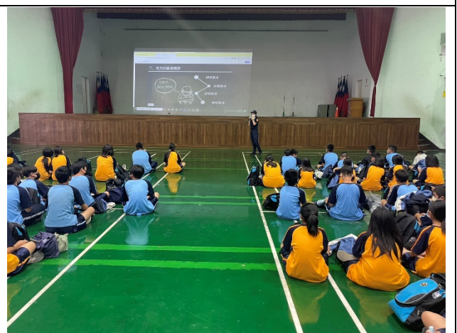
金華所員警宣導(四)