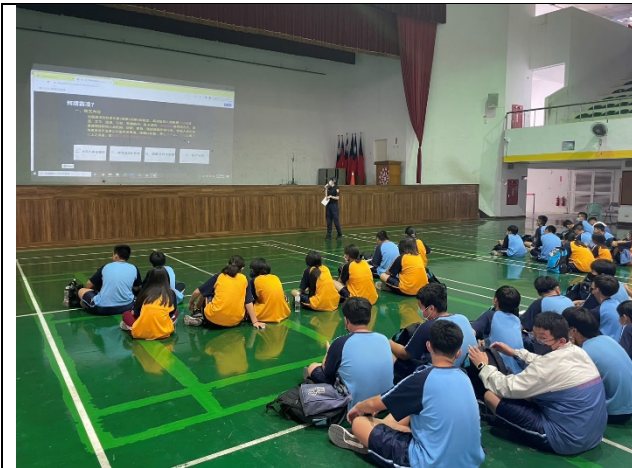
金華所員警宣導(一)