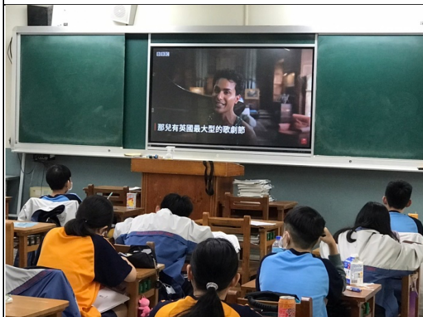
多元性別平等教育影片觀賞