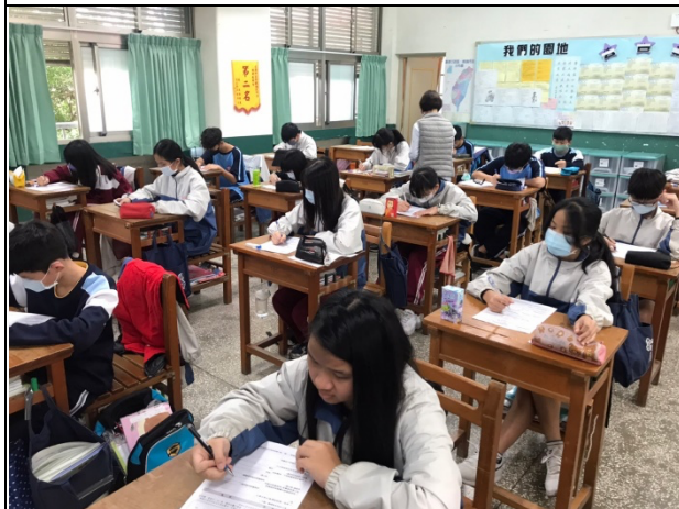
學生書寫觀影心得實況