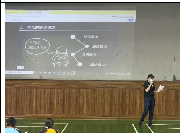
金華所員警宣導(三)