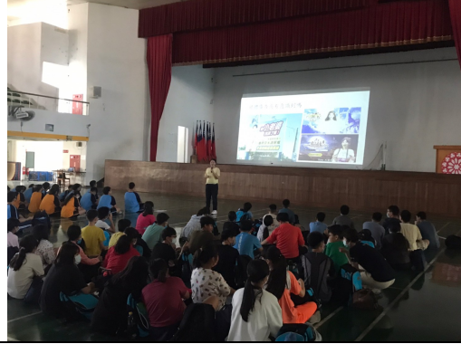
臺南市立新興國中112學年度性別平等教育講座 （親密關係暴力、數位性剝削防治）教師研習表列表 ●時間：2023/9/25 14:25-15:25 ●地點：新興館