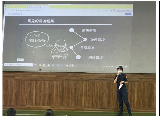
金華所員警宣導(二)