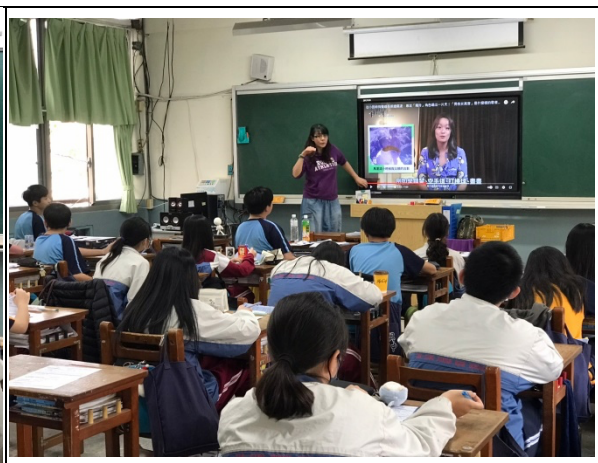
導師說明多元性別及防治數位性別暴力