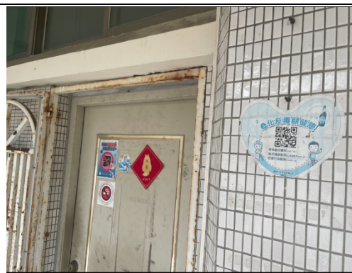
建構健康環境宣導