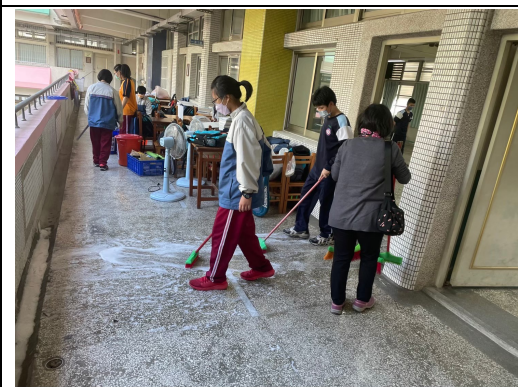
班導師指導學生進行環境清潔