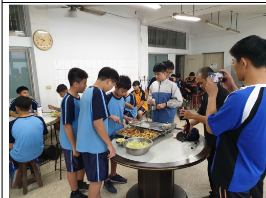
聘請外師到校指導健康飲食