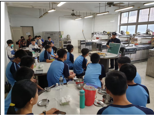
聘請外師到校指導健康飲食