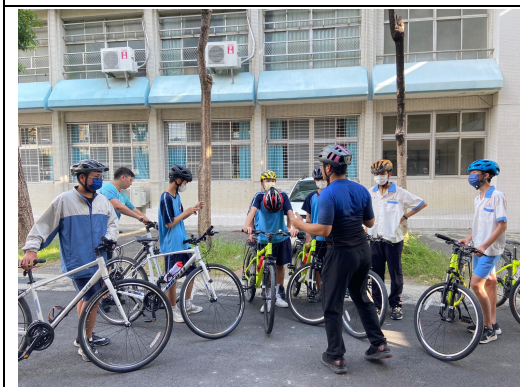
社團老師指導健康安全自行車活動