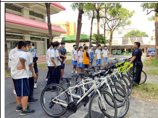
社團老師指導自行車社團