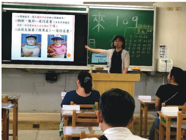
班親會導師針對家長進行健康檢查胸廓檢查和尿液檢查注意事項說明