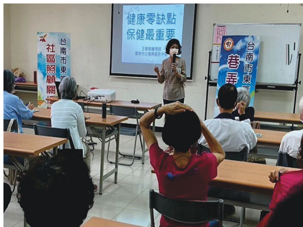
與社區照顧關懷中心合作辦理講座