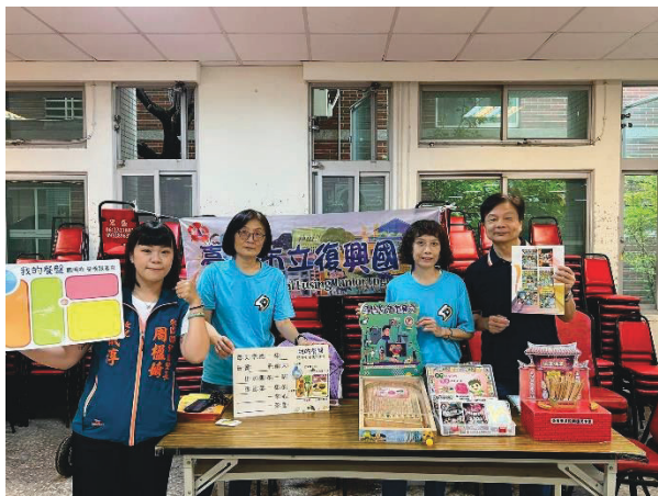
關聖里里長助理代表出席健促闖關活動