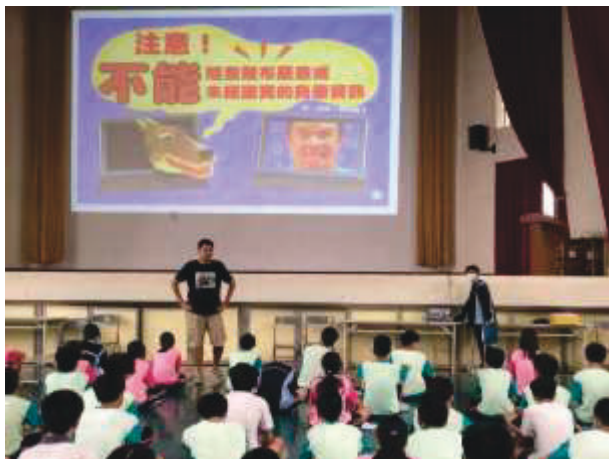
說明：散播不實負面訊息也是霸凌