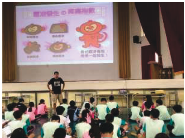
說明：講解霸凌分類