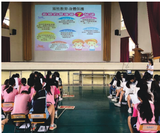
說明：講解拒絕約會強暴七招

說明：為建立無性別歧視與無暴力之校園環境，培養學生正確的性知識與健康的兩性關係，與台南市衛生局共同辦理正確兩性關係宣導。讓學生了解並能學習尊重異性與人際互動技巧，以增進人際關係。