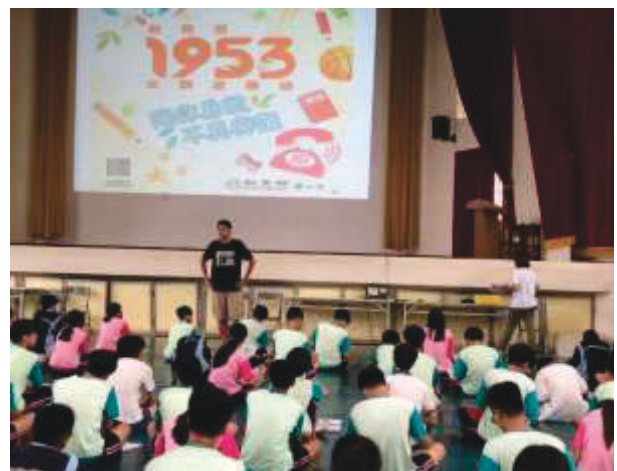
說明：講解介紹反霸凌專線