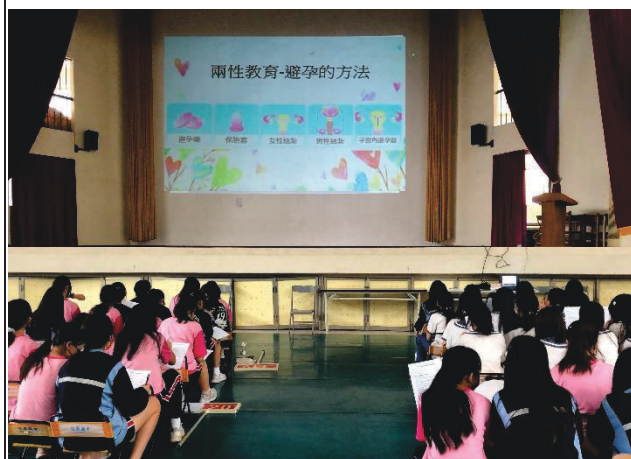
說明：介紹避孕方法