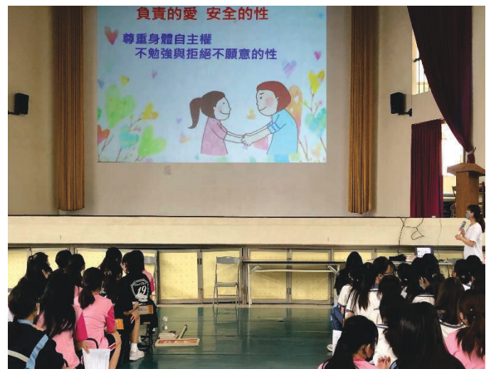
說明：提醒學生尊重身體自主權要勇敢說不