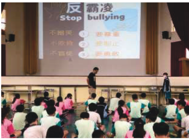
說明：當發現同學被霸凌應有態度

說明：生教組藉由幹部訓練時宣導「拒絕校園霸凌」，應有「同理心」、「友善、責任感」、「包容、尊重個體差異」及「知道遇到霸凌事件時可尋求的解決方法」等認知，讓我們在校園中能夠快樂學習、成長。