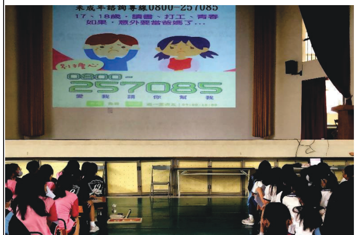
說明：講解未成年意外懷孕尋求協助專線