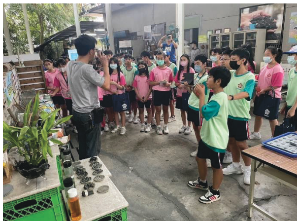
說明：菱殼變菱炭製作過程解說