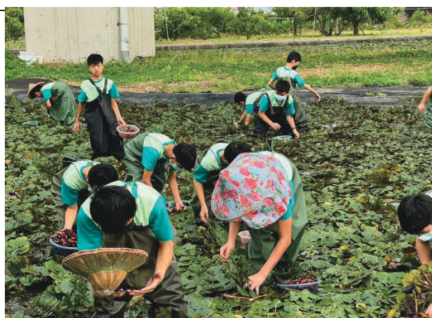
說明：體驗採菱活動