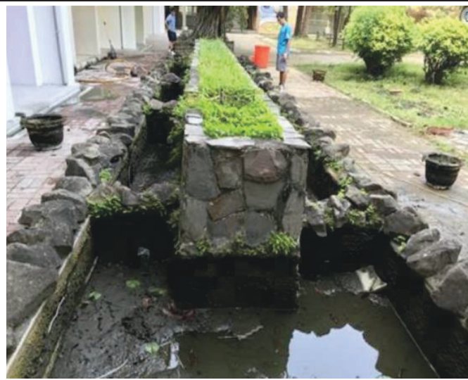
說明:師長清除水池爛泥。