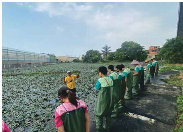
說明：採收菱角時注意事項講解