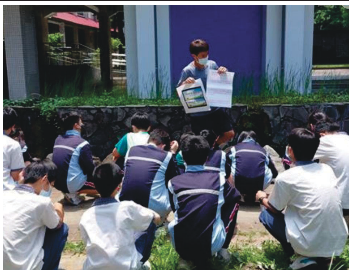
說明:老師環境永續宣導。