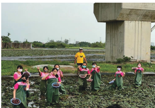
說明：初次體驗成果豐碩