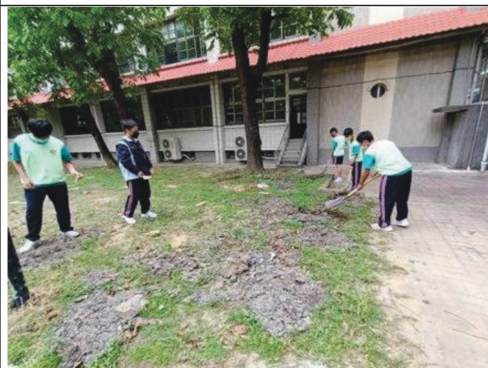
說明:學生協助將爛泥堆在旁邊的花圃養護草皮的土壤。