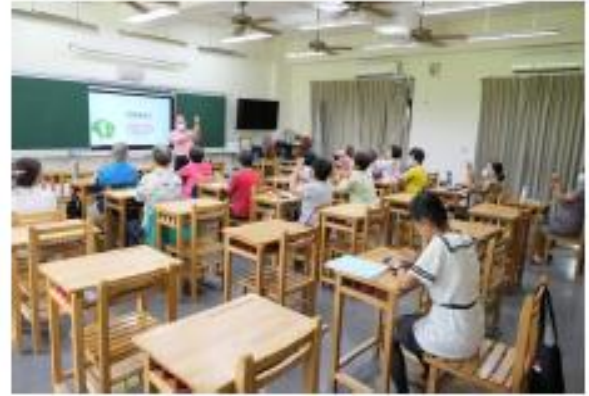
按摩神經血管穴道