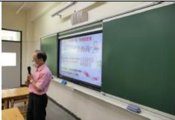
長者跌倒的危險性