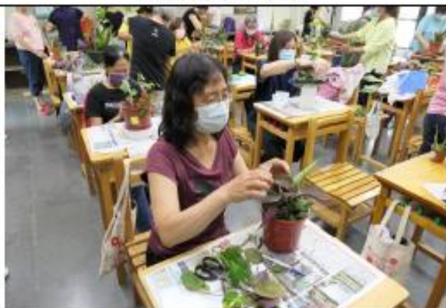
弄花拈草做出喜歡的樣式