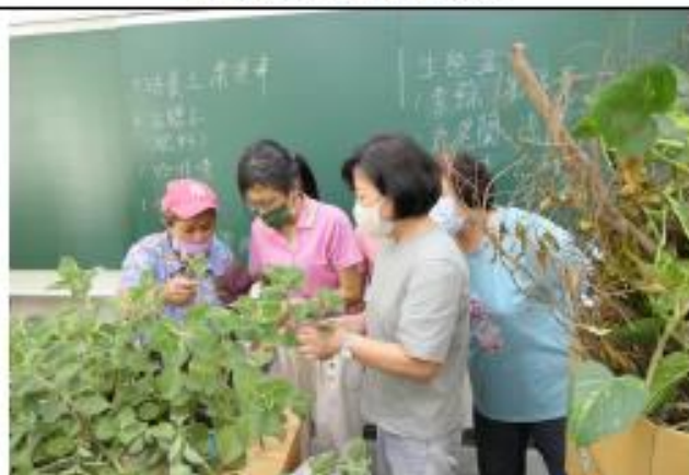
學員開始採集花草