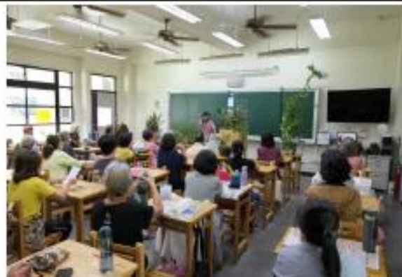
講師解說花草植栽注意事項