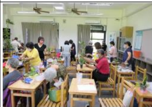
全班學員每人皆變成花草藝術家