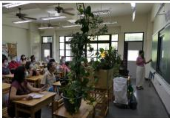
講師解說花草植栽方式