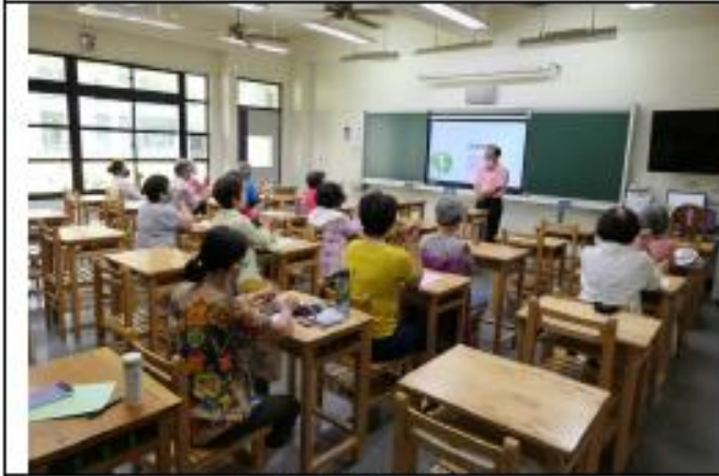
長者跌倒注意事項