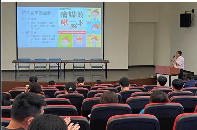
說明：透過校務會議宣導「我的餐盤」健康飲食