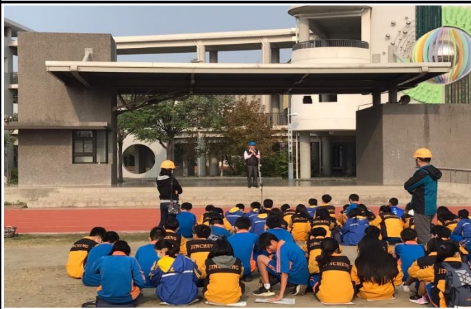
說明：校長帶領進行防震防災宣導