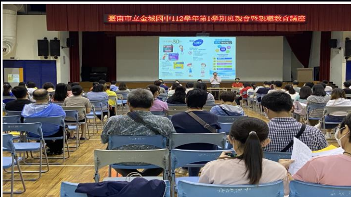
說明：校長於班親會時進行健康促進宣導