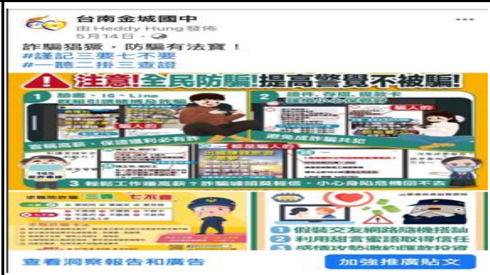
說明：運用臉書平台傳達健康促進議題資訊