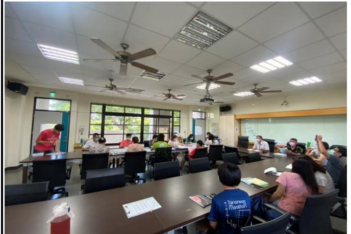
說明：召開健康促進委員會