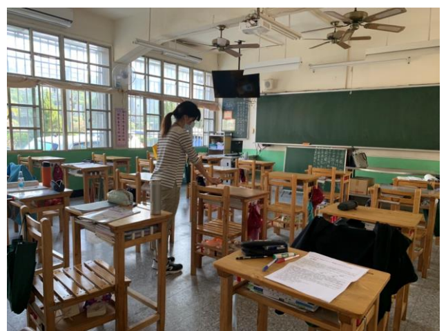
進行班級照度測量