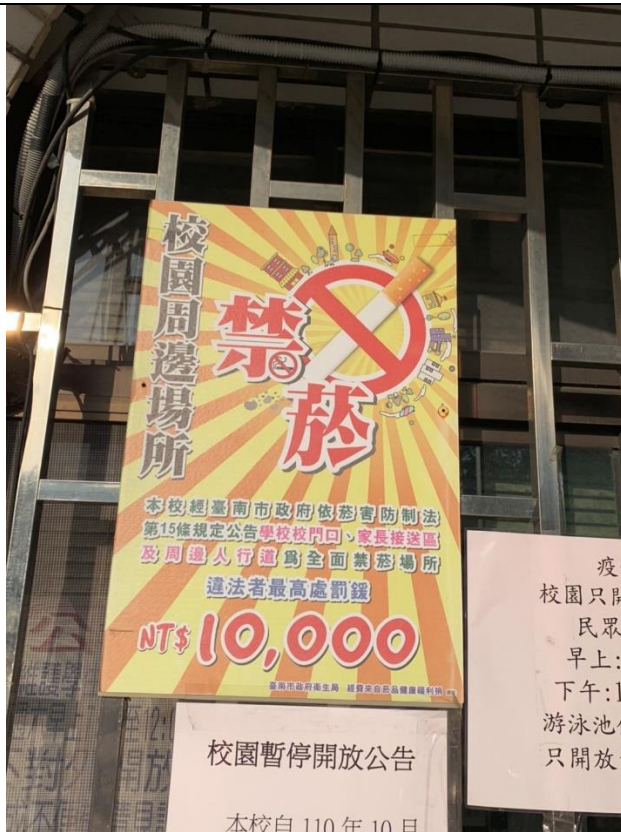
於校門口及校園內放置各式戒菸、 拒菸標誌