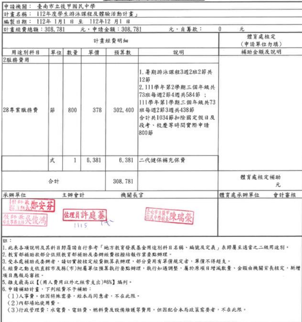
臺南市體育局補助經費概算表