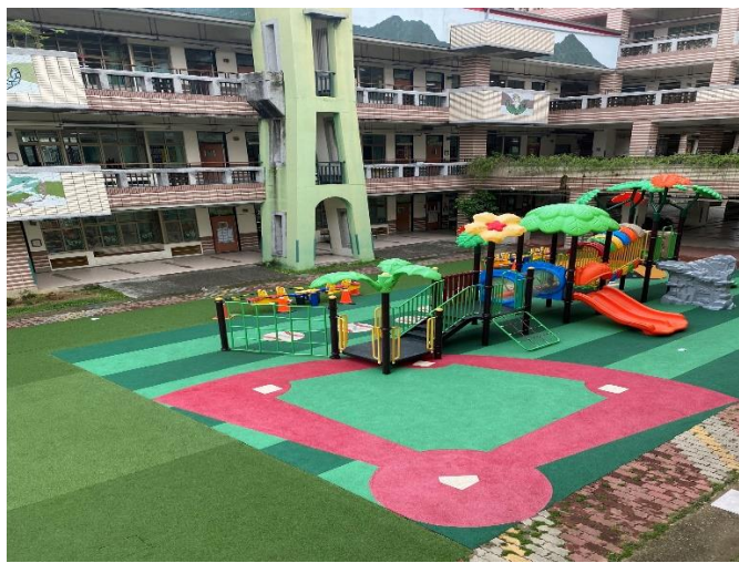
以棒球場為主題，設計兒童遊樂場