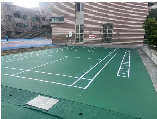
戶外羽球場、繩梯場、立定跳遠規劃