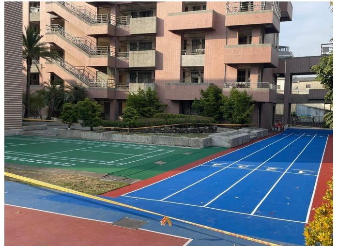
搭配 112 全國運進行校園情境設計