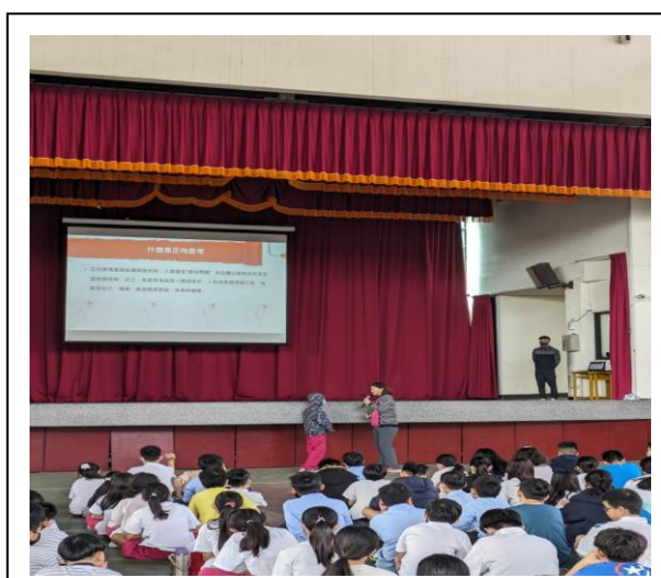
正向心理健康促進