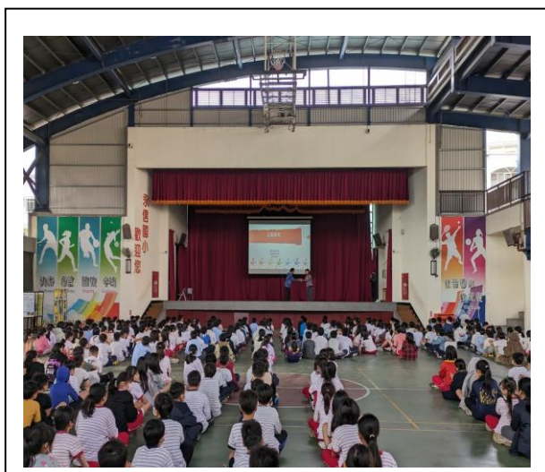
正向心理健康促進