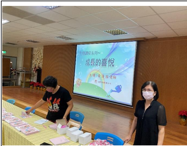
生理講座-成長的喜悅： 穿出健康、穿出美