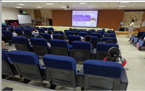
性別平等與生理衛生講座： 認識性騷擾