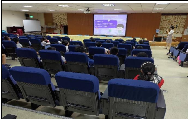
性教育與生理衛生講座： 認識性騷擾