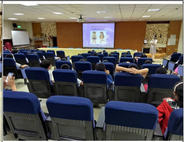
性教育與生理衛生講座： 身體自主權-我是我自己的主人