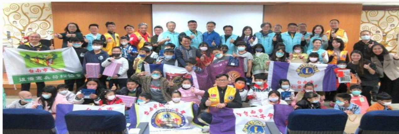
北門獅子會偕同永信國小家長會舉辦寒冬送暖耶誕節圓夢活動，並與獅子會友會獅友一同響應認購愛心禮物，送給許下願望學童，幫忙實現耶誕美夢。