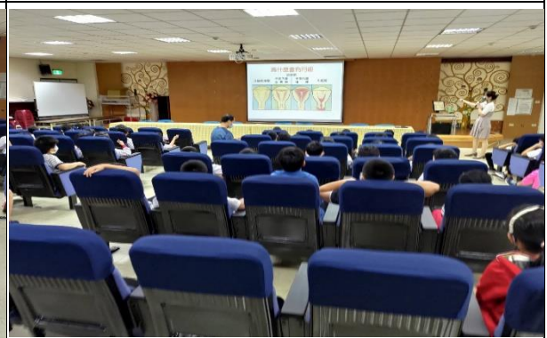
性教育與生理衛生講座： 為什麼會有月經