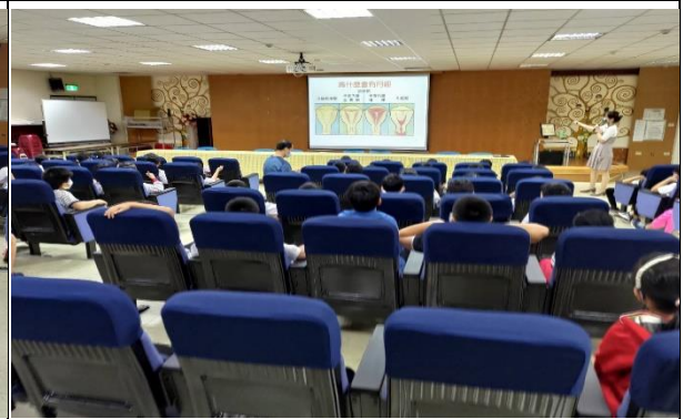
性別平等與生理衛生講座： 為什麼會有月經