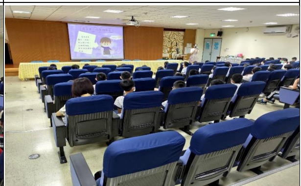
性教育與生理衛生講座： 男女第二性徵的發育