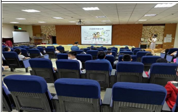
性教育與生理衛生講座： 正確使用衛生棉