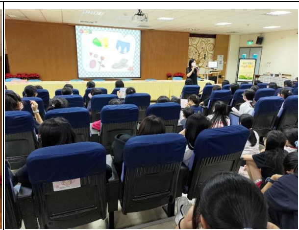
生理講座-成長的喜悅： 女生月經期的認識與正確處理