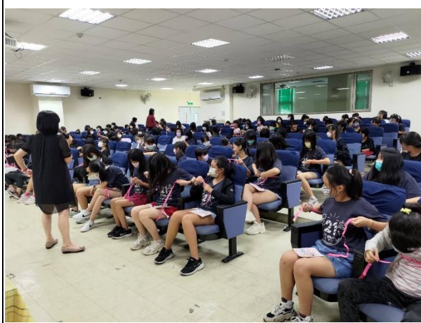
生理講座-成長的喜悅： 女生乳房生長三階段→正確穿著、健康成長