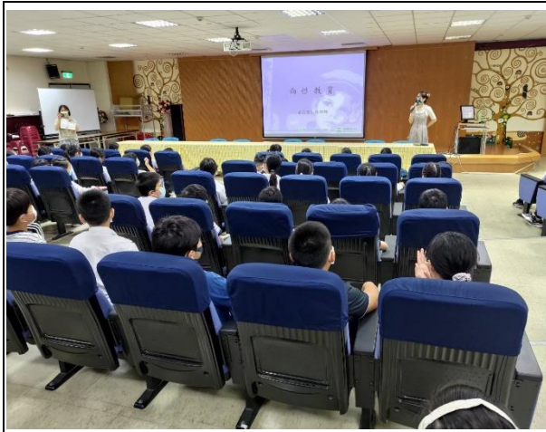
性別平等與生理衛生講座： 兩性教育