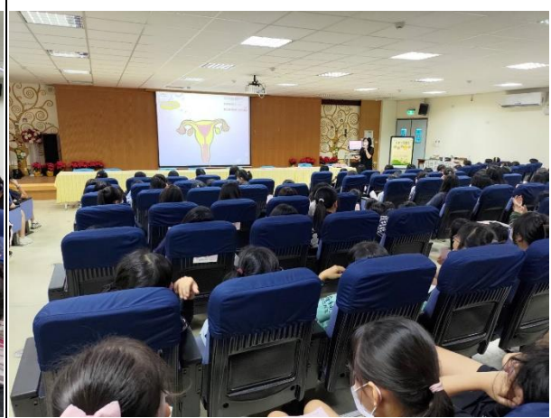
生理講座-成長的喜悅： 介紹女生子宮構造