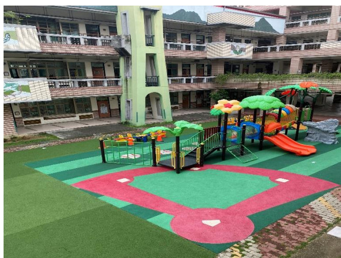
以棒球場為主題，設計兒童遊樂場