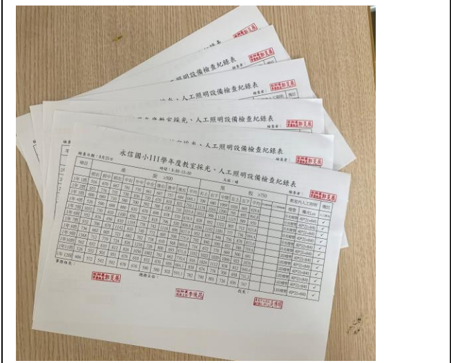
教室照明度檢查紀錄 111 上下學期