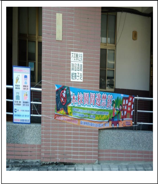
無菸無毒環境營造紀錄