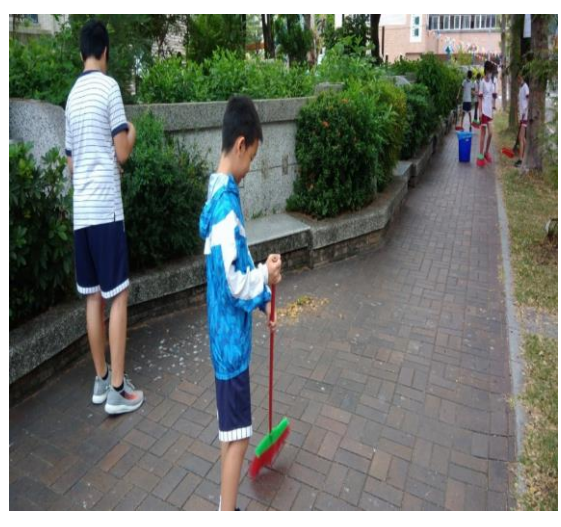
學生參與校園綠化美化工作