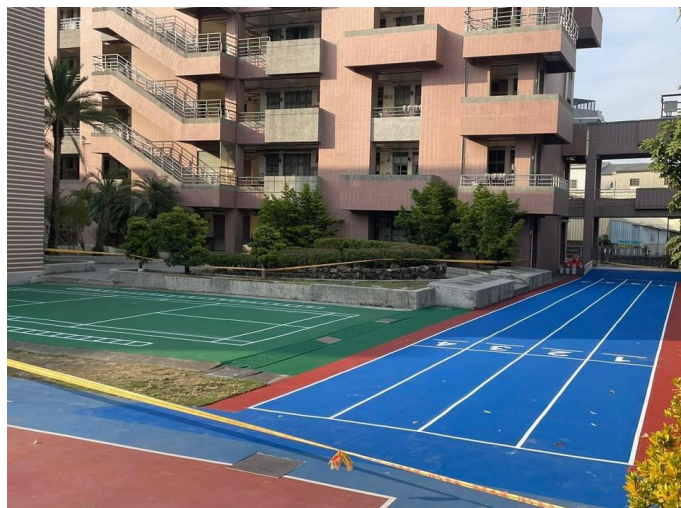
搭配 112 全國運進行校園情境設計