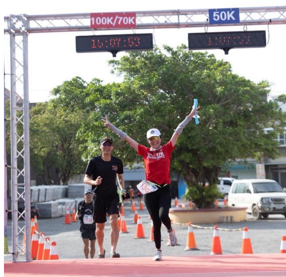
百 K 超馬完成