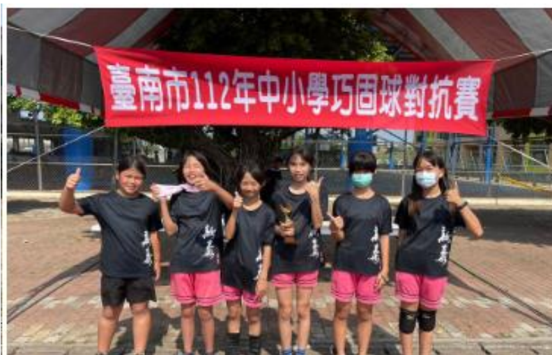
四年級女生組單網賽第一名