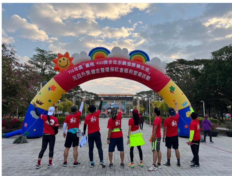
2024台南400元旦路跑活動