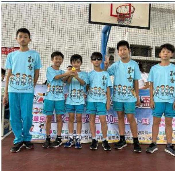
團體競速 男子組第三名