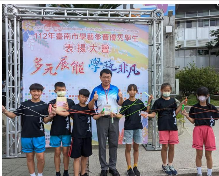
校長嘉許同學多元展能 學藝飛凡