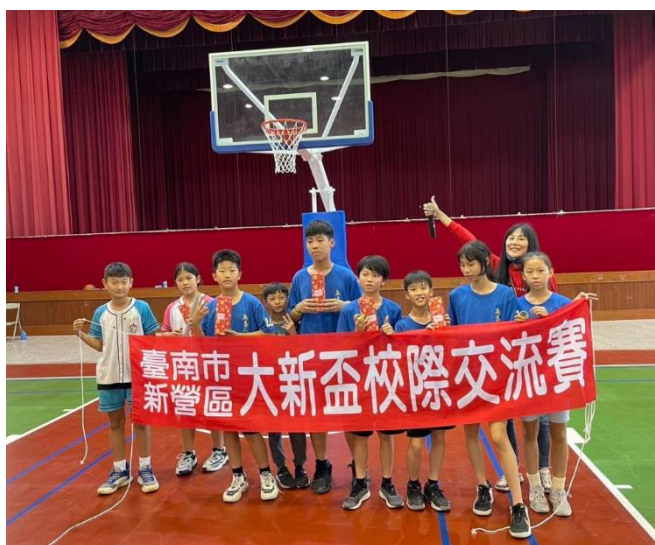
男子組第一名女子組第一名大合照