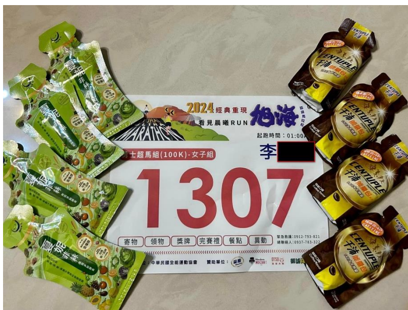
旭海百 K 超級馬拉松賽號碼布