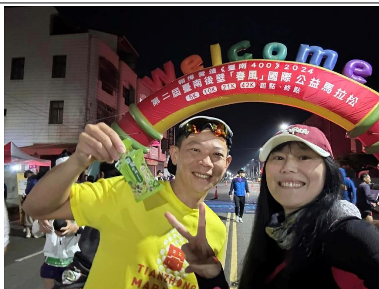
後壁春風國際馬拉松