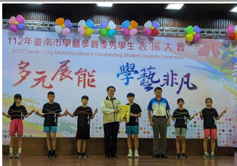
學生表現優異上台受獎