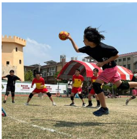
比賽時學生認真的英姿